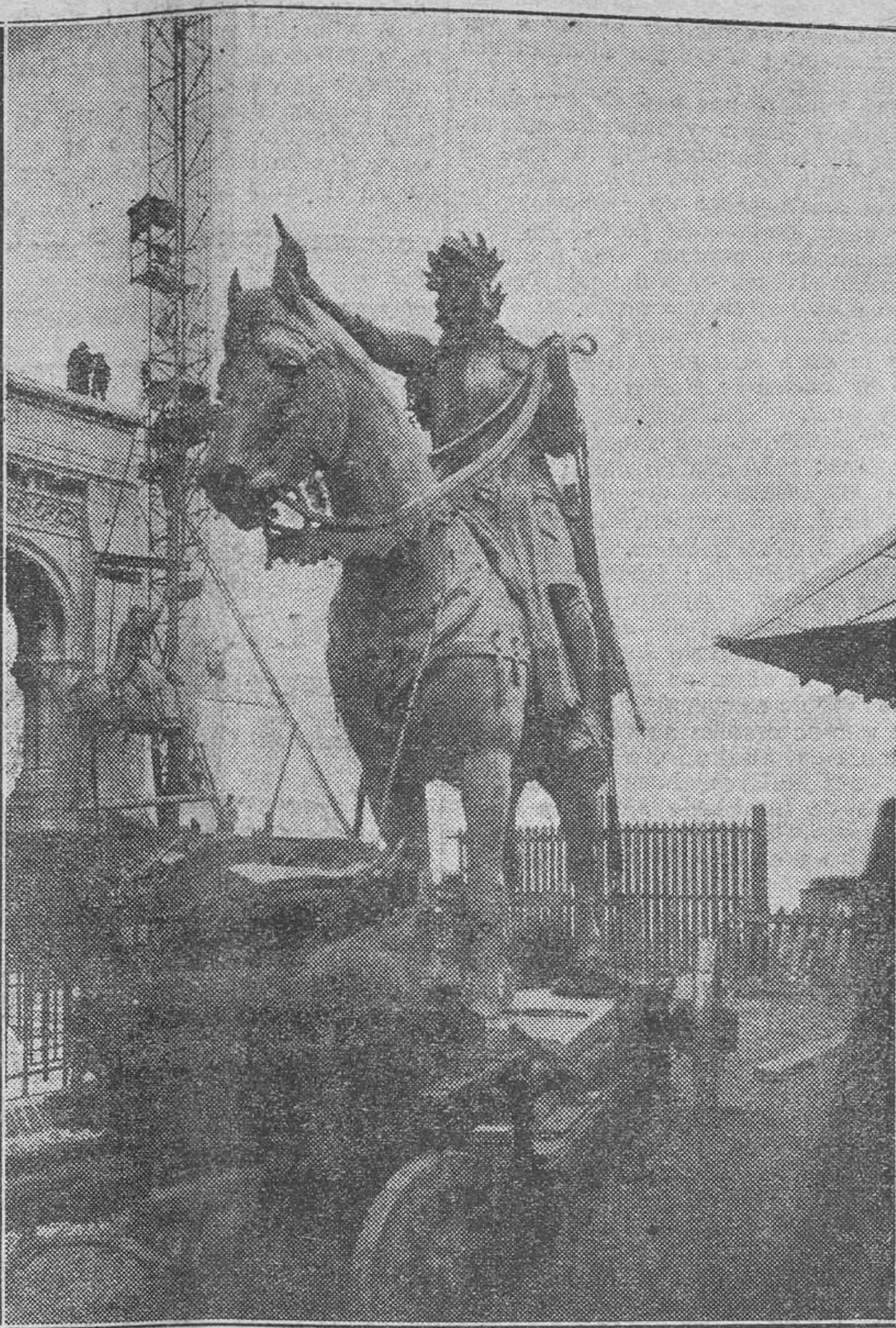
Estatua de Juana de Arco, que será colocada en el frente de la iglesia del Sacre Coeur.

BIBLIOTECA DE LA REVISTA DE DERECHO PRIVADO. Acaban de aparecer. Los Daños Civiles, de Fischer. La Condena en Costas, de Chiovenda. De venta, en todas las buenas librerías.