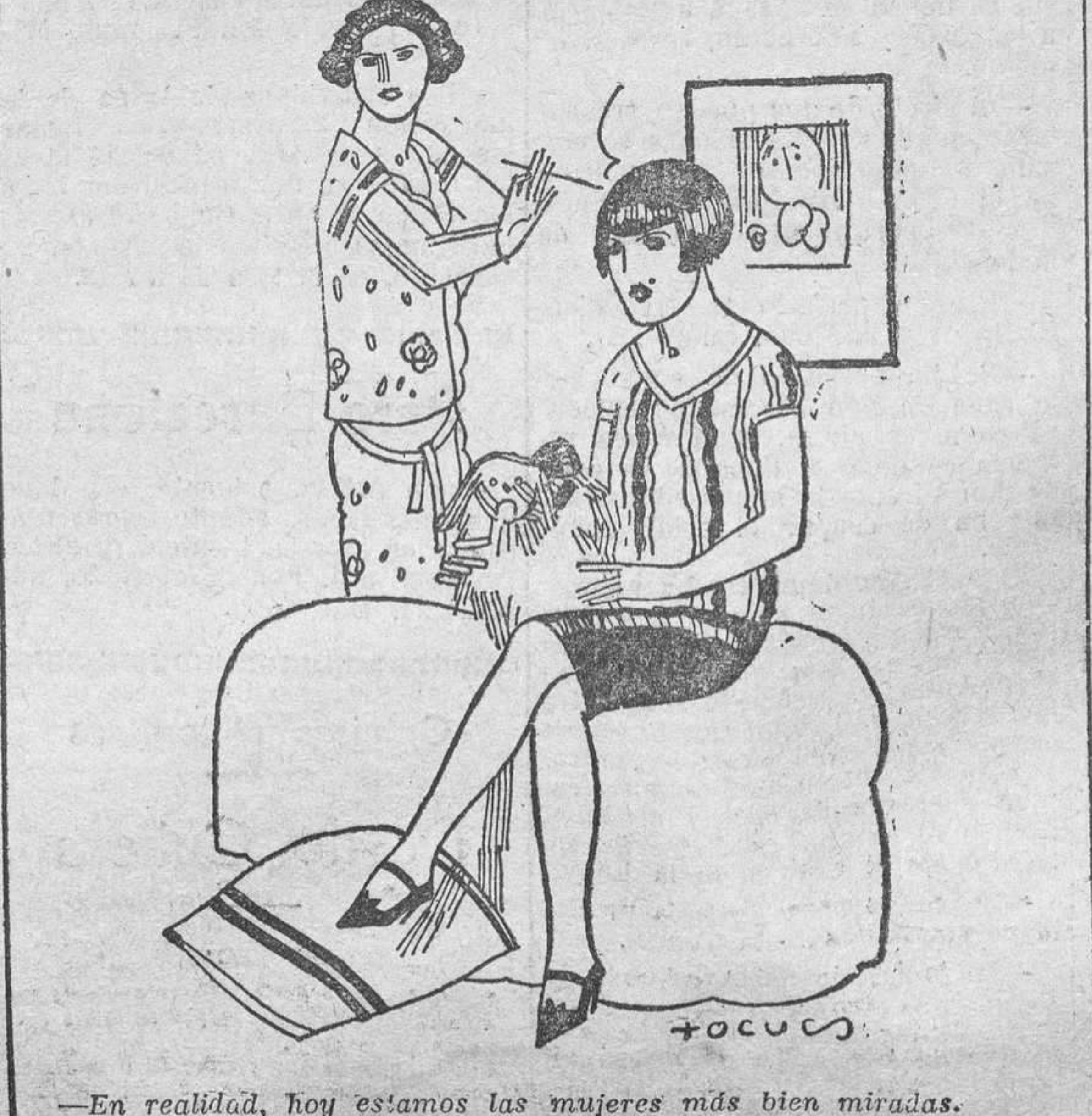
—En realidad, hoy estamos las mujeres más bien miradas. —No te queda duda; como que vamos más cortas.