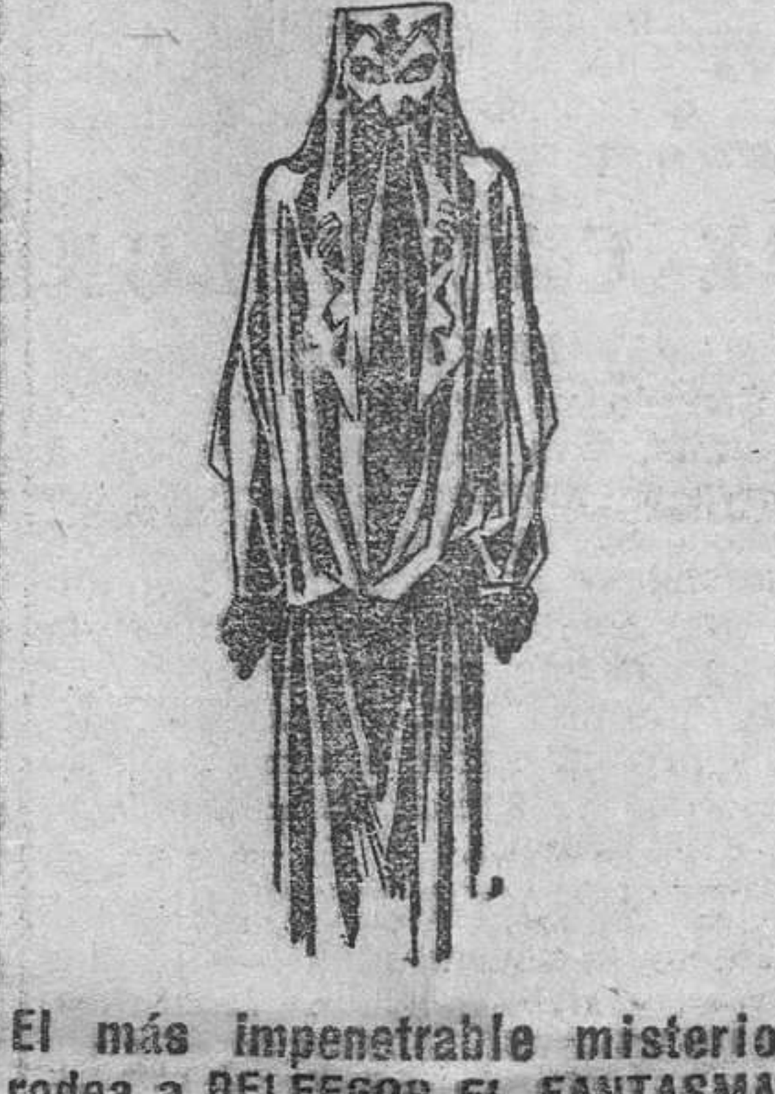
El más impenetrable misterio rodea a BELFEGOR EL FANTASMA DEL LOUVRE

El CORRESPONSAL. Novelda 17 de Julio de 1927.