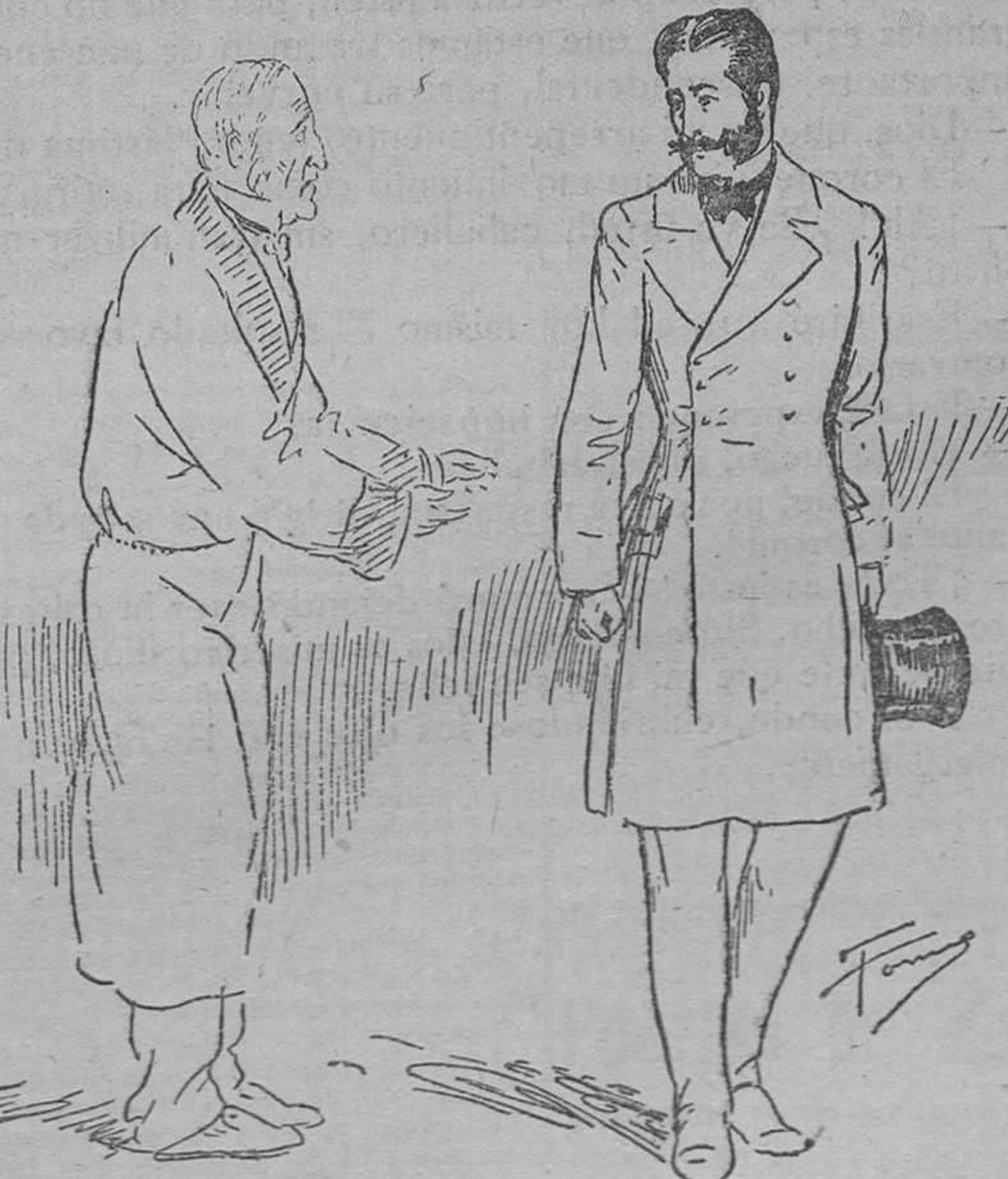
El coronel hizo un movimiento para retirarse.