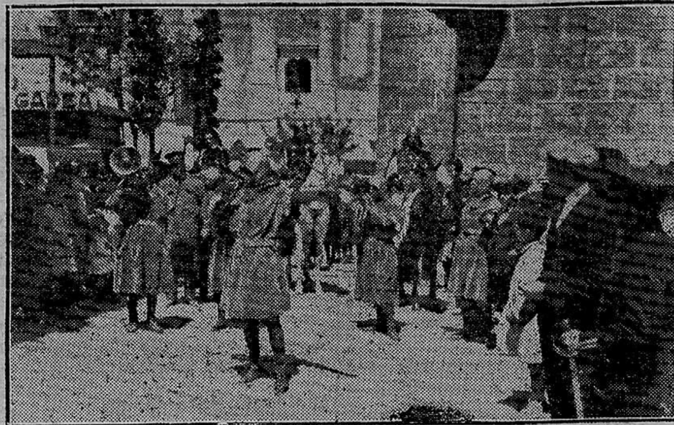
El objetivo ha sabido sorprender, en su camino, a una «comparsa» de valientes cristianos...

N. GARCIA MONLLOR Ciudad, Primavera de 1925.