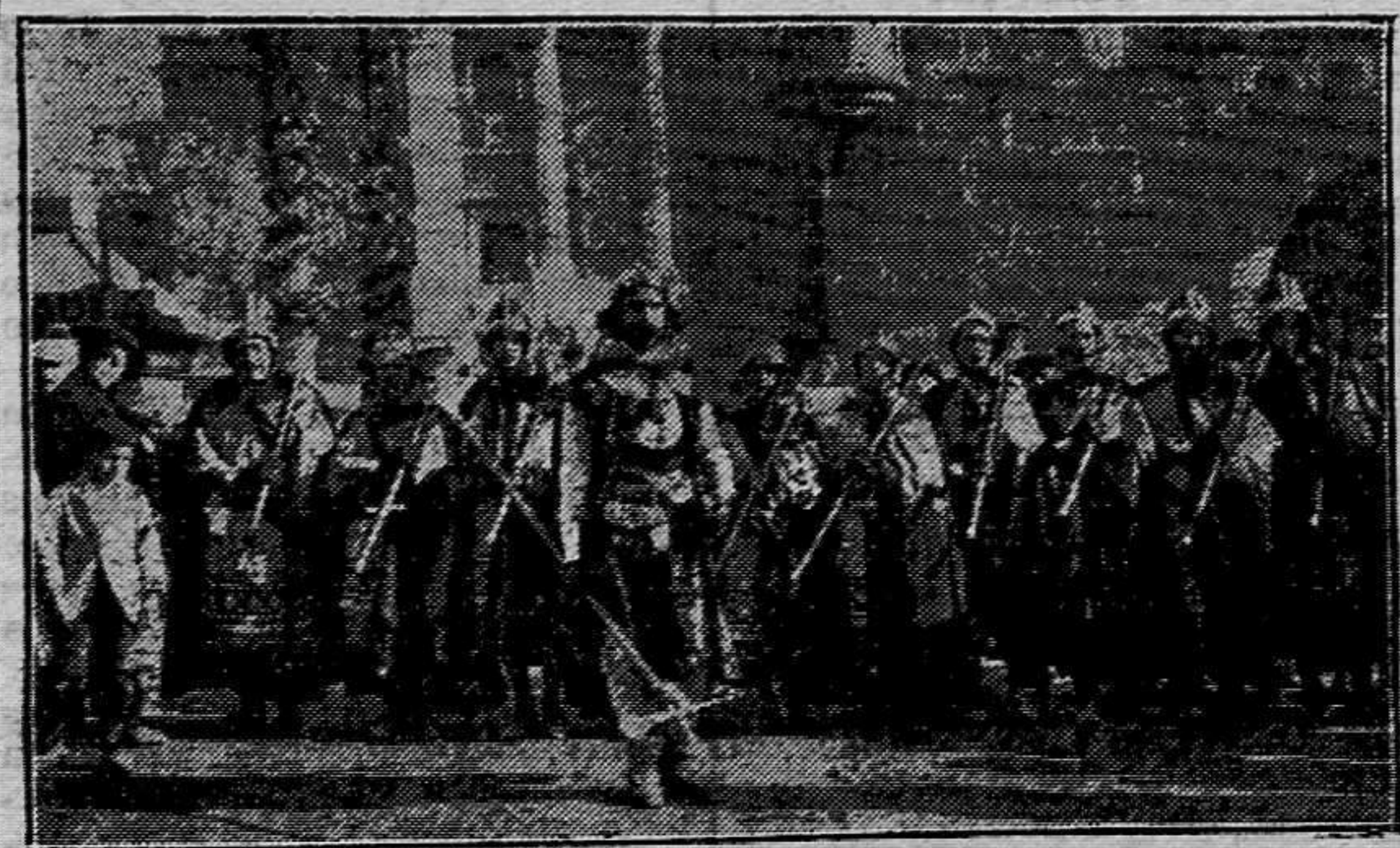
Los sonidos épicos de los clarines, parecen pregonar anuncios de combates cruentos...

La industria es lo que hace ricos a los pueblos. El deporte, lo que les da fortaleza. La virtud, lo que les ennoblece y dignifica. Pero cuando un pueblo es paria de uno o de varios hombres ilustres, que llegaron hasta el fastigio del humano saber, y que cristalizaron sus pensamientos en obras sublimes, ese es inmortal, porque su nombre, envuelto en una dorada aureola, pasará de generación en generación sin marchitarse, bien así como las robustas pirámides egipcias afrontan, sin decaer, el embate de los siglos.