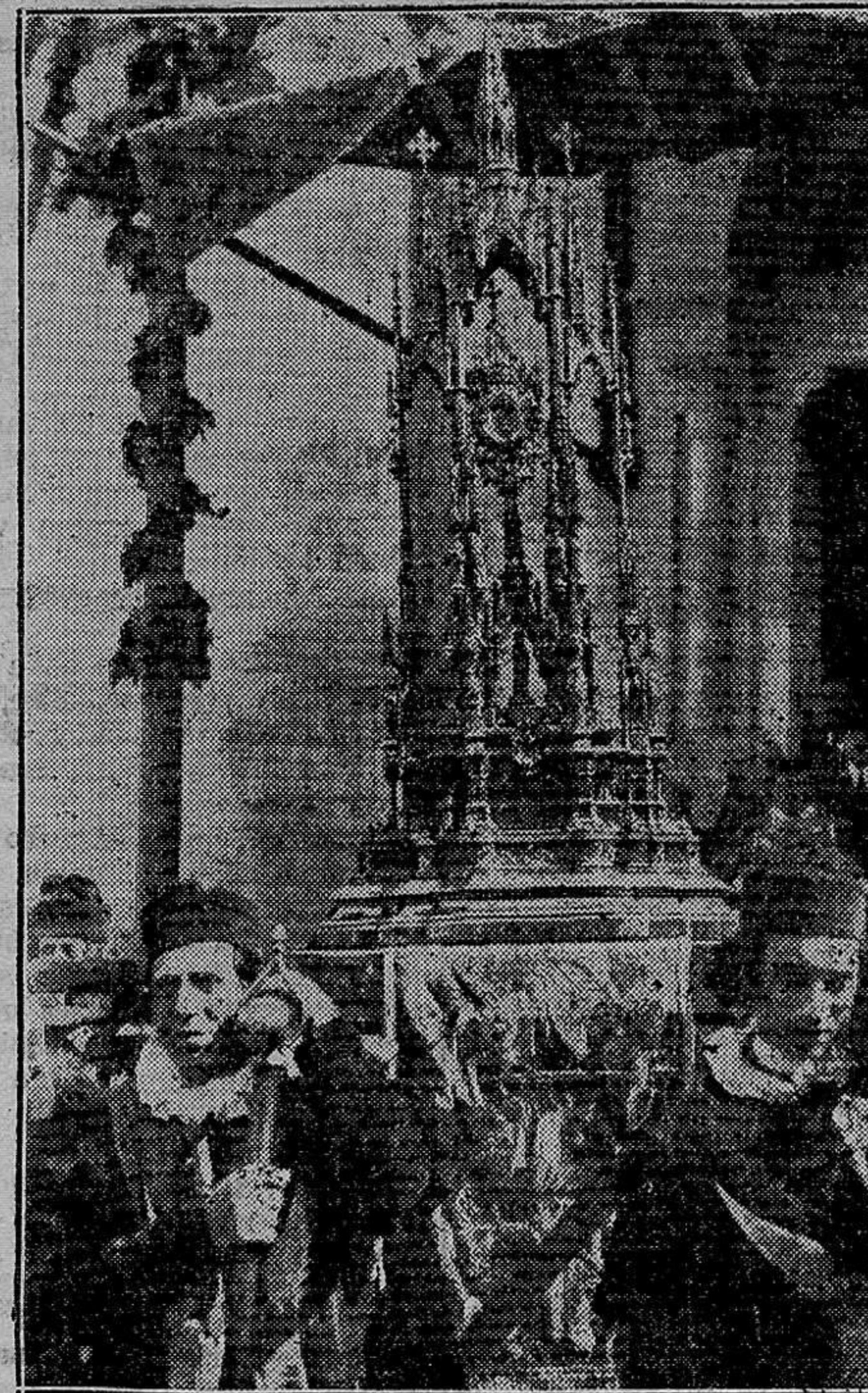
Ante el paso de la sacra reliquia del mártir San Jorge, un gran fervor cunde entre la multitud...