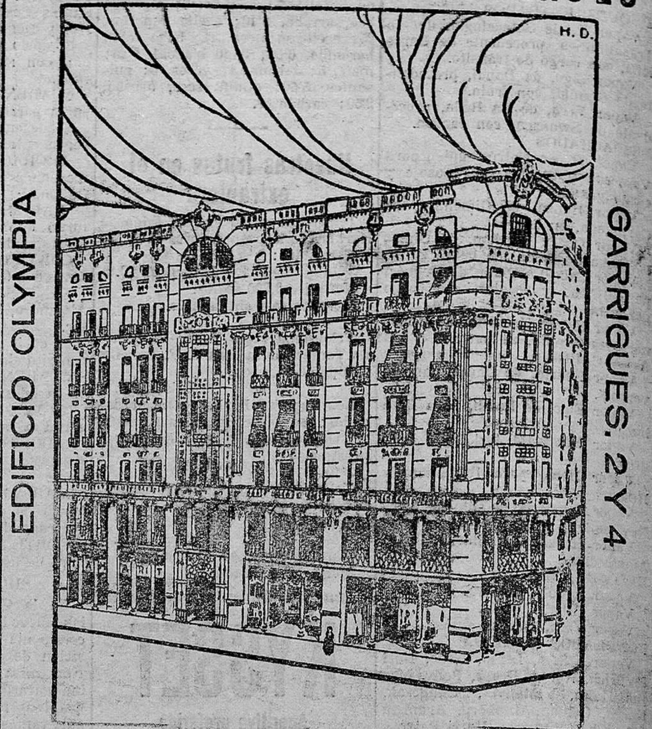
EDIFICIO OLYMPIA GARRIGUES. 2 Y 4 VICENTE TAMARIT MOLINA