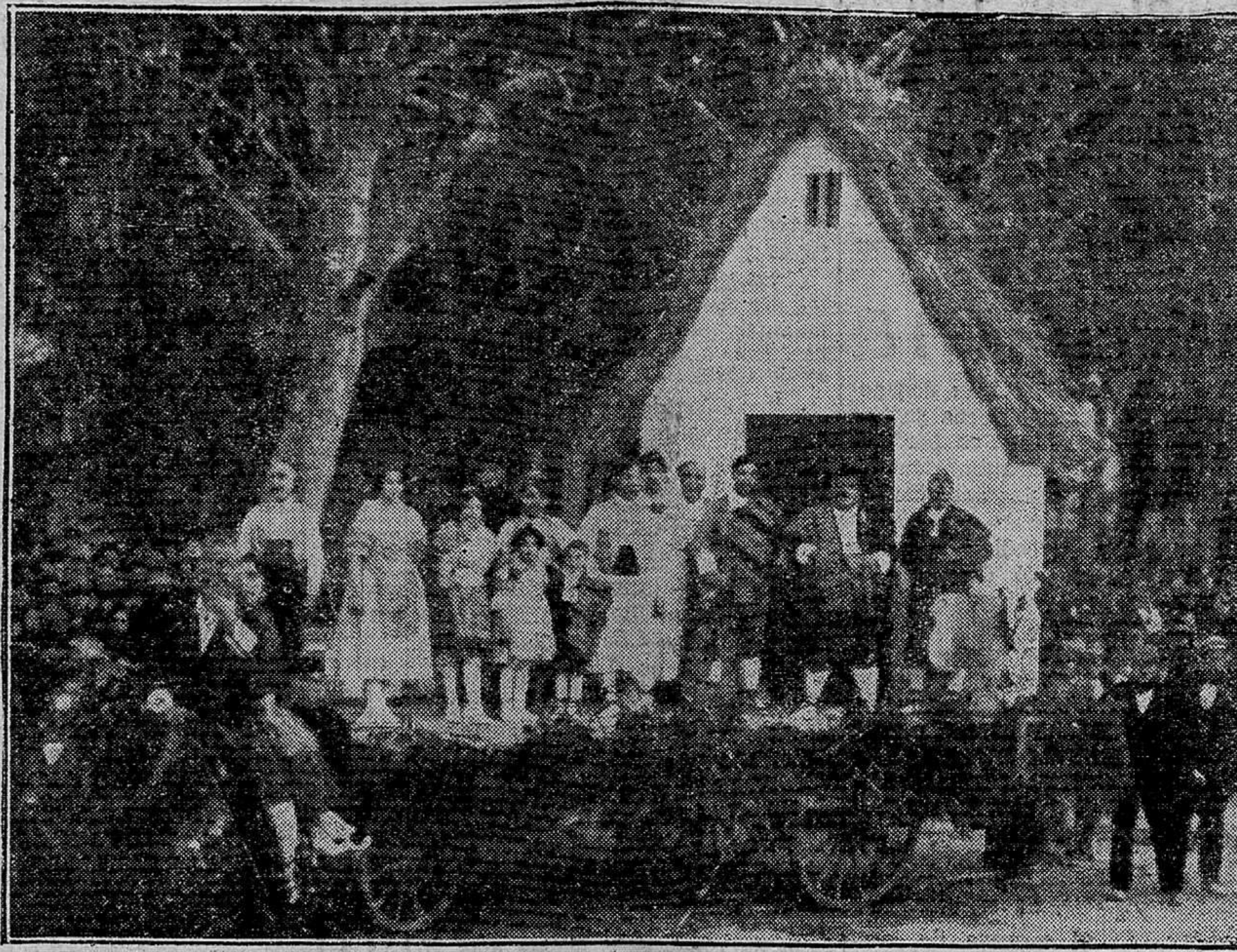
Mascarada organizada por el artista Alfredo Just Jimeno

¿Será tal vez causa de la preponderancia de las excentricidades carnavalescas las inmensas ridiculeces que en el vestir y en las costumbres, con afrenta y daño de todos, vemos durante el año entregarse a muchas personas, de indiscutible discreción en lo demás, el no acordarse de la significación de la reniza que el cuarto de Carnaval y primero de Cuaresma se impone a los fieles en la iglesia?