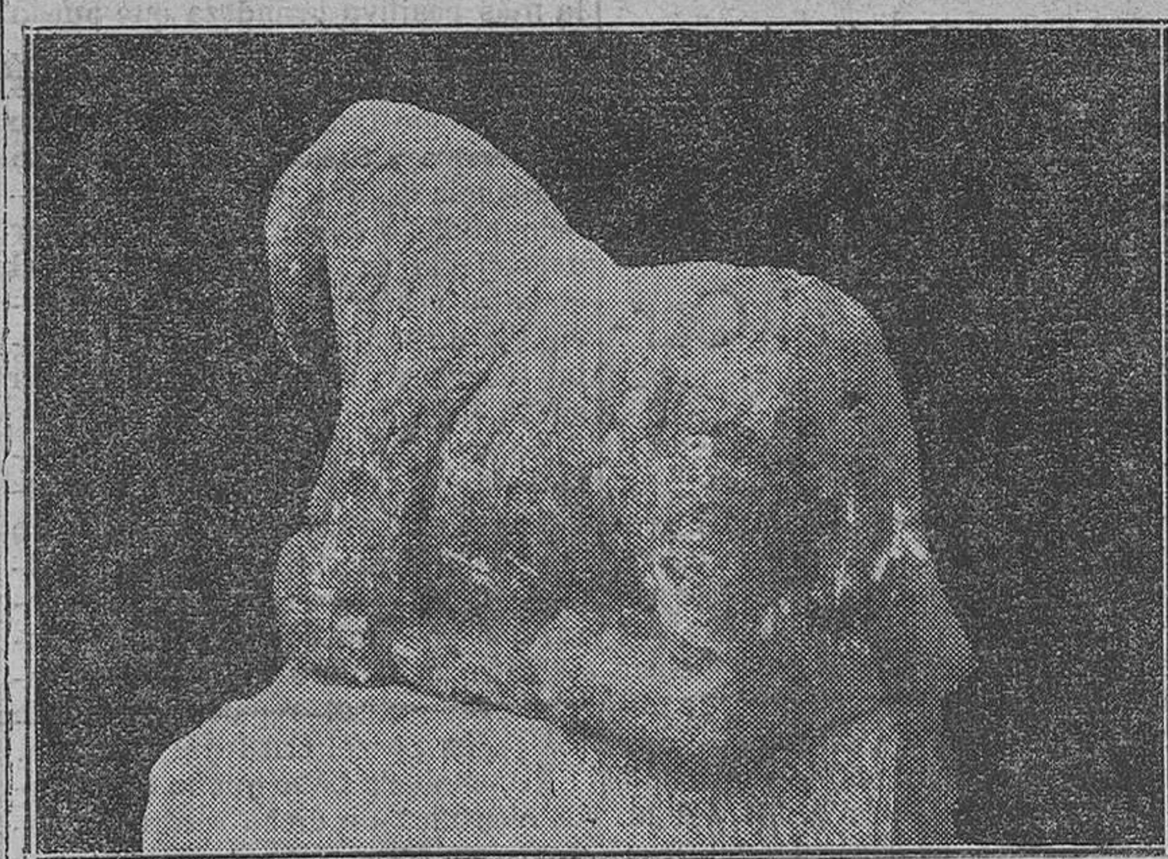
Otra vista fotográfica del toro ibérico

so beneficio de presentarnos catalogados, limpios y en condiciones de fácil estudio, los inmensos tesoros encerrados en la famosa cuspide de la irregular montaña, sobre cuya concavidad Norte se yerguen los mellados y oscuros rastros del inestimable Teatro Romano (no lejos de donde pueden admirarse los restos de los muros ciclópeos), y a cuyos pies se tiende, apoyada en la vertebral, la actual ciudad, mezcla del caserío moderno y de la antigua ur-