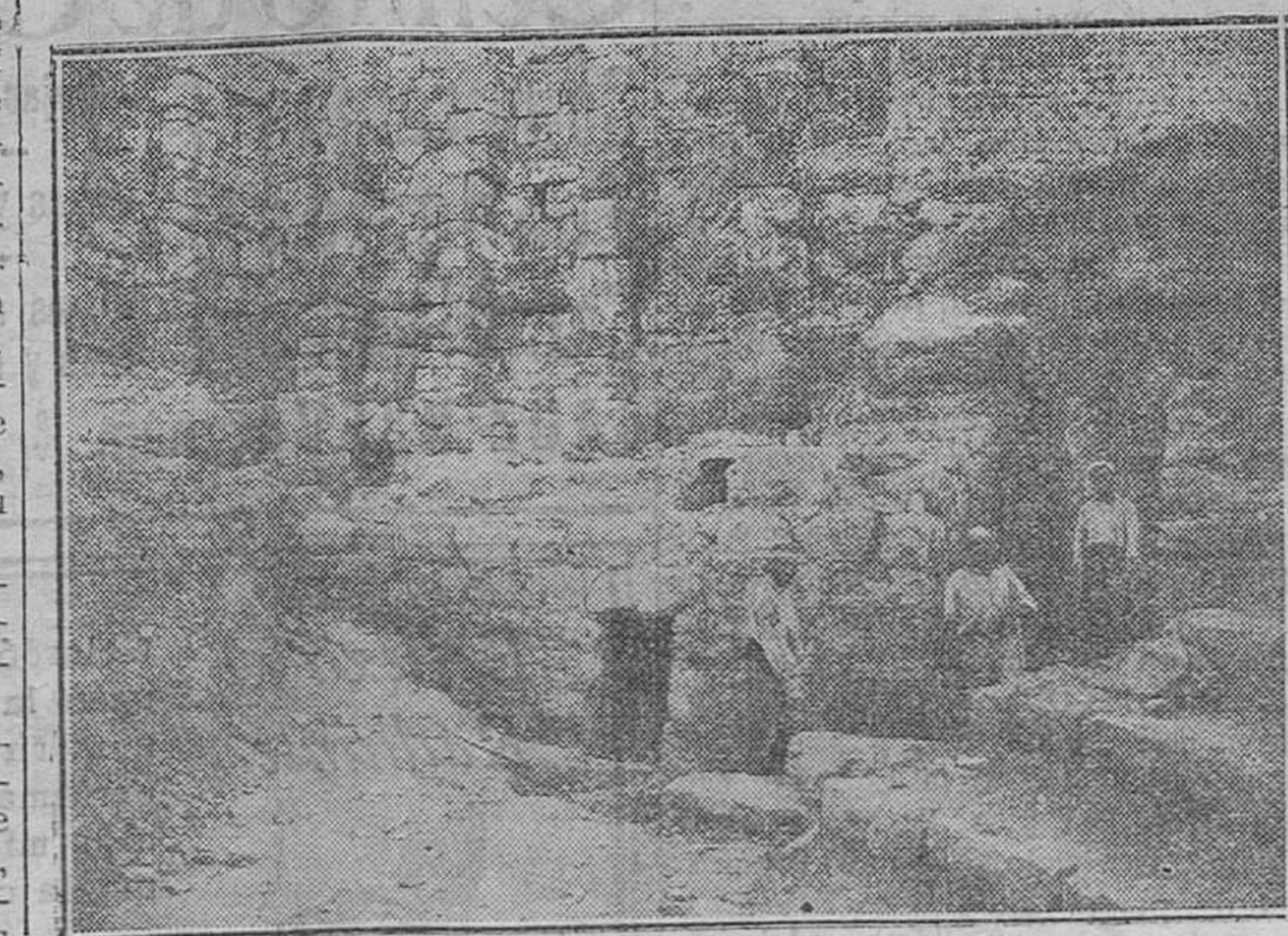
Los muros prerrománicos que se supone fueron los asaltados por Anibal