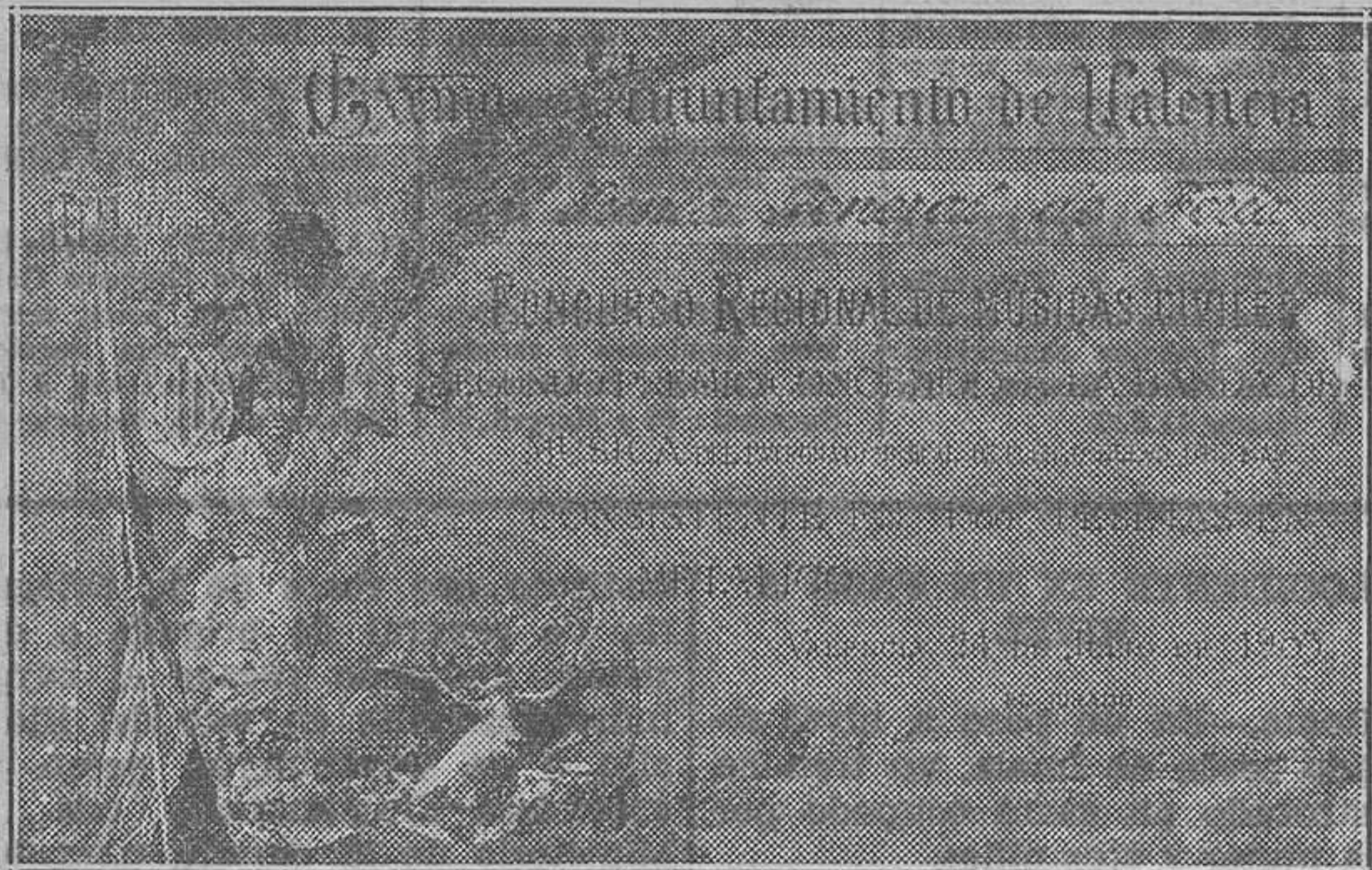
Diploma del premio conseguido por la banda el año 1903 y que justifica una de las etapas más triunfales del gran maestro don José Borrero

—Satisfechísimo como nadie puede figurarse. La banda del Patronato ha sido la madre, digámoslo así, de un sin fin de músicos notables. Ha sido un plantel de verdaderos artistas del pentagrama que se desparramaron por