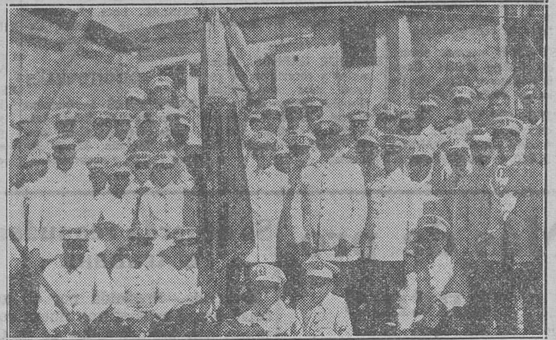
La banda del Patronato en 1926. Fecha memorable en que resurgió potente, después de pasar por la amargura de verse falta de gran número de sus anteriores componentes