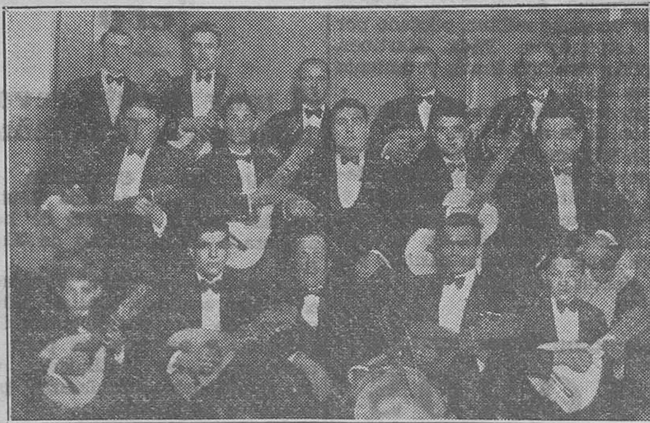
La notable Rondalla del Patronato Musical, que con tanto éxito actúa en todos los Certámenes

Y al decir esto, nos muestra buen número de diplomas colocados en sus marcos profusamente por los salones, que son el dato más elocuente de la incesante y provechosa labor que realizaron tan modestos músicos,