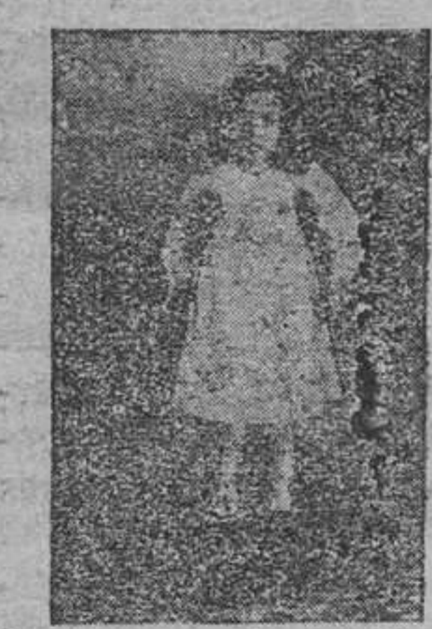
Tumor blanco de la espalda derecha, de hace cinco años, con gran atrofia del miembro, dolor, mal estado general y sin poder andar sin muletas.