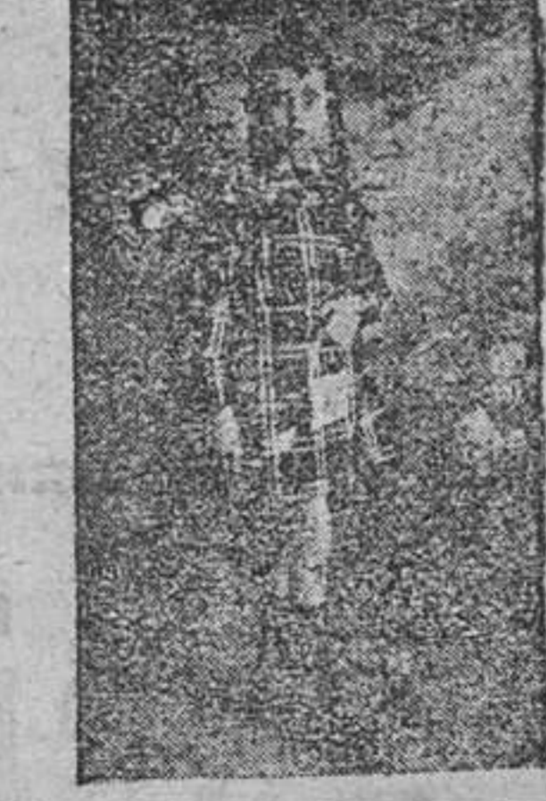
La misma a los 18 meses de tratamiento; notablemente disminuida la atrofia, sin dolor y pudiendo andar sin muletas, con extraordinaria mejoría. Después de general