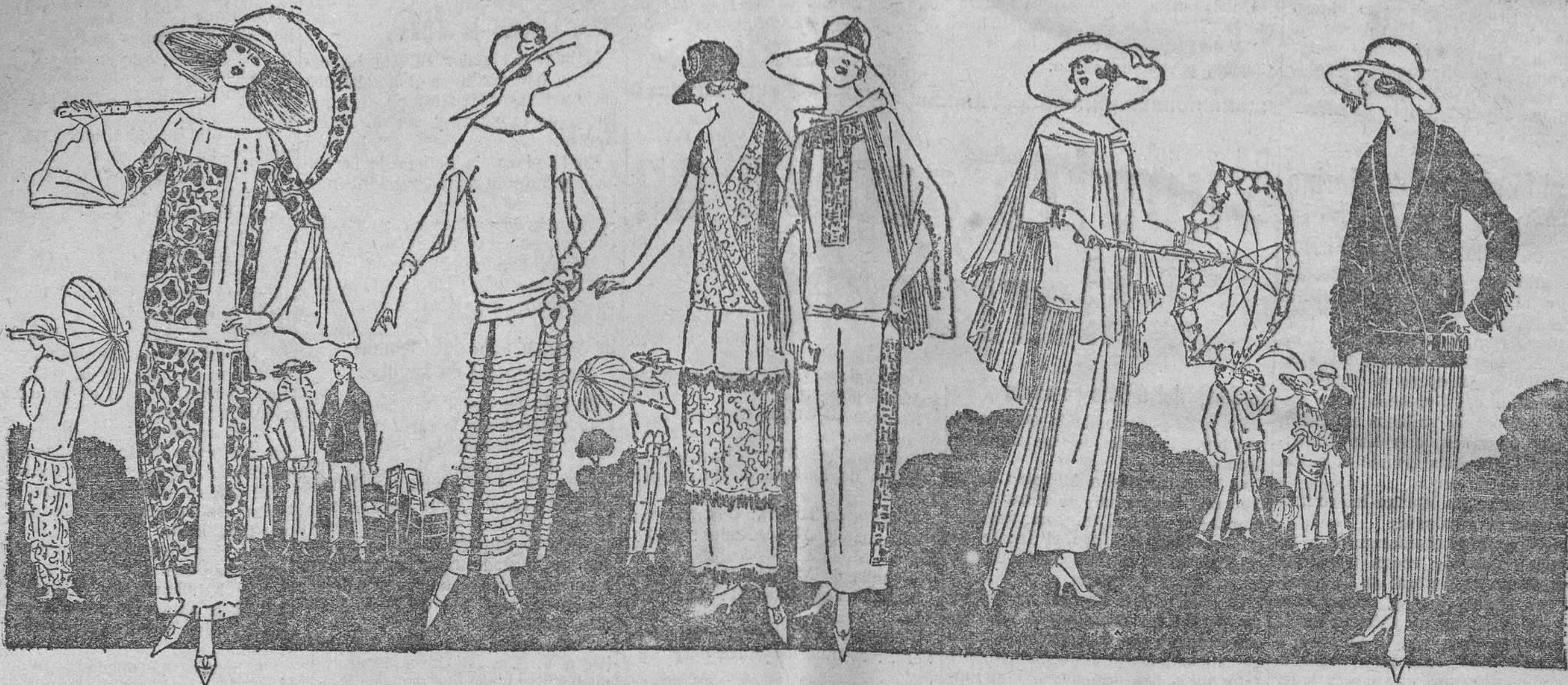
LOS ULTIMOS MODELOS EN LA PLAYA DE TROUVILLE

creyó morir. Ni fortuna, ni honores; el dolor de su corazón fué tan intenso, que una noche tuvo la tentación de huir. —¡Soy un hombre inútil!, ¿qué puedo ofrecerle yo?, soñé con hacerla soberana, y hoy, las zafias la desdennan.