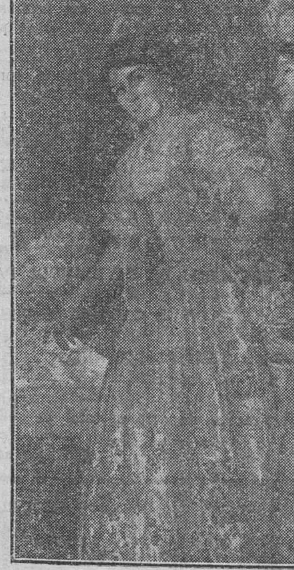
«Floreal», cuadro que se conserva en el Museo de Arte Moderno, de Madrid, premiado con primera Medalla

El rincóncito humilde donde reposa este viajero difundidor de la luz levantina, es un reflejo de sus inclinaciones. Adora la ingenuidad infantil, tan difícil de expresar en el lienzo, y por eso las paredes están cubiertas de bocetos, de estudios, de cuadros, en los que rostros angelicales carpean, reflejándose en ellos sonrisas y gestos de un encanto especial. Y alternando con esos lienzos se ven otros de asuntos valencianos, como valencianos