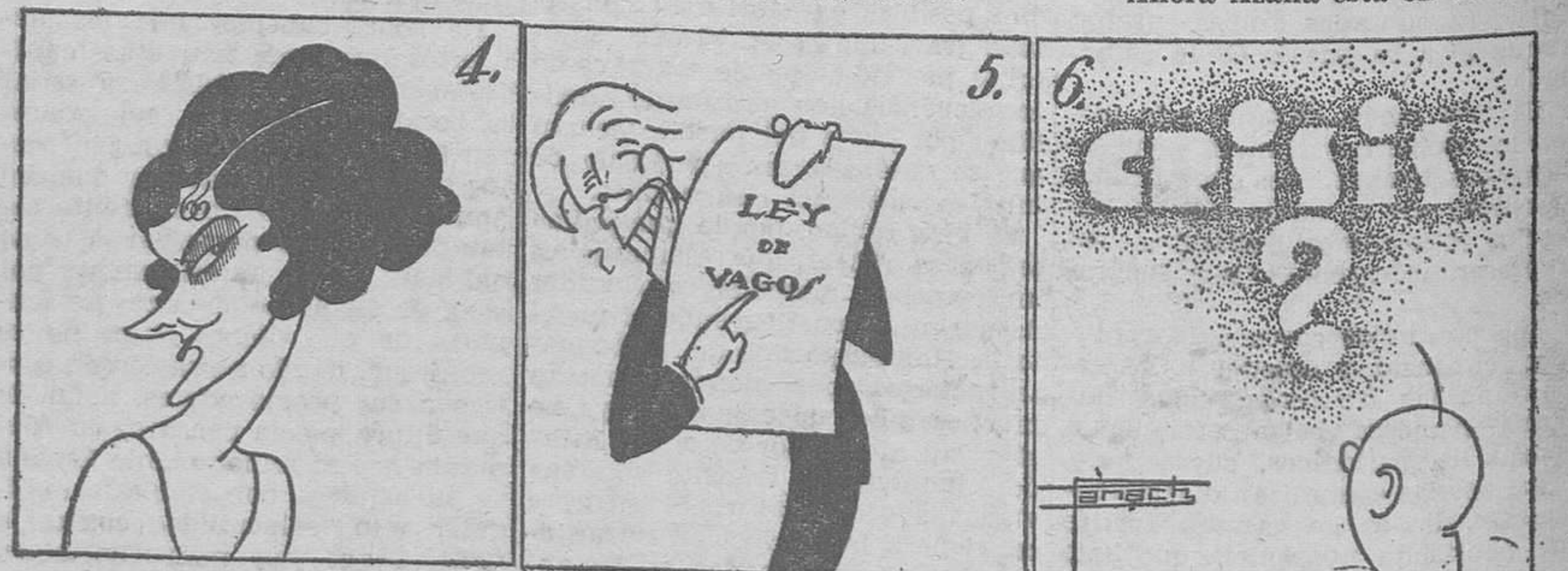
Miss Europa es peregrina. ¡Rusita, rusa divina!