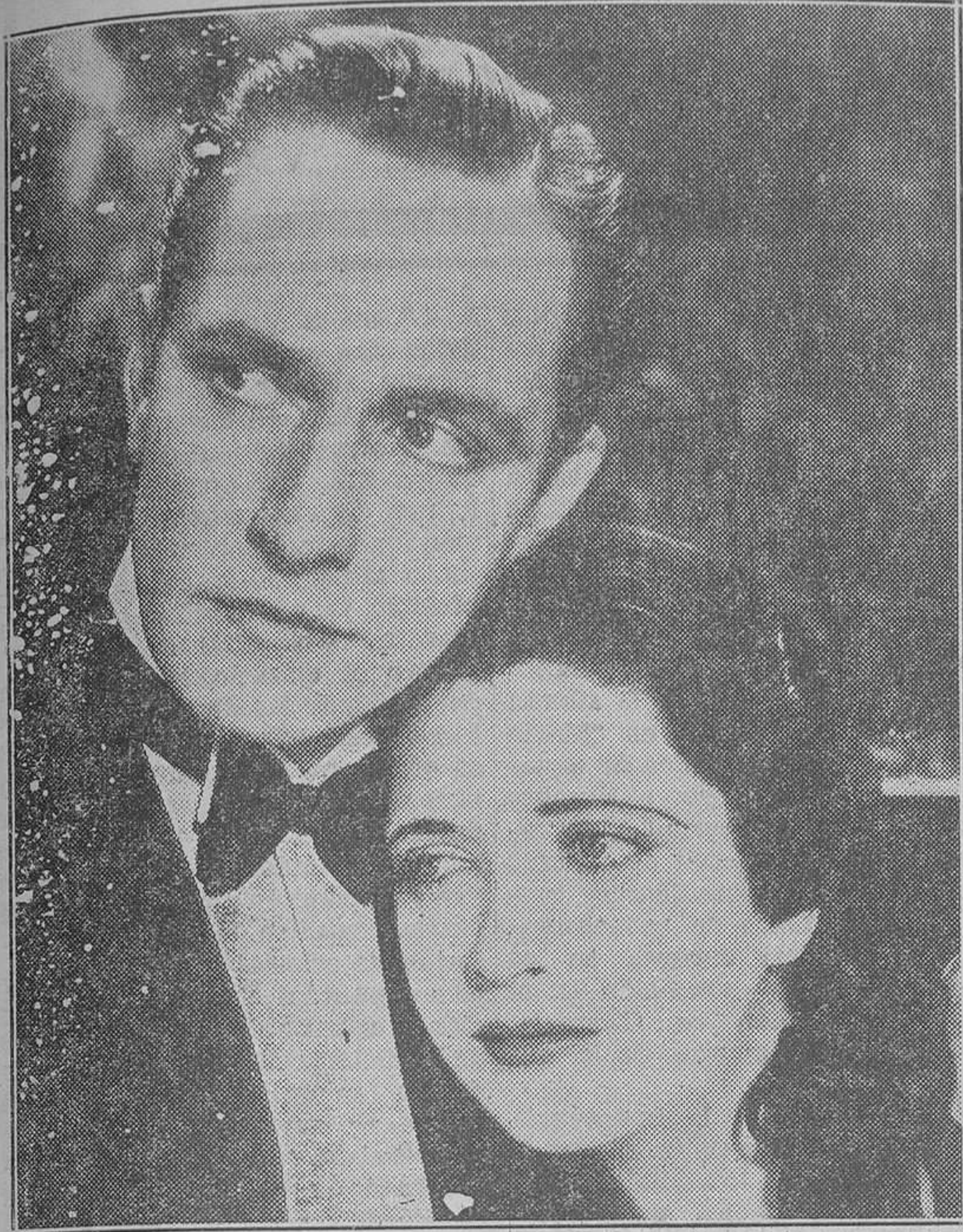
Frederic March y Kay Francis, magníficos artistas de Paramount, pareja cautivadora que triunfa en el interesante film que ayer se estrenó en el hermoso teatro de la calle de Ruzafa