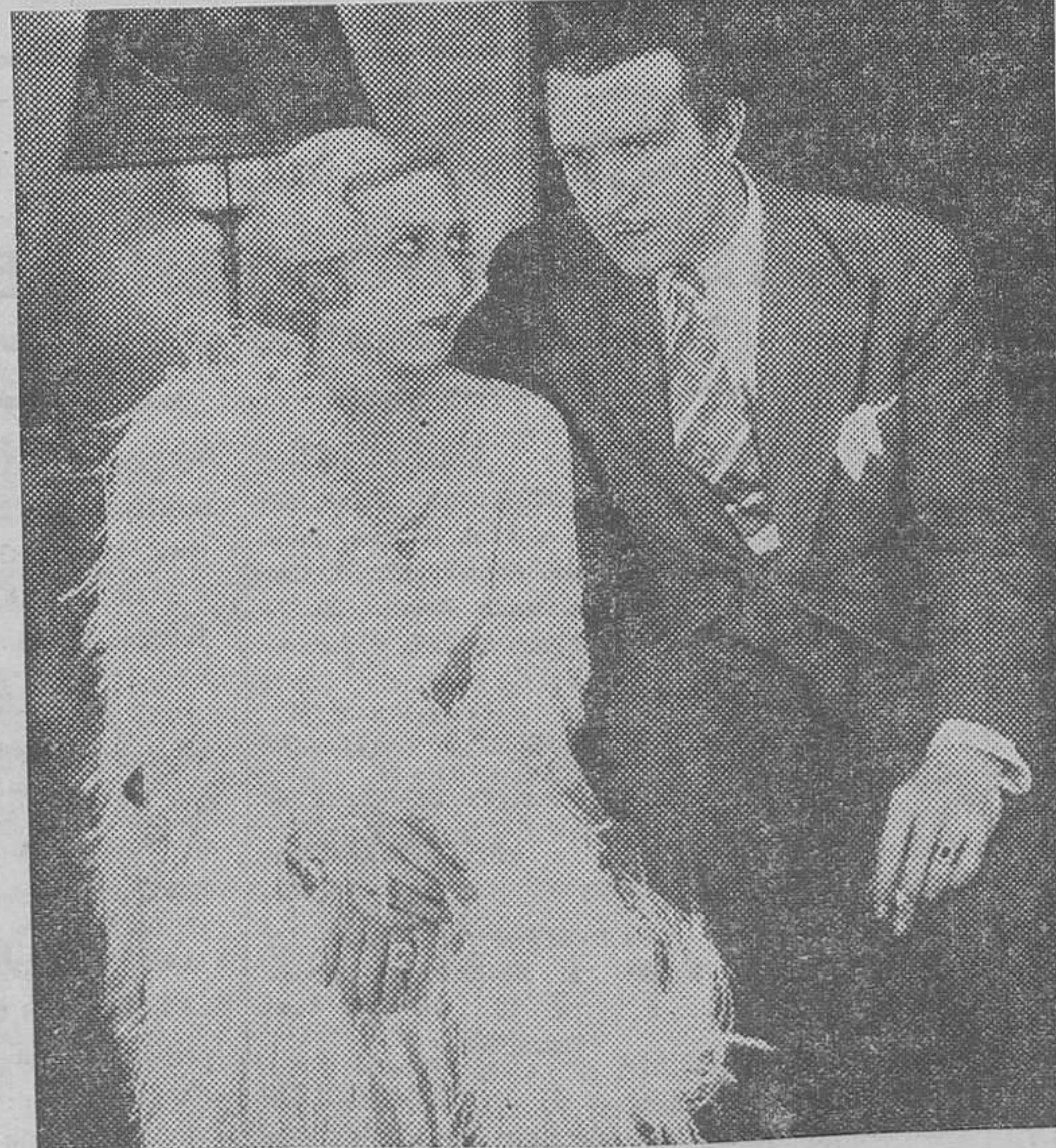
"El hombre que se reía del amor" vuelve a triunfar en Valencia Ayer apareció en el cine Avenida y se reverdecieron laureles, consiguiéndose llenos rebosantes

O llenando el boletín del concurso, que publicamos a continuación, indicando las cuatro mejores películas estrenadas en Valencia desde el primero de Septiembre de 1932 al 15 de Mayo de 1933.