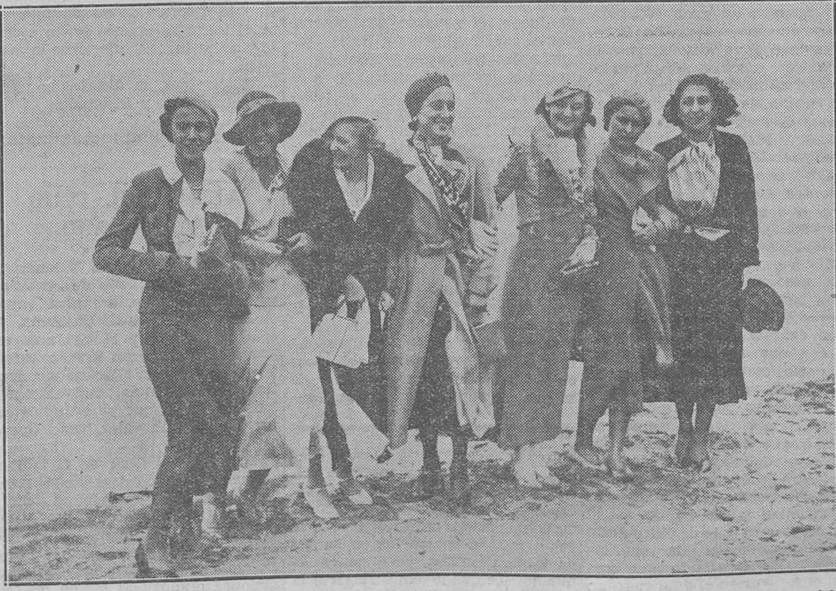
Las bellezas, tras un día de descanso, se dedicaron a recorrer los lugares próximos a Barcelona; así las vemos en la fotografía, alegres y risueñas, dando un paseo por la playa de Sitges. Aparecen, de izquierda a derecha: Miss Hungría, Miss España, Miss Dinamarca, Miss Italia, Miss Rusia, Miss Rumanía y Miss Turquía

De estos ejemplares, el interesado puede hallar algunos en la Administración de LAS PROVINCIAS, calle del Mar.