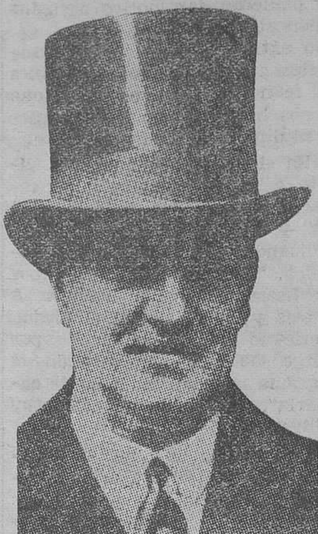
Don Julio Roca, vicepresidente de la República Argentina, que actualmente se halla en Madrid