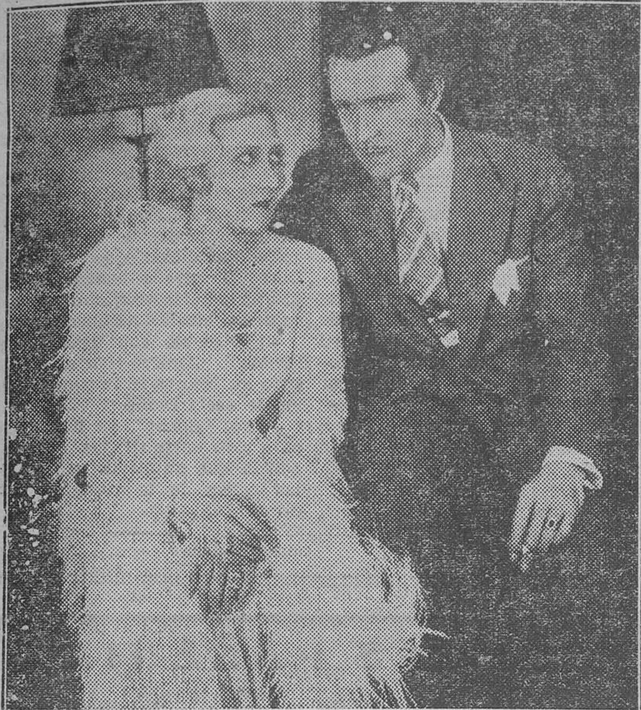
El feliz matrimonio Ladrón de Guevara-Rivelles, animadores e intérpretes ilustres de "El hombre que se reía del amor"

dar, demuestra cumplidamente que en España se pueden hacer buenas películas.