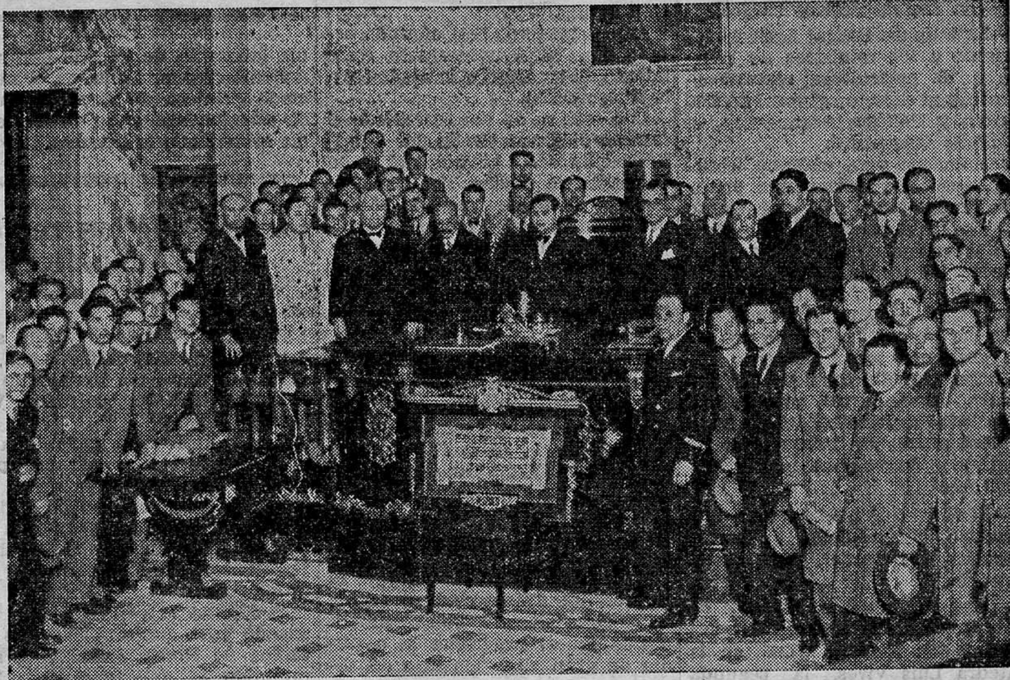
Entrega efectuada ayer del nombramiento de Hijo Predilecto de la ciudad, en el salón de sesiones del Ayuntamiento