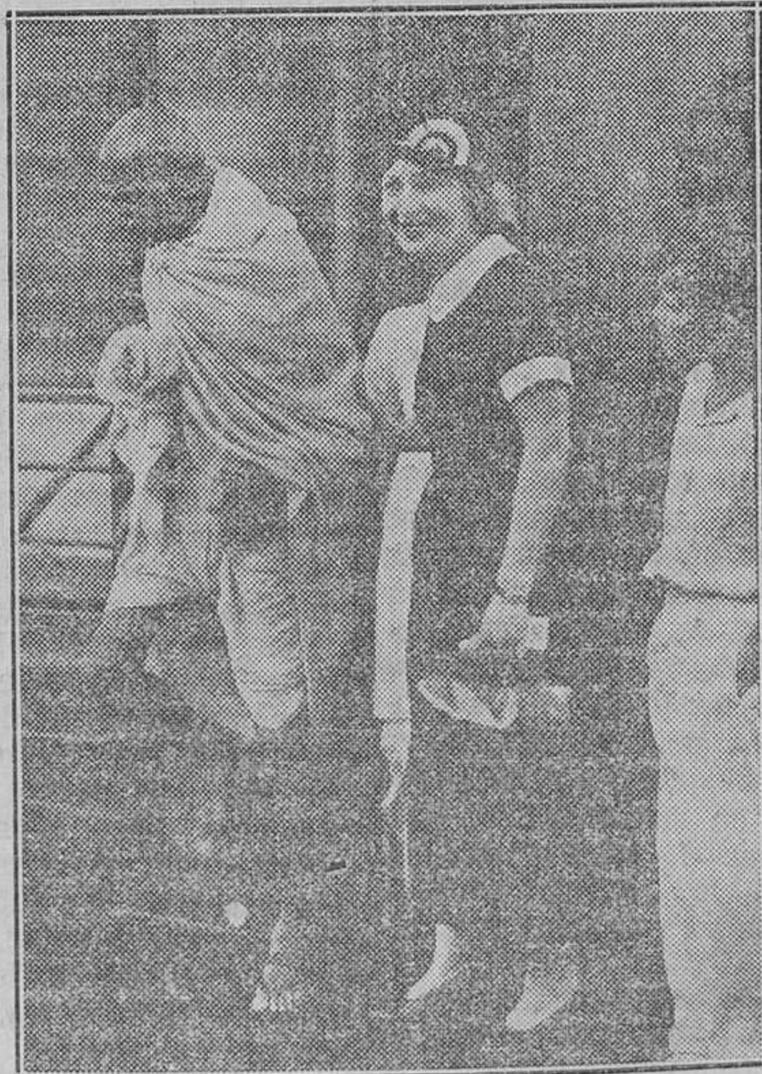
Mahatma Gandhi, con su secretaria, al desembarcar en Marsella