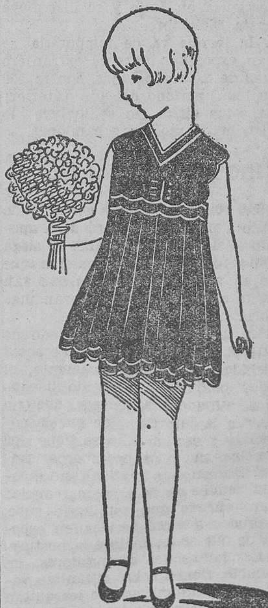
Vestidito de crepé amarillo, festoneado con blanco

Por falta de espacio no podemos ser hoy más extensos y daremos detalles en el número de mañana.