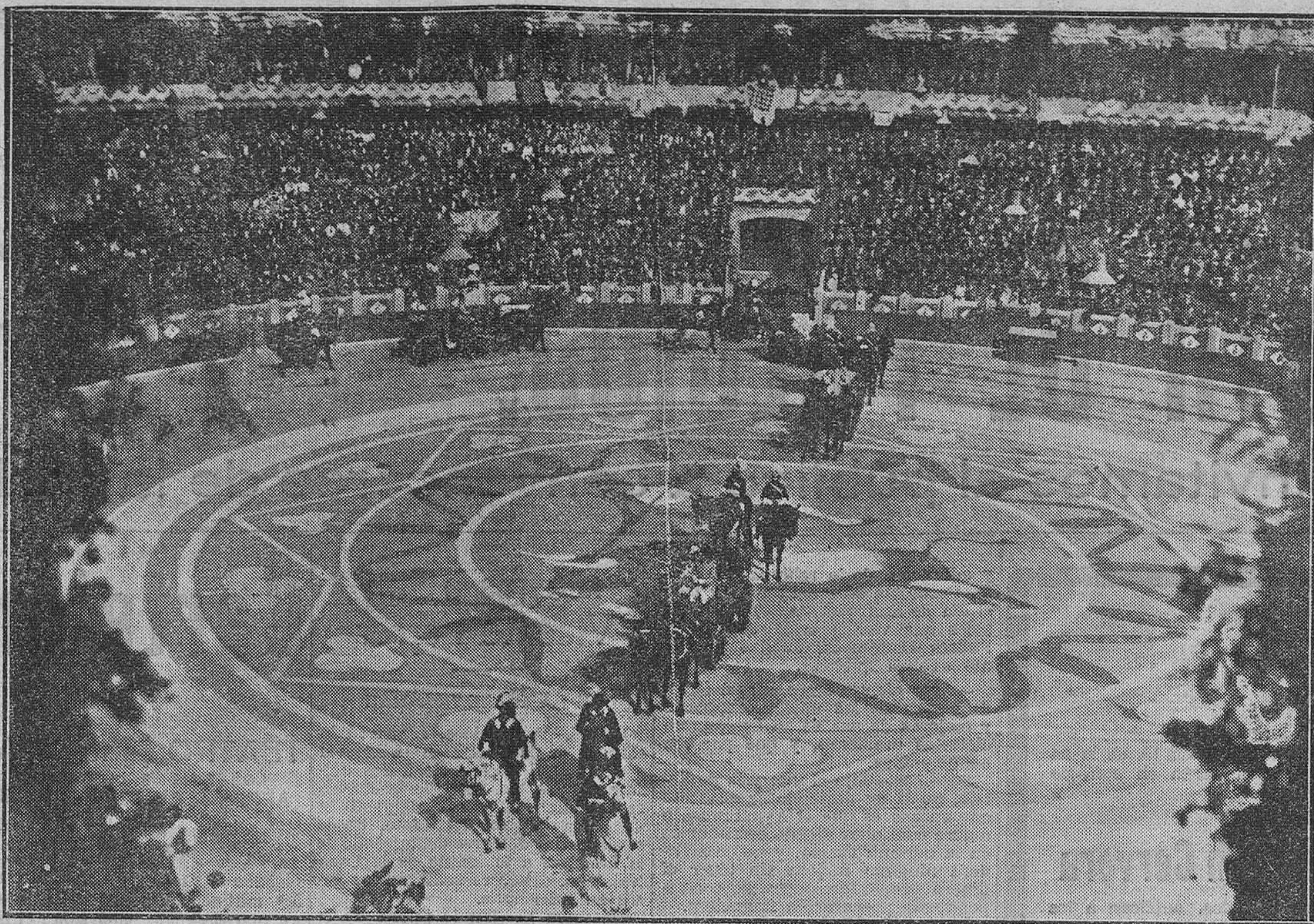
La corrida goyesca, uno de los números del programa con que Zaragoza, cuna de Goya, celebra el primer centenario del nacimiento del inmortal artista