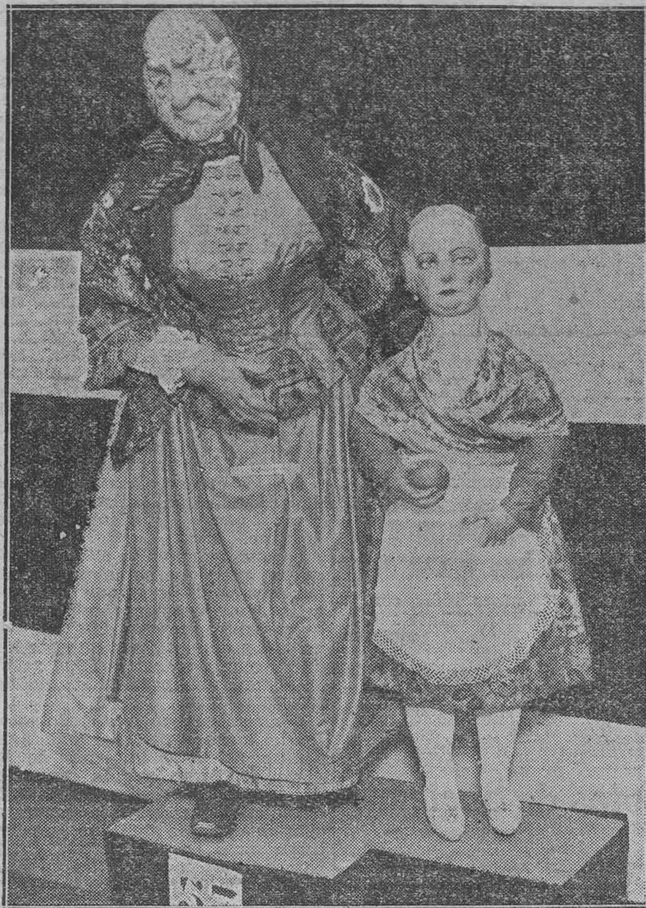
Los dos monigotes que por elección se han librado del fuego de nuestras fallas y que se conservarán en el Museo Folklorico Valenciano

Antes que nada, el presupuesto exige, una vez el Gobierno en la vía libre, extraordinaria, inusitada y aceleradísima velocidad. Y luego la amnistía. El señor Lerroux ha prometido que antes del 14 de Abril estará aprobada la amnistía. Vámonos a verlo. Si así no fuera, esa fecha señalaría el tope a la vida de este Gobierno y a su marcha por la vía libre que las derechas y sus grandes órganos en la prensa han abierto por entre la manigua de rebeldías, insolencias y matonismos de los socialistas. Mal pagaría el señor Lerroux a las derechas si las burlase de nuevo en su demanda de amnistía. Porque sepase una vez más: ha sido la prensa de las derechas, singularmente "A B C" y "El Debate", la que ha disipado con su actitud recta y digna—en estos tiempos, ello sólo va-