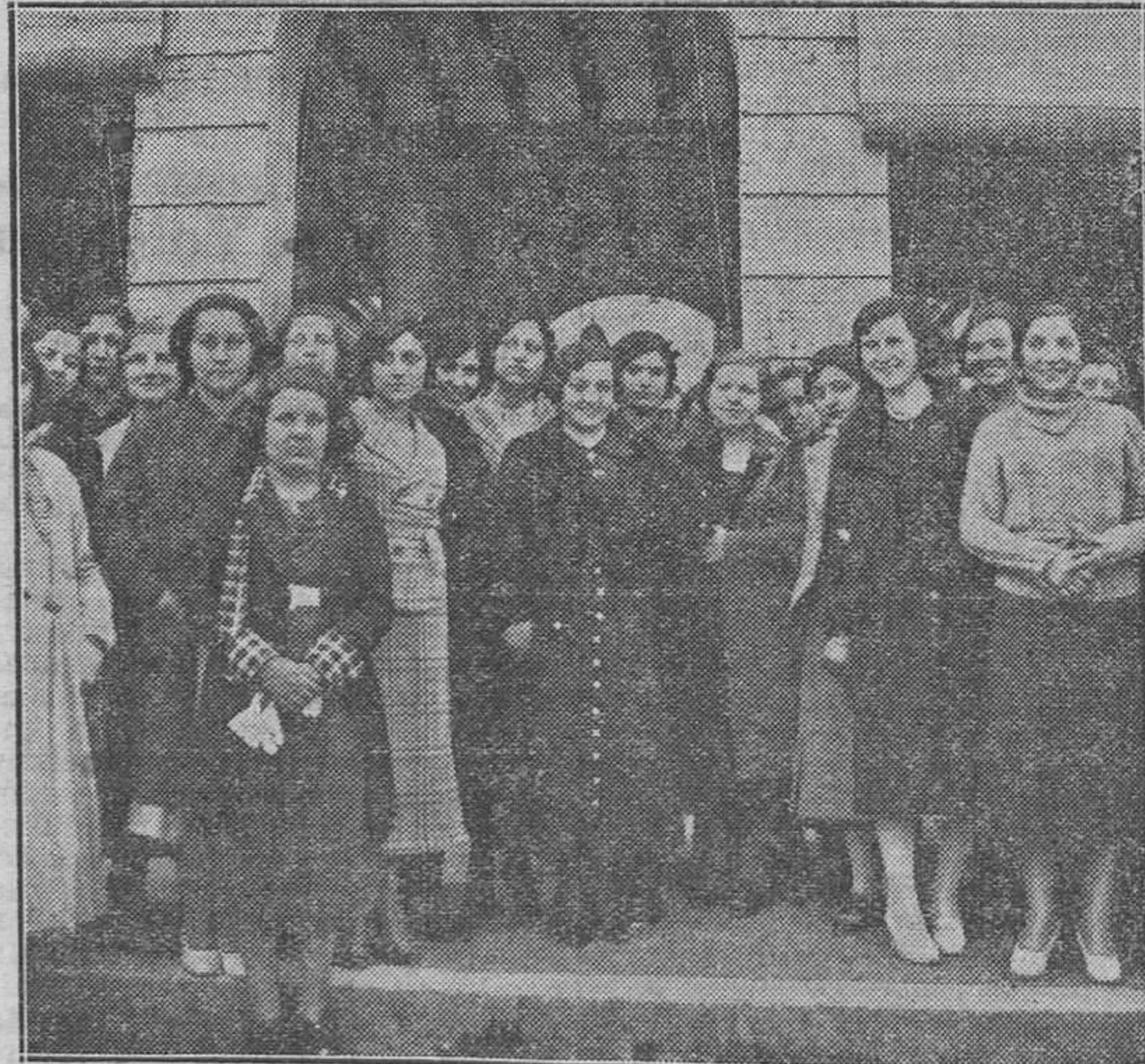
Señoritas que forman la Masa Coral de normalistas valencianas, que dieron una audición en Játiva.