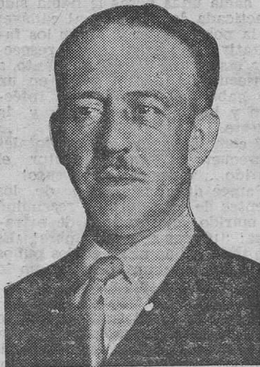
El teniente coronel don Esteban Infantes, libertado recientemente, después de año y medio de condena