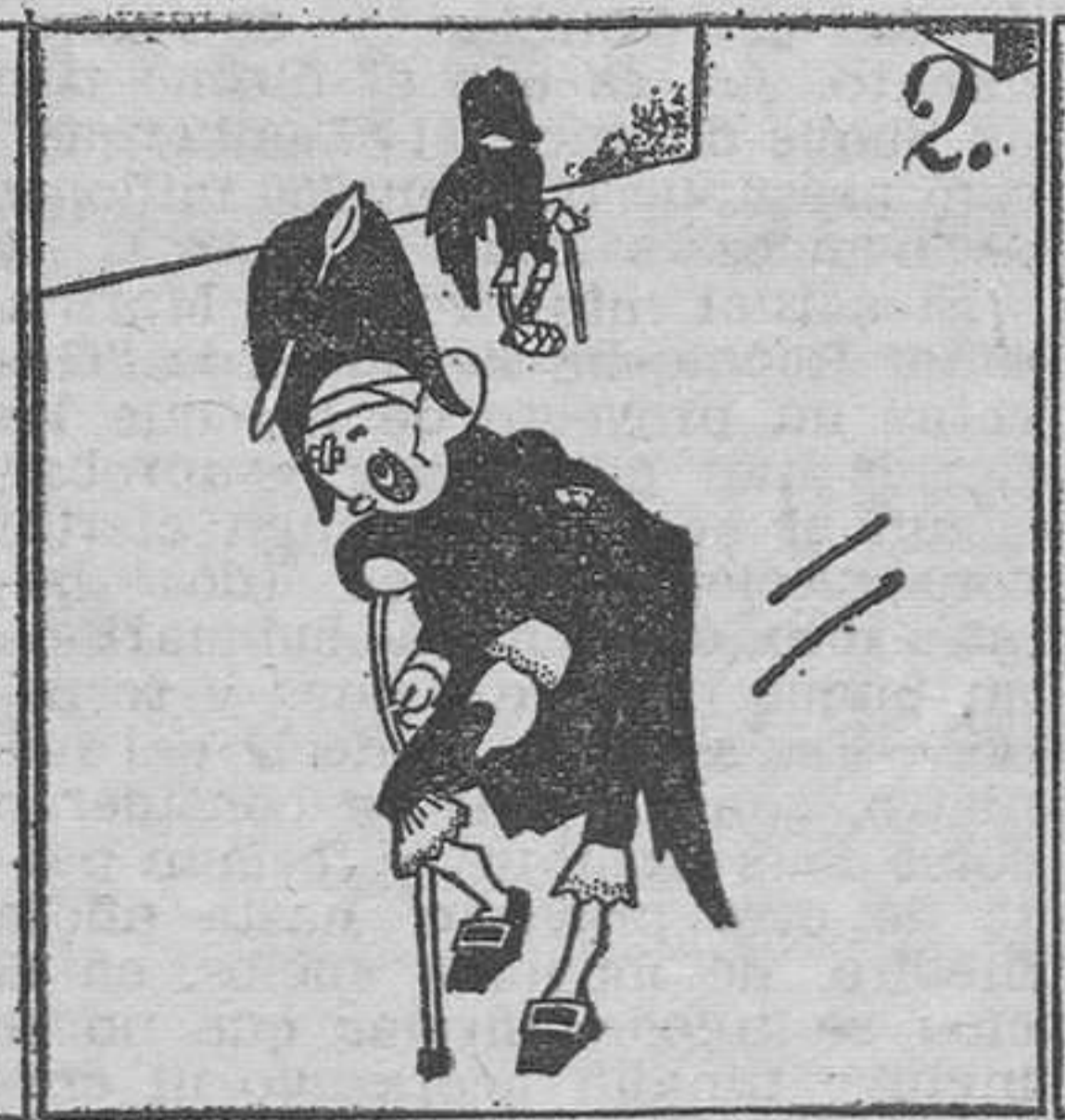
Así saldrá (se adivina) la clásica estudiantina.