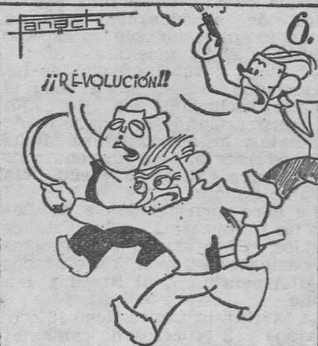
Y también está anunciada esta feroz mascarada. (Texto y monos de Panach.)