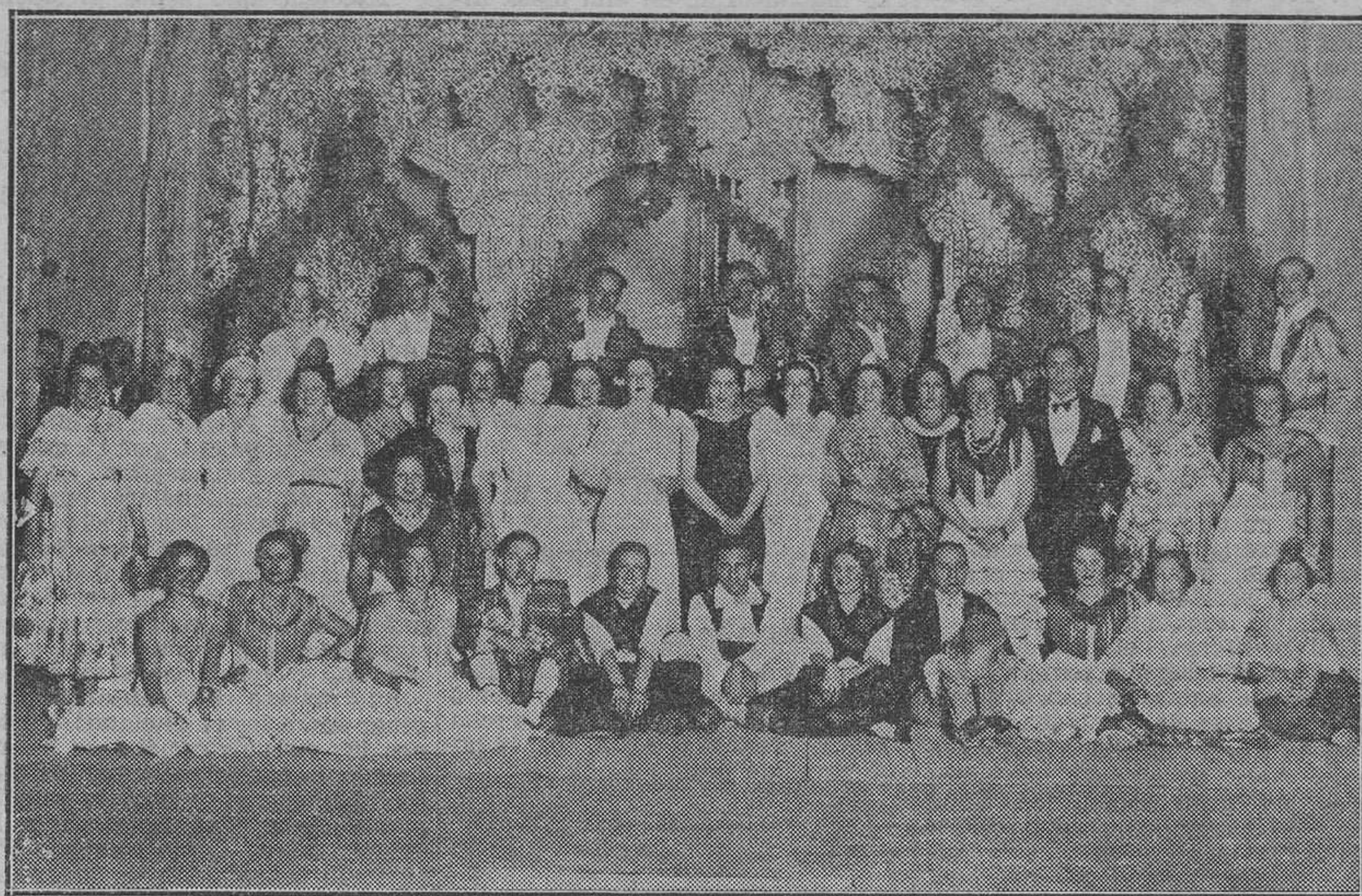
Grupo de distinguidos jóvenes de ambos sexos, que tomaron parte en la función benéfica organizada por las Invidias y que se celebró el pasado jueves en el teatro Principal.

Fué menester que la opinión pú- blica se manifestase de un modo tan violento como en la noche del 6 de este mes, para que los radica- les comprendieran todo el mal que significaba para ellos y para el país su colaboración estrecha con los socialistas. En el fondo, estarán contentos de que las circunstan- cias les hayan obligado a ello; no hubieran tenido por sí mismos la energía suficiente para romper con los socialistas, pero una vez que la opinión les obliga a ello, mejor. Al fin y al cabo, los radicales son bur- gueses y sólo la anticuada ideolo- gía política y anticlerical les une a los socialistas. Claro está que no podían capitular ante Tardieu, el vencido por ellos hace menos de dos años, pero Gastón Doumergue es otra cosa: es un antiguo político radical ex jefe de la minoría ra- dical en el Senado. Con Doumer- gue ya se puede entenderse, aun- que sea para la reforma de la Constitución, en el sentido de re- forzar el Poder ejecutivo. Y si Doumergue encabeza la lista de los ministros, ya se puede, sin excesi- va suspicacia, colaborar en el mis-