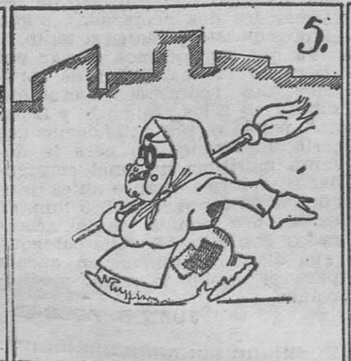
Se anuncia (¡Santa Madona!) que saldrá esta destrozona.