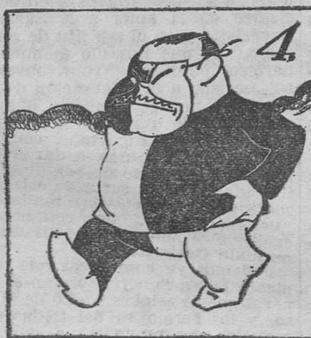
"Blanco y Negro". Mascarón que despierta expectación.