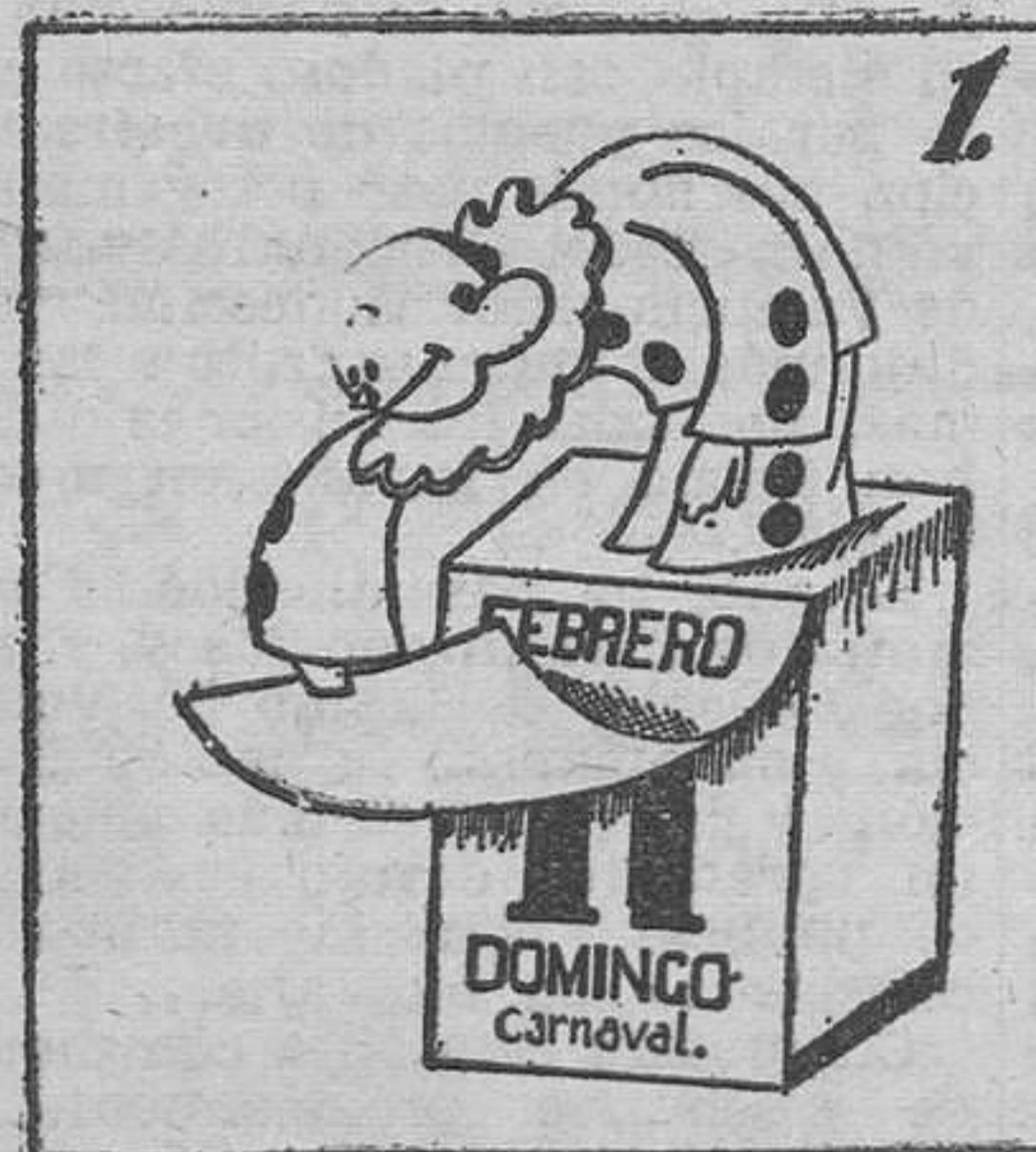
Ved, en el año actual, cómo será el Carnaval.