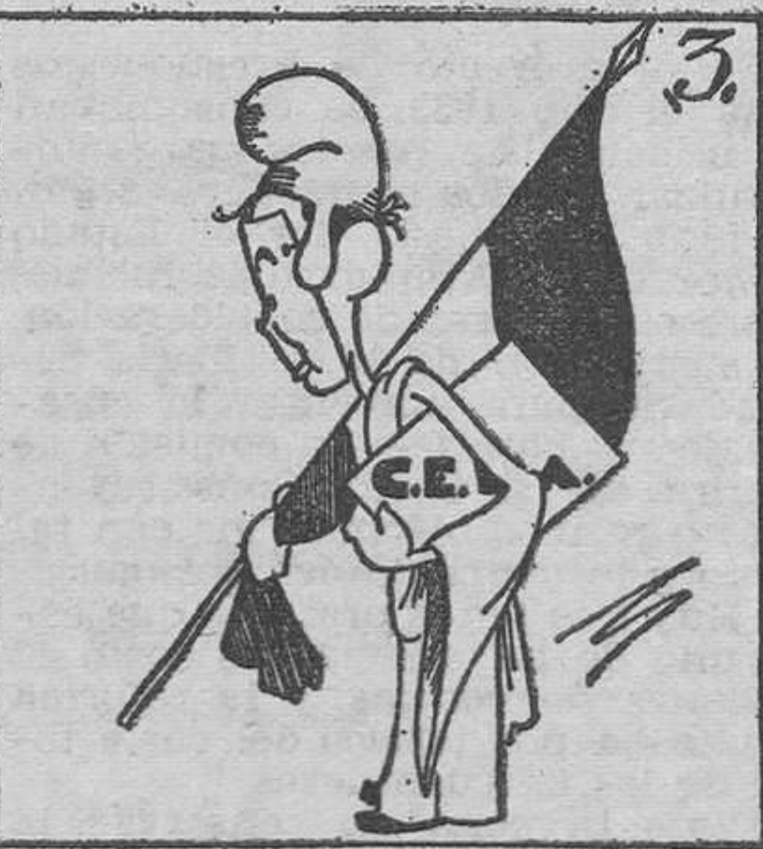
El premio primero vé, de las máscaras a pie.