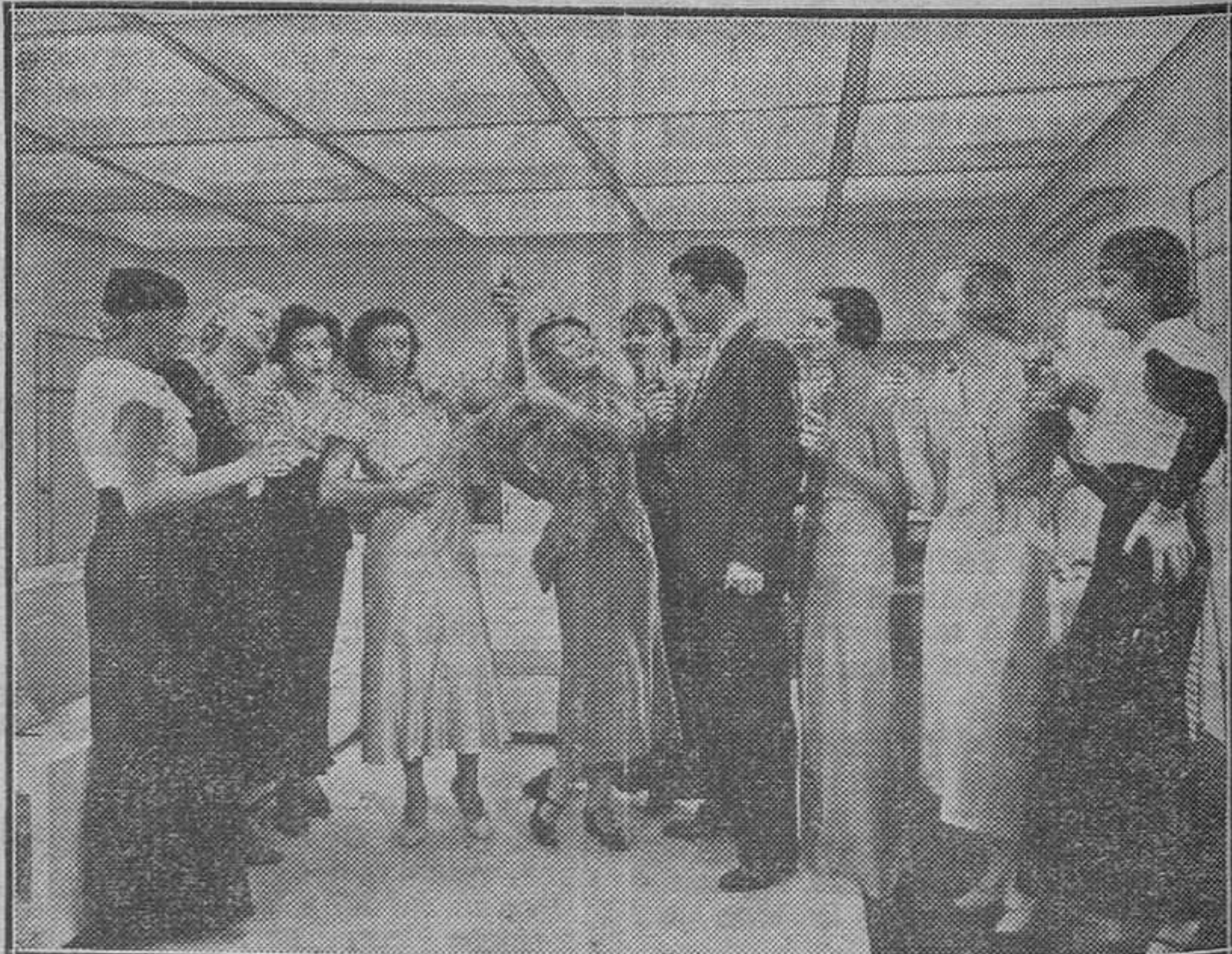
El lunes próximo va a estrenarse en el aristocrático Cinema Suizo esta bellísima producción Fox, que es una deliciosa comedia musical realizada en un ambiente de lujo y riqueza. Además de darnos una perfecta interpretación por parte de Lilian Harvey y Lew Ayres, tiene la particularidad de ser algo muy distinto de lo que Lilian había realizado hasta ahora. Nos hallamos ante una comedia musical a la americana, que equivale a decir ligereza, simpatía, vivacidad y alegría. Una corte lucidísimas de bellas artistas—véase la muestra—se amparan en este film que viene precedido de gran fama