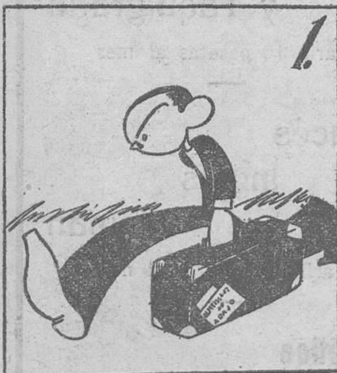
Se impone, por lo que veo, regresar del veraneo.