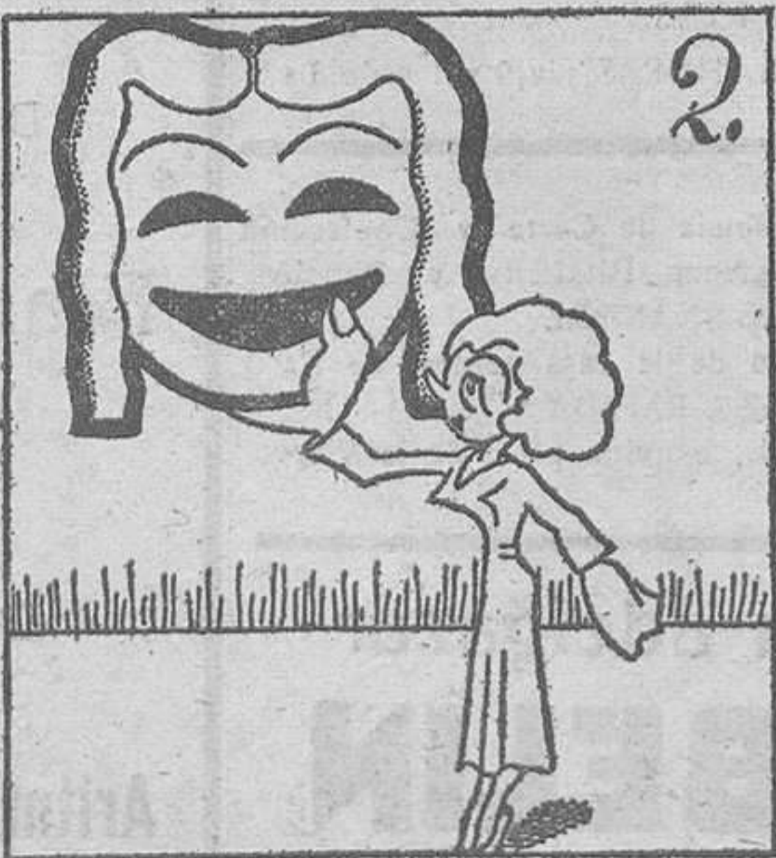
Pues ha llegado ya el día de reaparecer Talía.