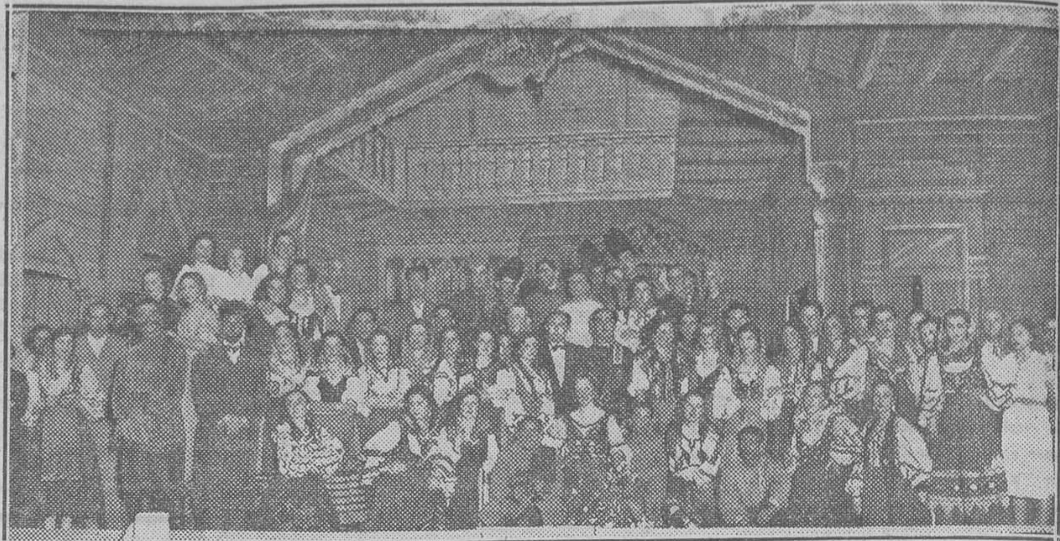
Distinguidas señoritas y jóvenes de la Colonia veraniega de Paterna que representaron con un grandioso éxito "Katuska" en el Gran Teatro, a beneficio de los pobres.

¡Sólo queda Raquel Meller, con todo su prestigio, con toda su fama, con toda su prestancia incólumes! Como hace diez años, como hace quince, como hace veinte años: sonriente, pimpante, con su andar breve a pasitos cortos, con