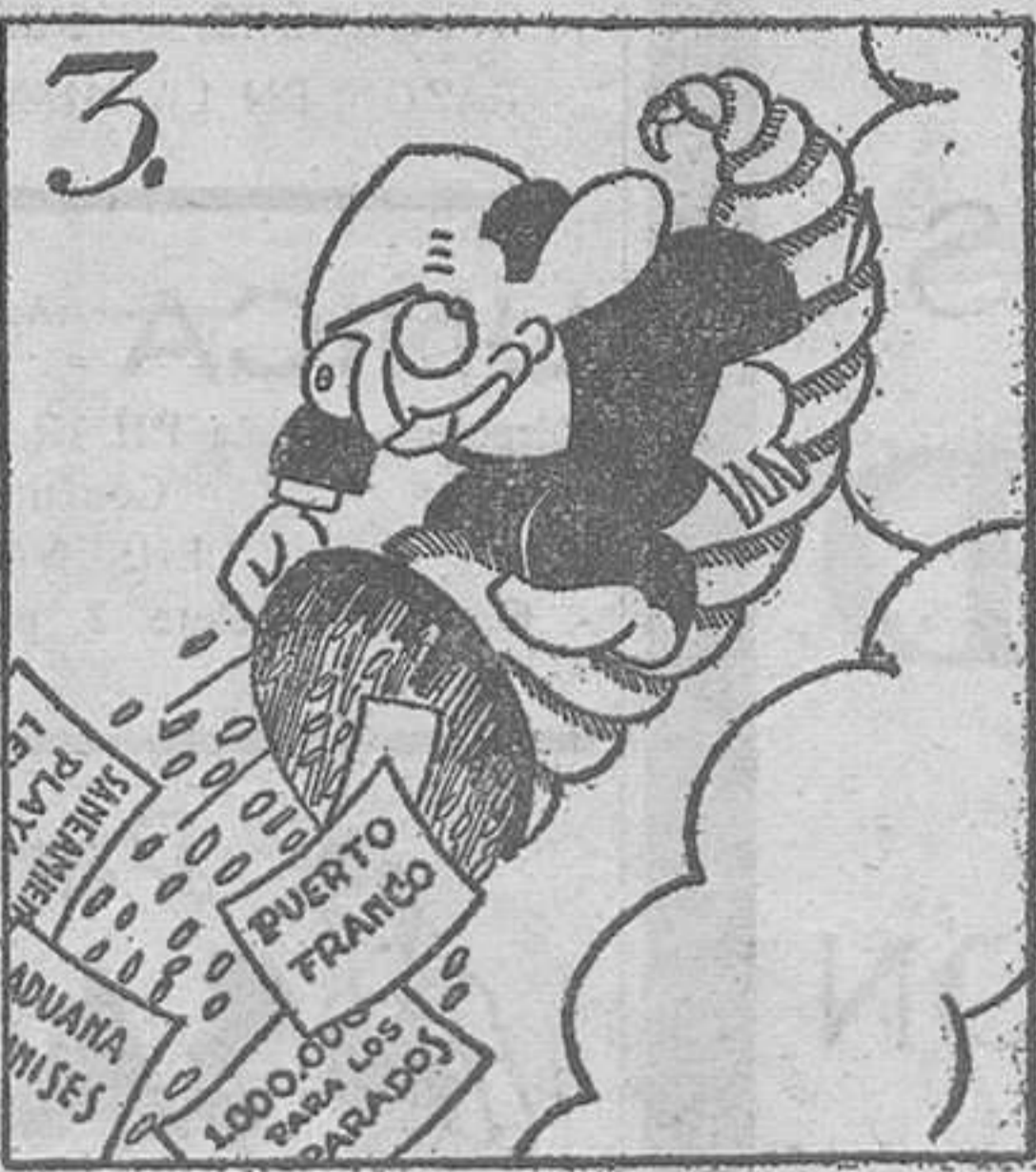
Samper se acredita, ufano, de ser un buen valenciano.