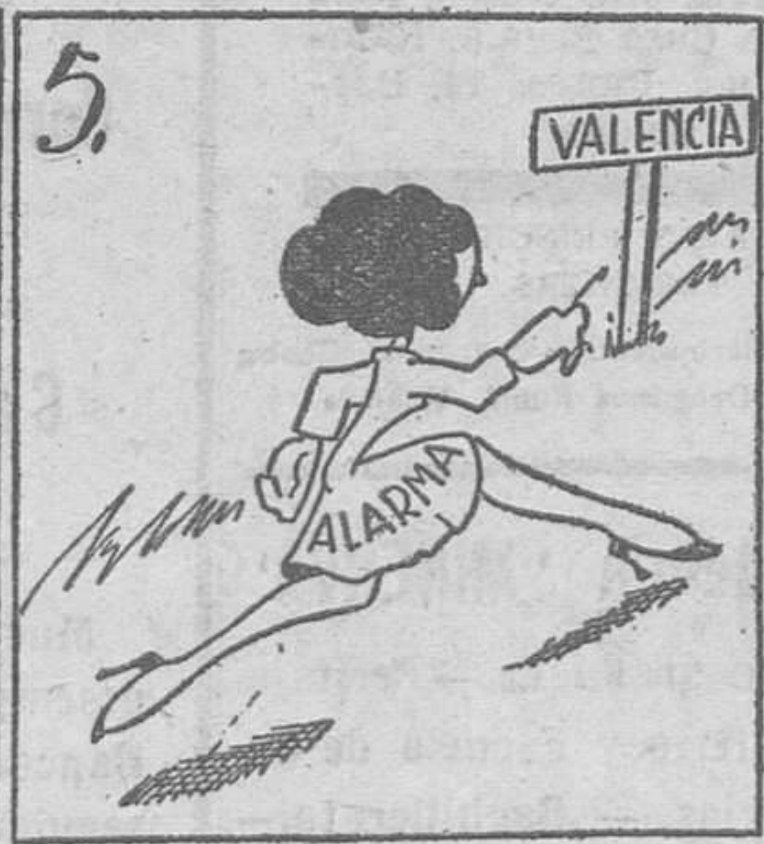
En nuestra ciudad ha entrado este lamentable estado.