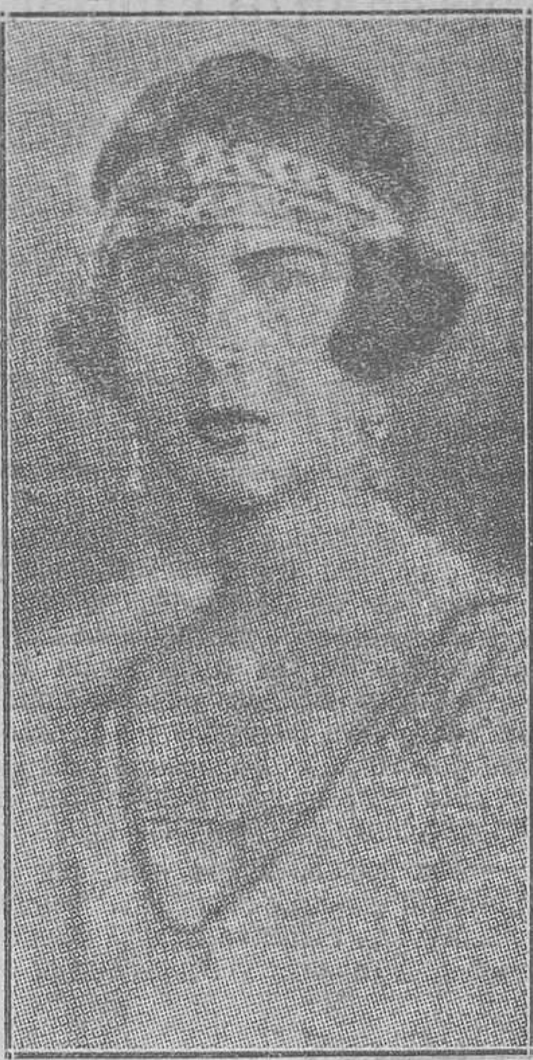
La Princesa María José, esposa del heredero de la corona de Italia

La S. de N. continúa siendo el centro de las maniobras de las grandes potencias que son las que