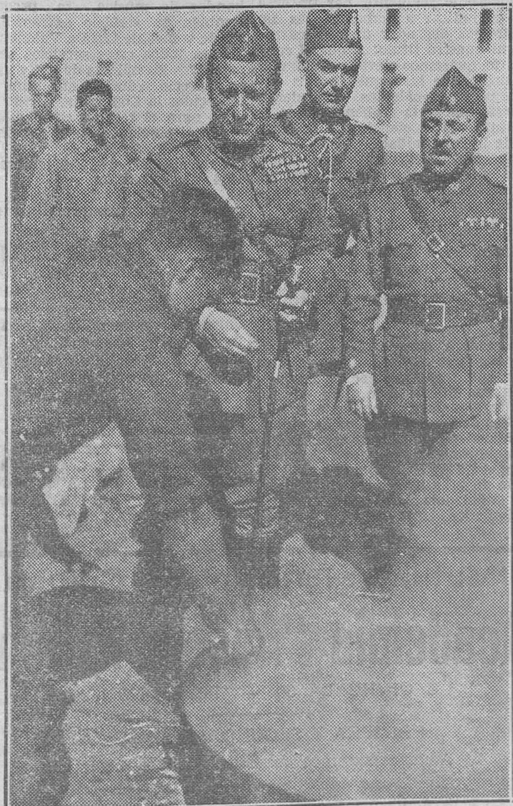
El general López Ochoa, director de las maniobras, visitando el campamento y confección del rancho.