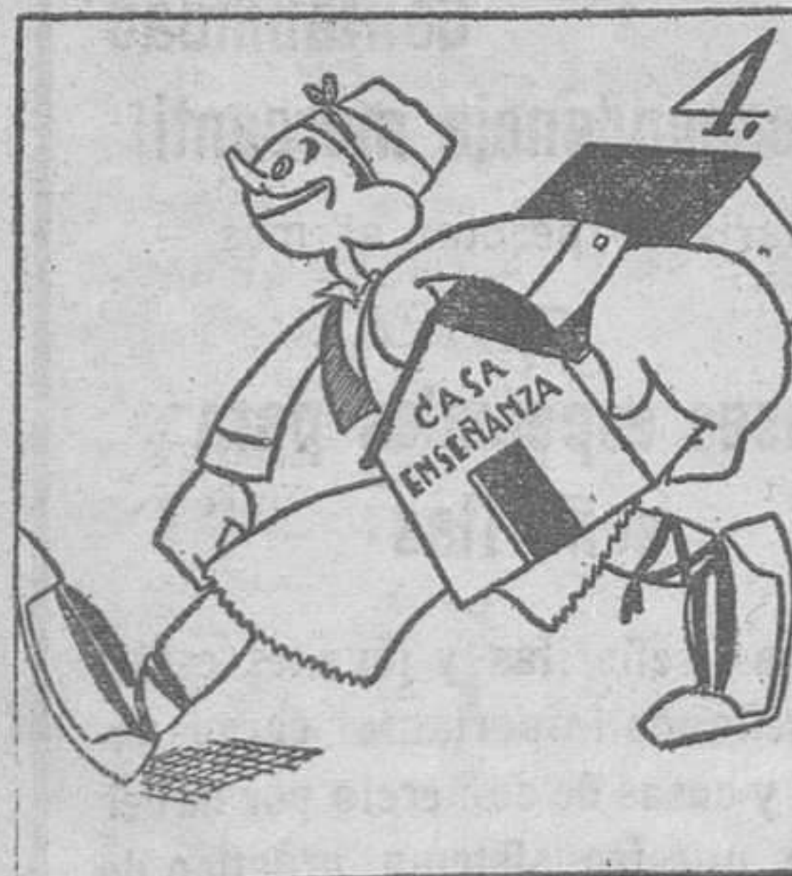
El Ayuntamiento alcanza, tener la Casa-Enseñanza.