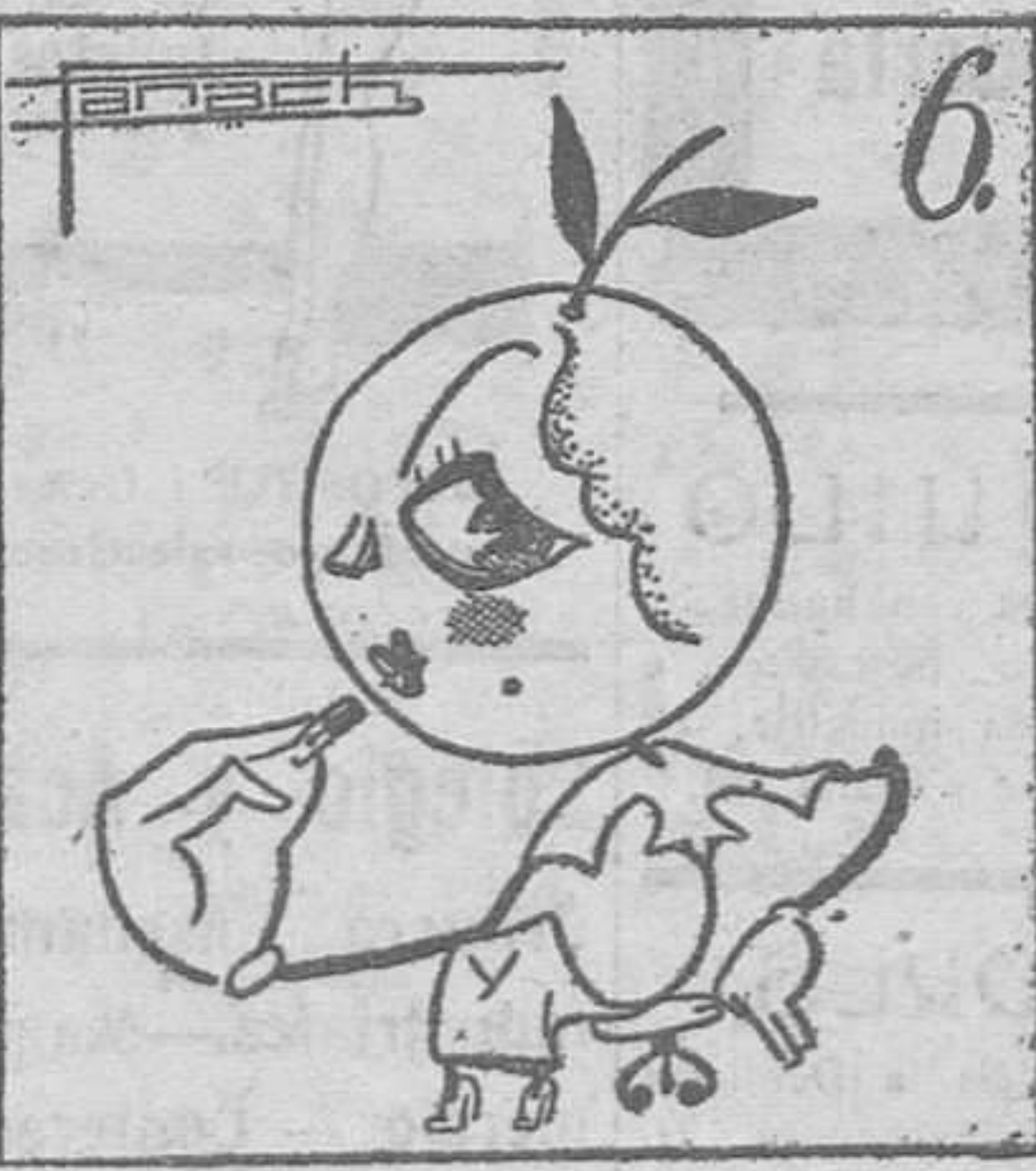
Y a la naranja... ¡chitón! ¡inada de "coloración"! (Texto y monos de Panach.)