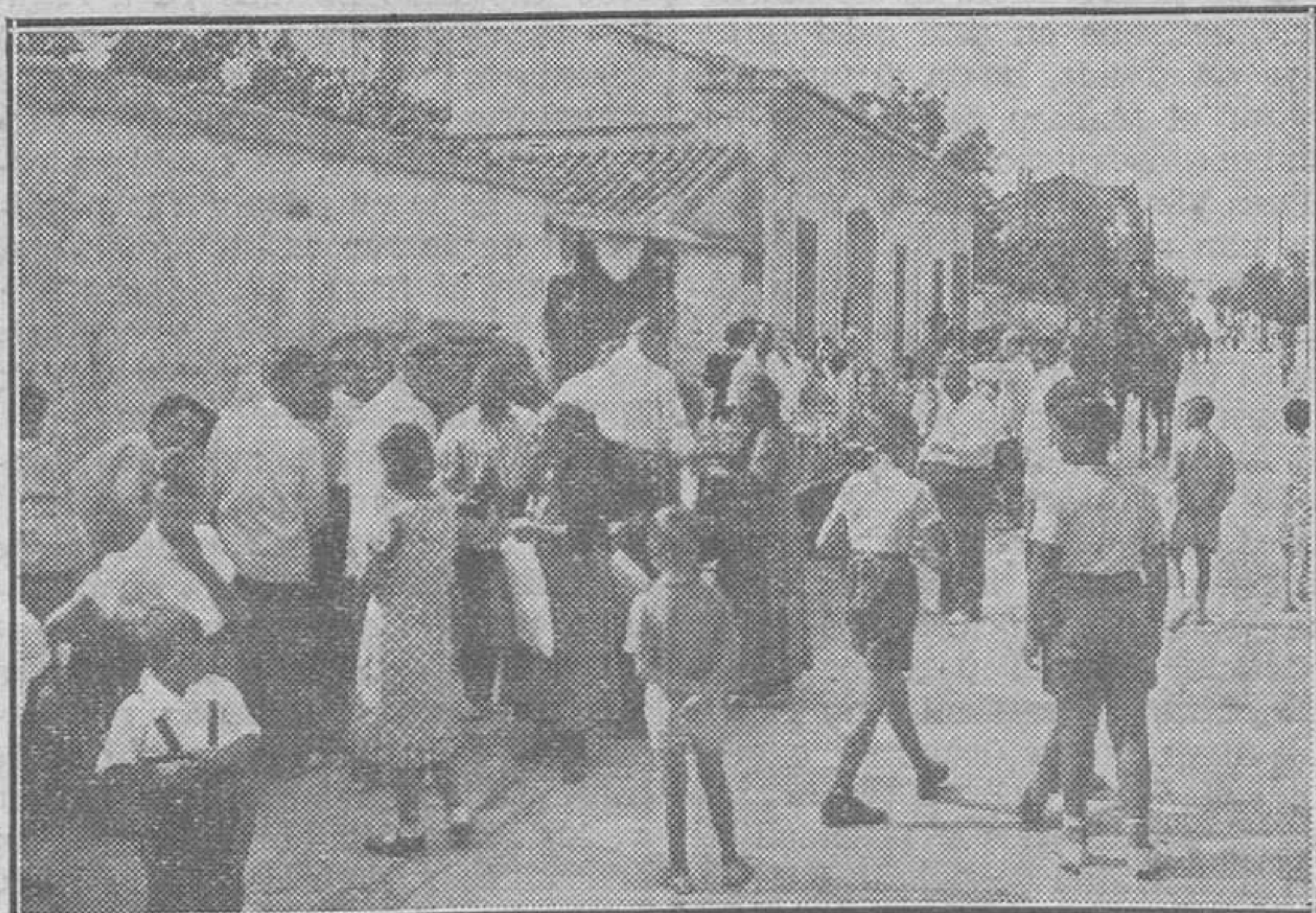
Reparto de raciones a los pobres, por la colonia veraniega de Benimaclet.

judicial, no resulte ni indicio siquiera de acto punible!