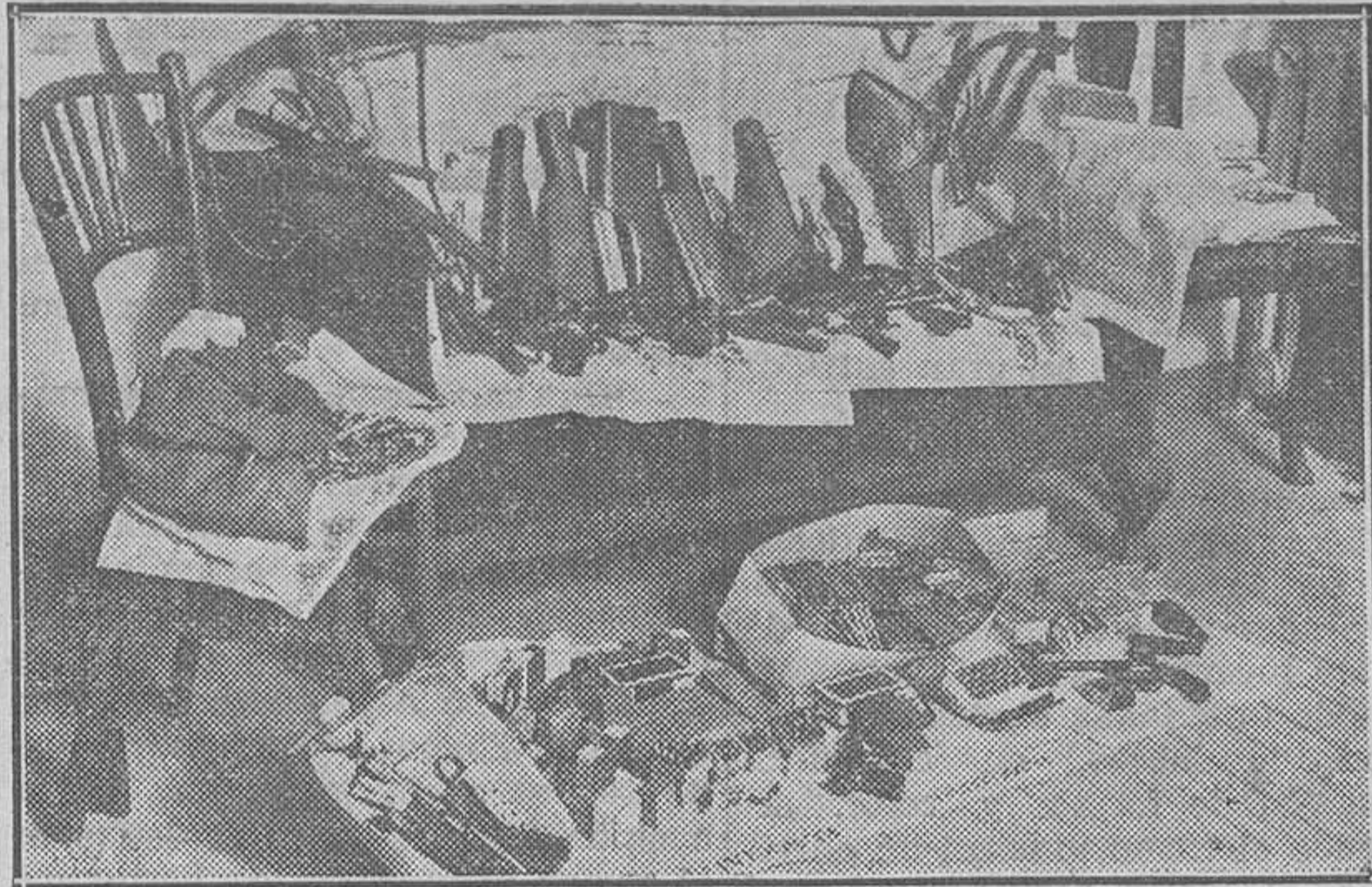
Uno de los varios lotes de armas y municiones hallados en la Casa del Pueblo de Madrid.

¡Y qué contraste! ¡Mientras se amparan y se alientan rebeldías como las transcritas, se persigue cruelmente a las organizaciones derechistas, encarcelándoselas, aun cuando contra ellas, según fallo