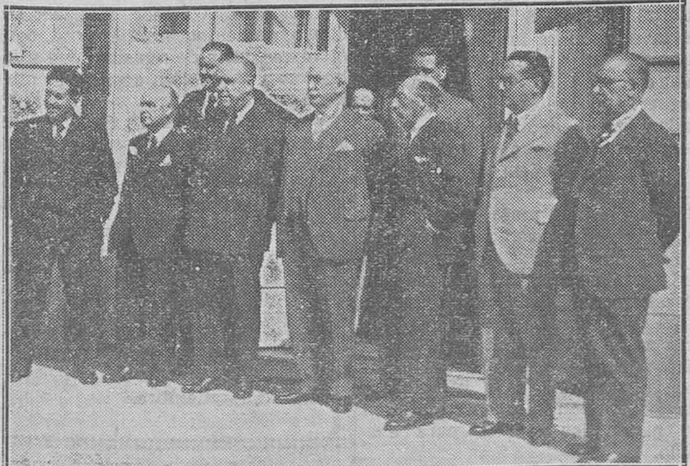
Los ministros radicales con el señor Lerroux, después del banquete con que obsequiaron al jefe del partido.

Sobre las Azores y sobre los países Escandinavos existen dos núcleos anticiclónicos, y al N. de Is-