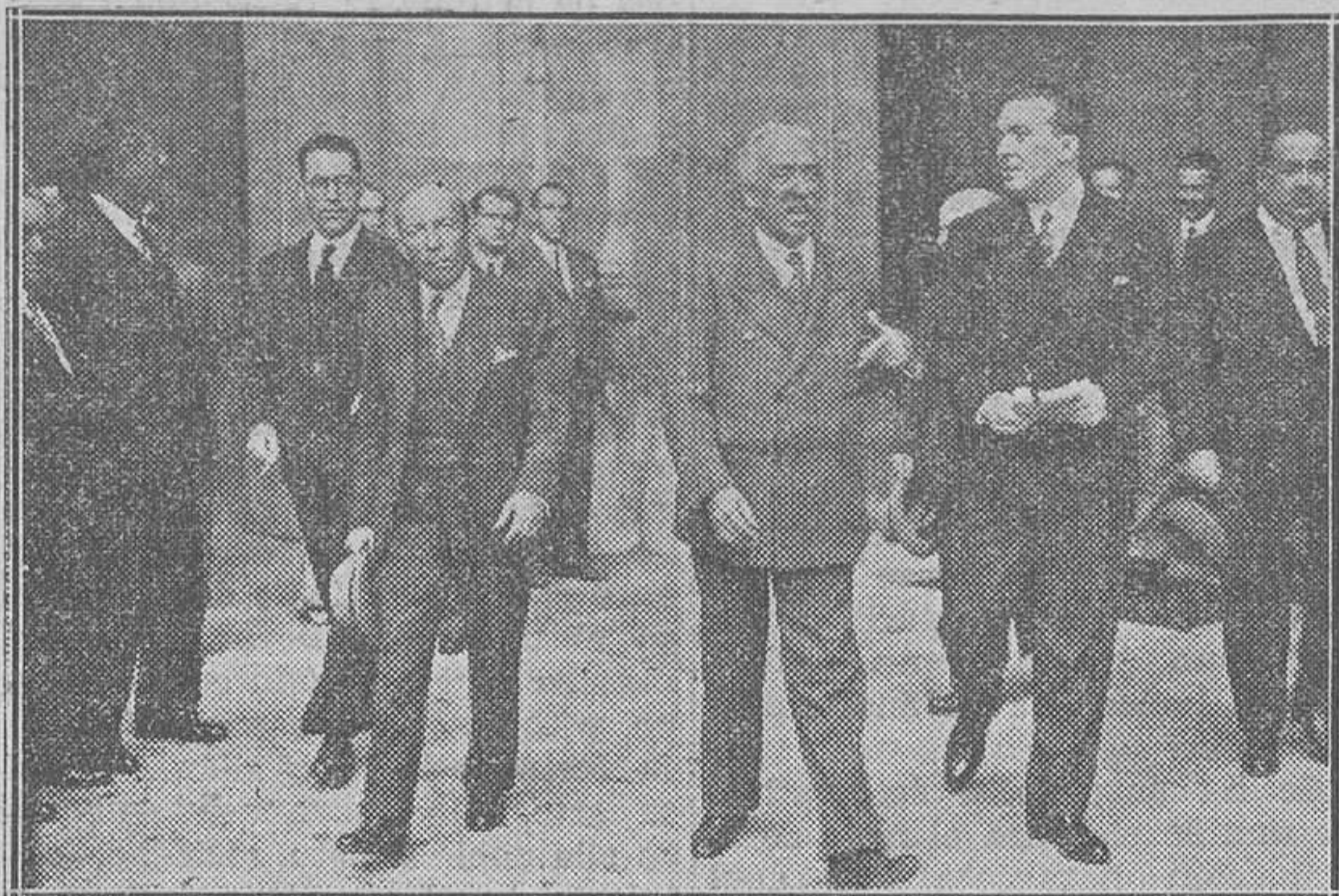
Los ministros, saliendo con el presidente de la República, después del último Consejo de Ministros, presidido por el señor Alcalá Zamora.

Si añadimos a estos cambios el que ha experimentado la diplomacia británica, podemos decir que los aliados de 1915 (no decimos: 1914, porque en esa fecha