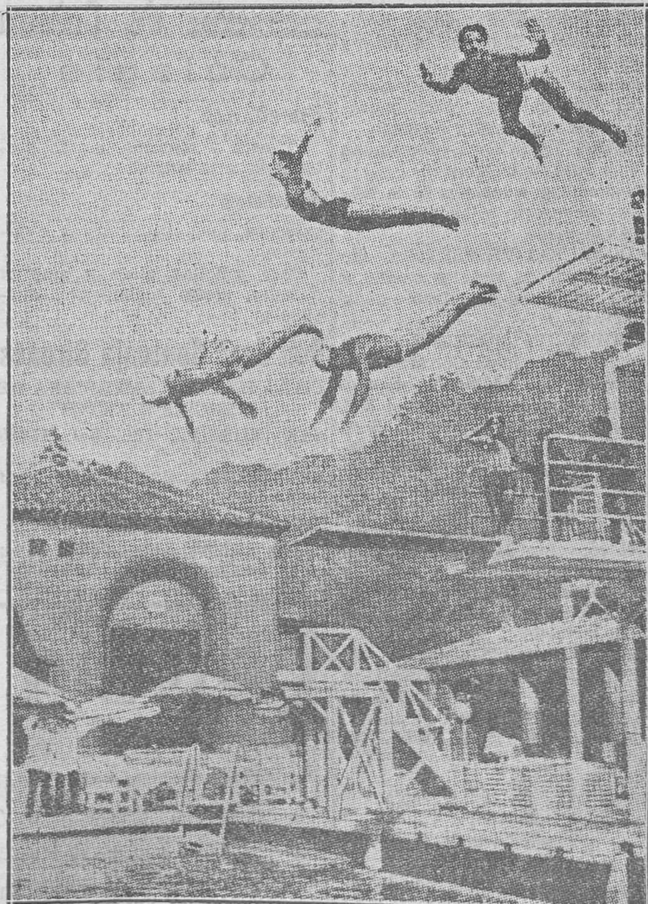
La moda de las piscinas no hace olvidar el mar, cuando hay fondo para ello. Véase cómo nadadores y nadadoras en la Costa Azul dan sus elegantes saltos

tas. Editorial Molino, Urgel, 245, Barcelona.