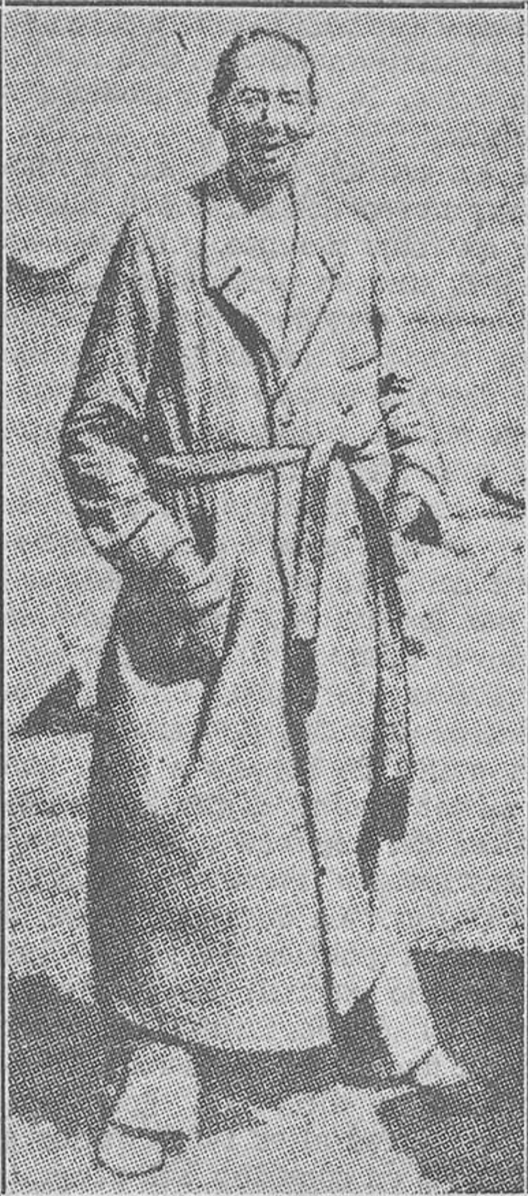
El señor Titulesco, ministro de Estado de Rumanía, veraneando en la Costa Azul, en el Cabo Martín.

Geo London relata unas impresiones con el famoso hombre de Estado rumano. Para respirar un poco a sus anchas el ministro va a la Costa Azul, en Roquebrune, junto al Cabo Martín. Allí lo sorprende el periodista, después de varias tentativas inútiles, cuando Titulesco sale del baño. Y sentados a