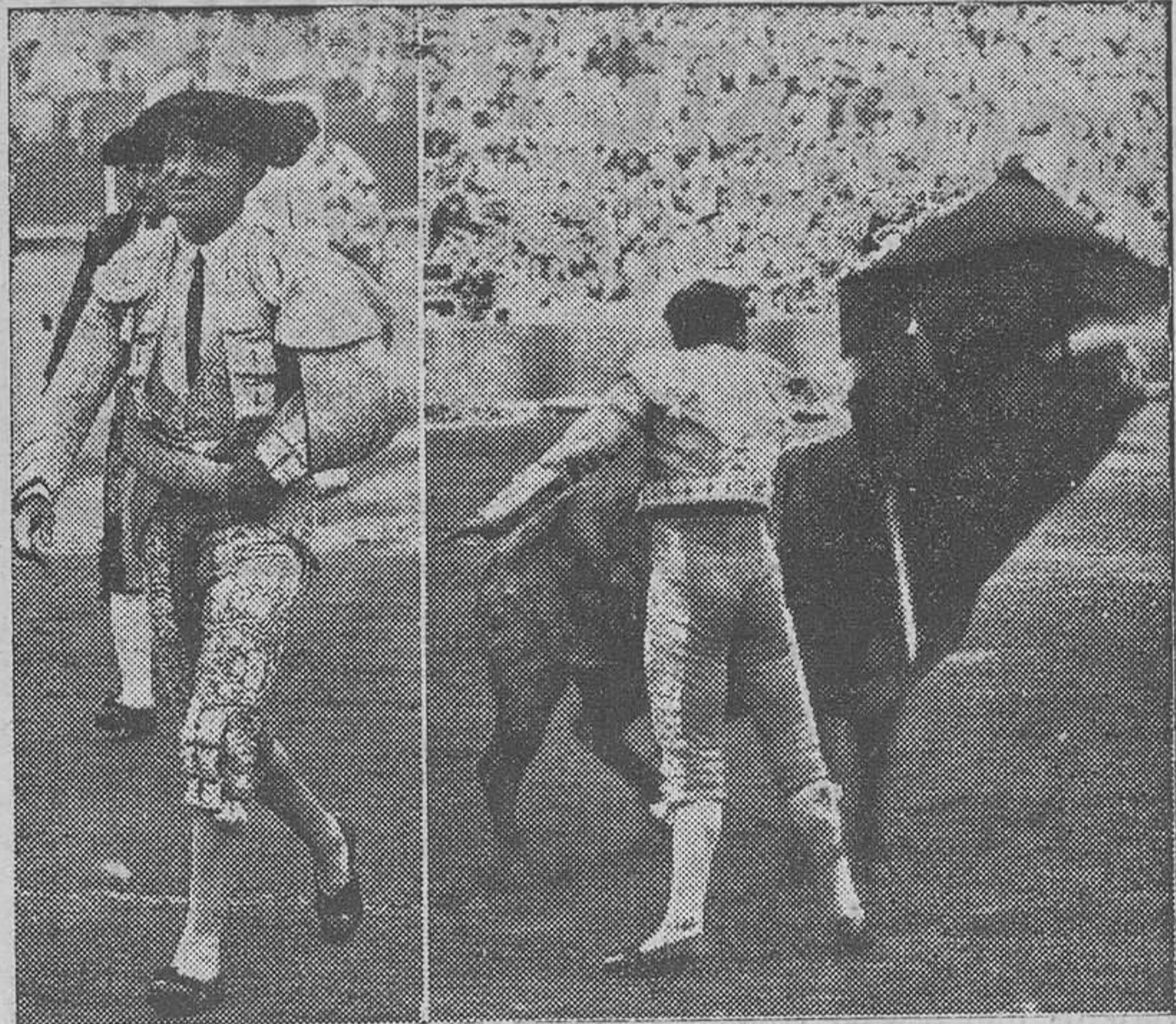
Juan Belmonte, en el paseo de cuadrillas.—Un muletazo de Juan Belmonte a su primer toro

Lo mejor para las patas de los perros, cicatrizante Bellver.