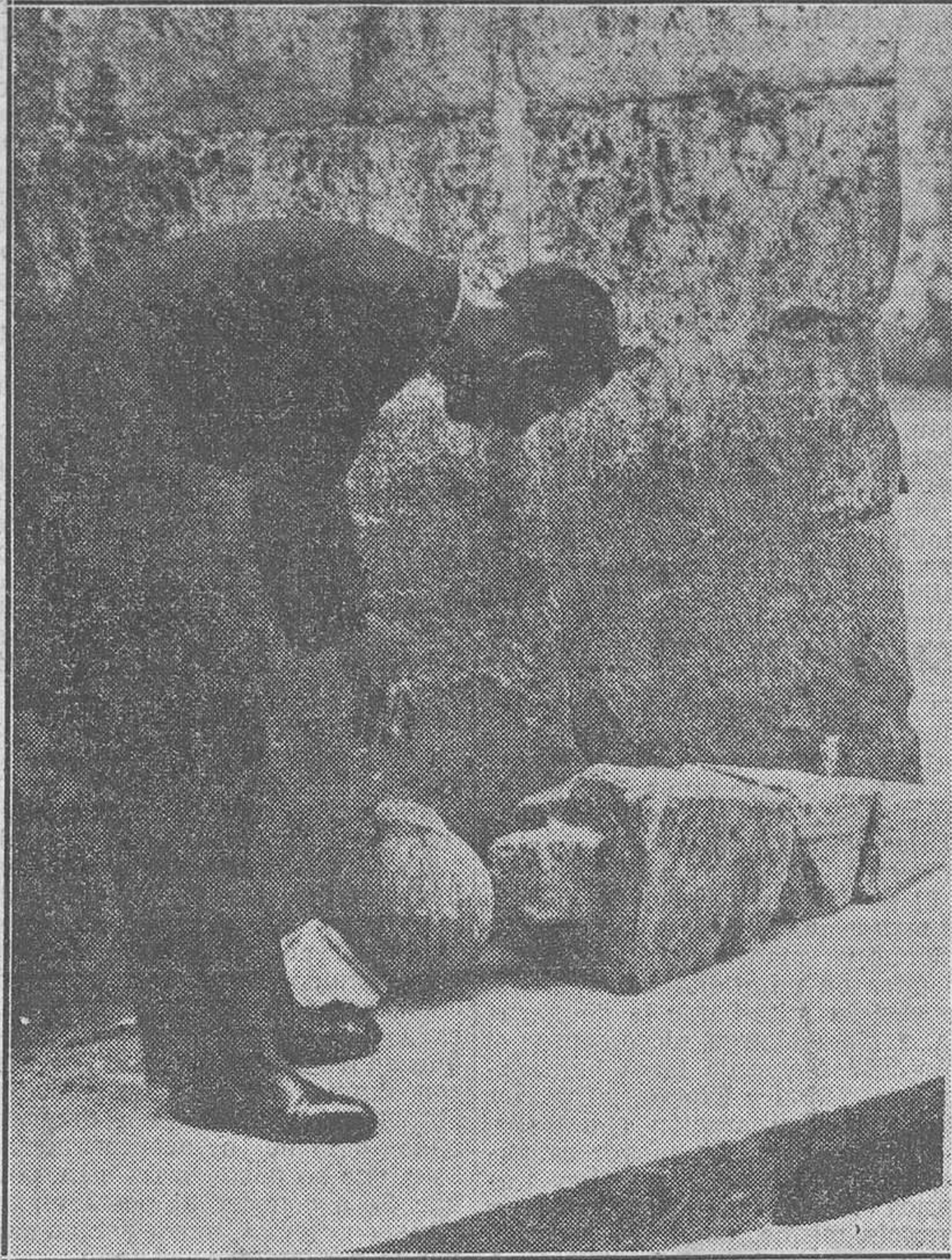
Uno de los adornos de la torre de San Andrés, derribado por el viento