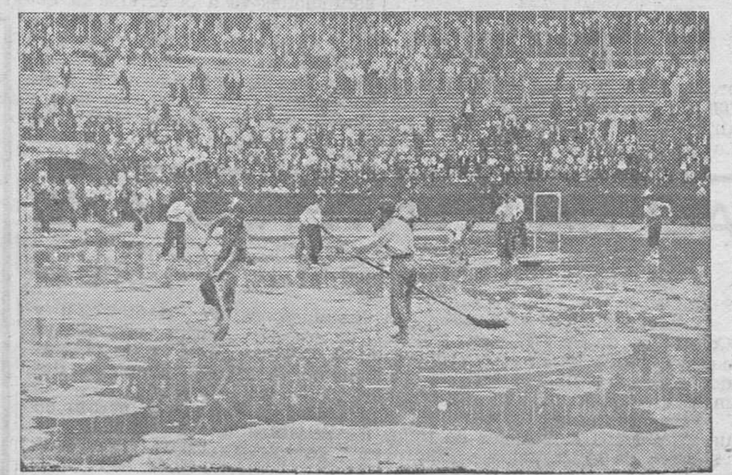
Los empleados de la plaza "desecando" la laguna

—¿Y los remojó, así, sin previo aviso? Meditó un instante San Pedro. Luego dió: