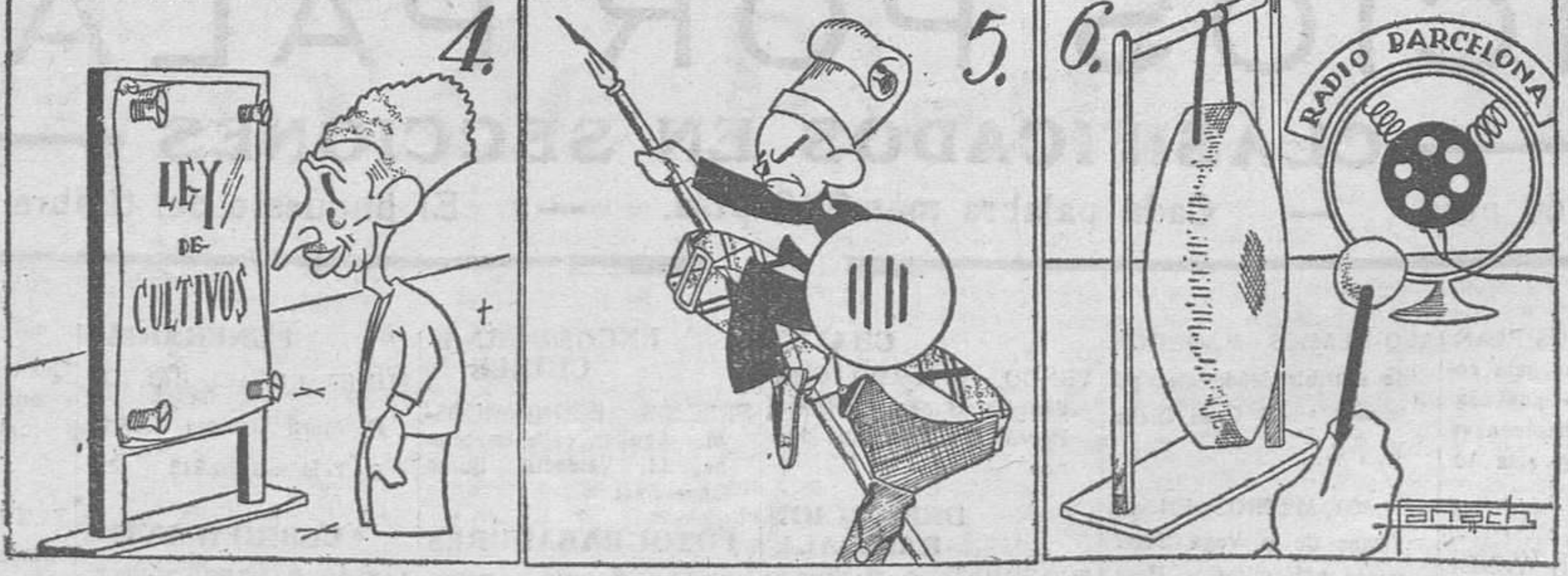
Companyns en sus trece está, que la ley no cambiará.