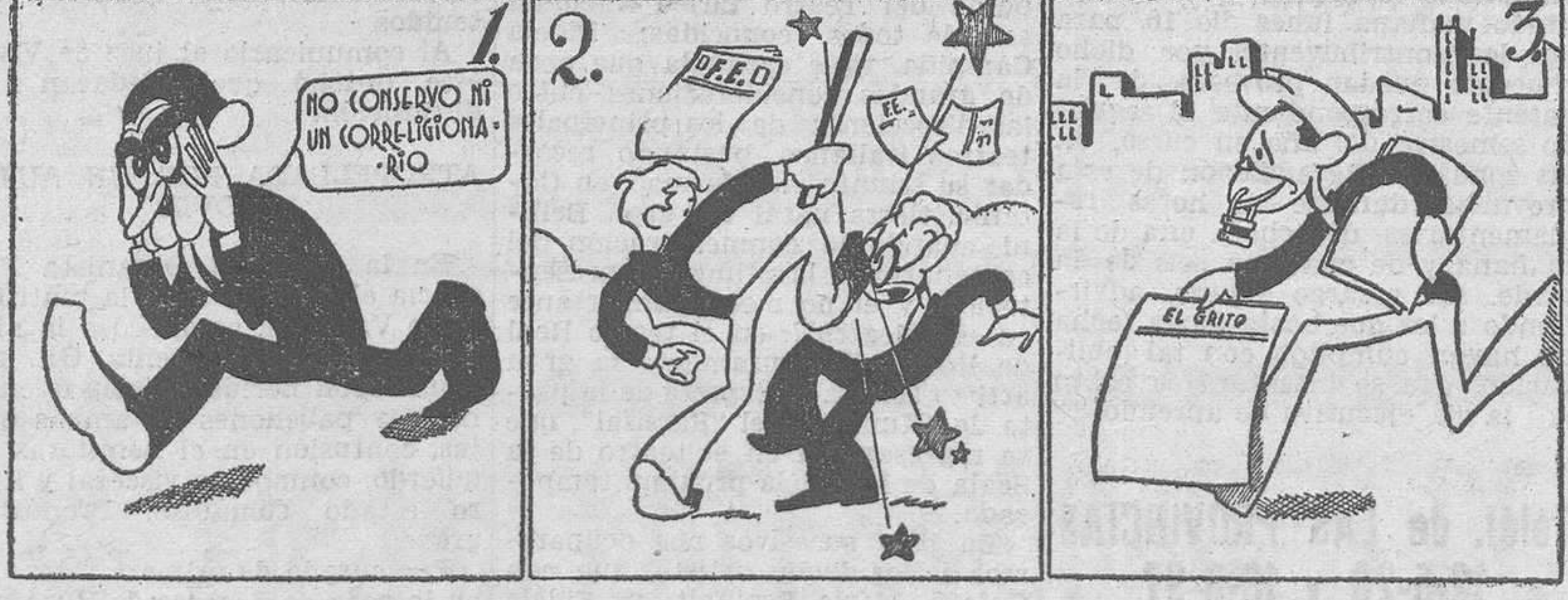
Maura sólo, sí, señor. ¿Y esto es un "conservador"?