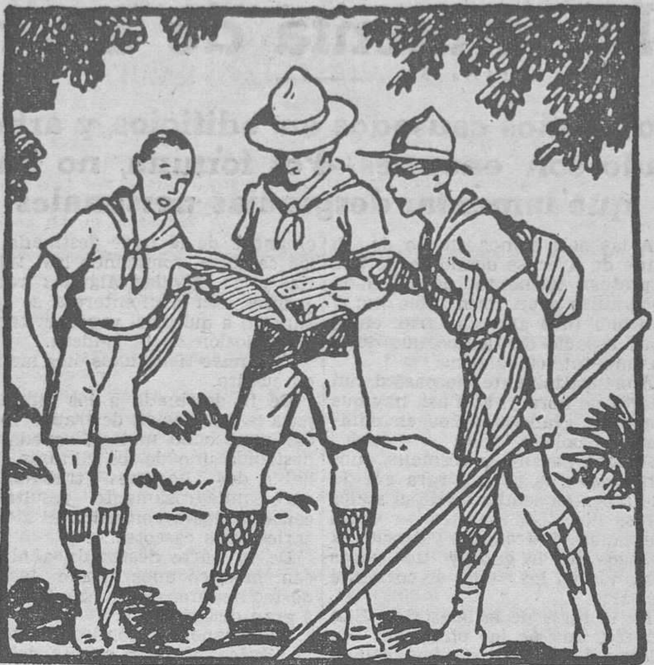
¡Católico! Hoy es la colecta para las Escuelas Católicas. A ellas debes de ayudar con tu limosna, pues atender a la Escuela Católica es "una necesidad primaria e imprescindible"

LEA USTED EN ESTE NUMERO NUESTRA SECCION DE "ANUNCIOS POR PALABRAS"