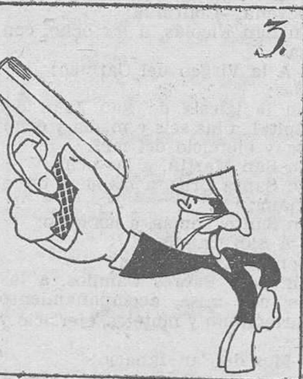
3. ¡Hay que ver! ¡Y cuánto yago! ¿Esto es Valencia o Chicago?