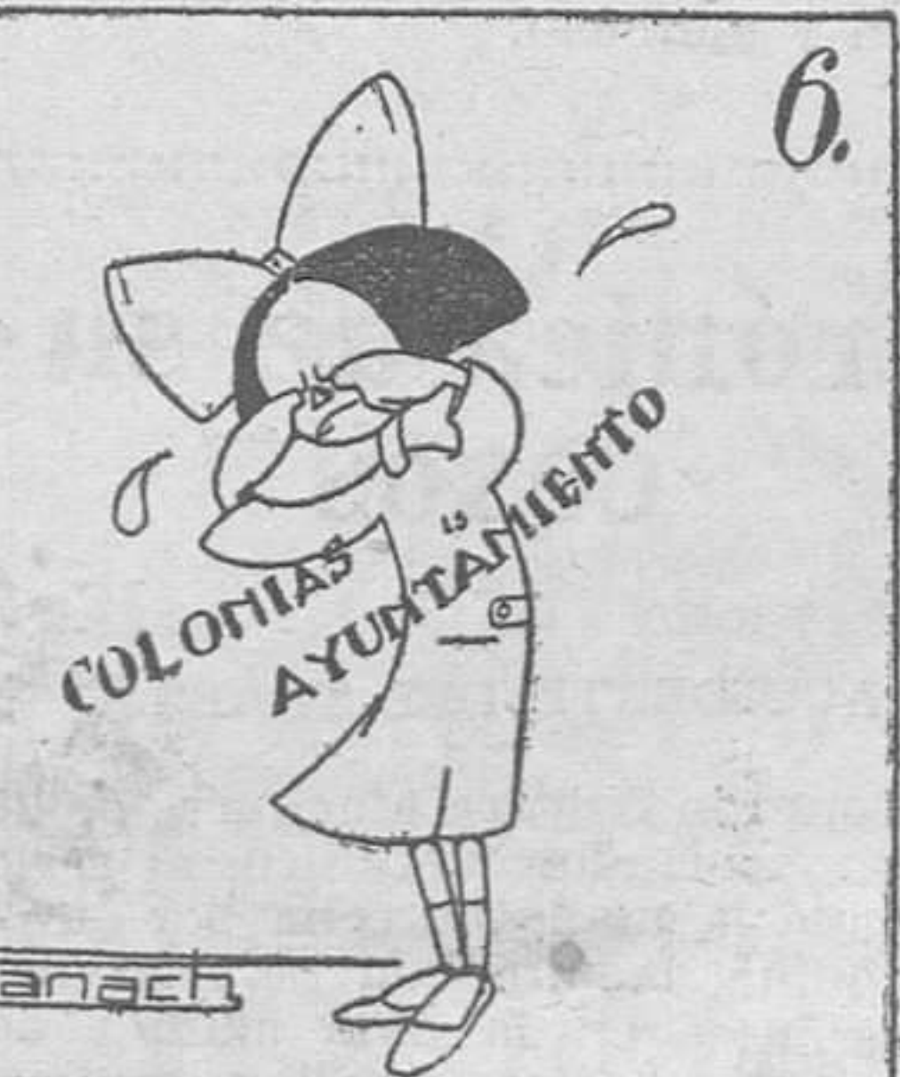
6. Y pasamos un mal rato viendo, al fin, quién paga el pato. (Texto y monos de Panach.)