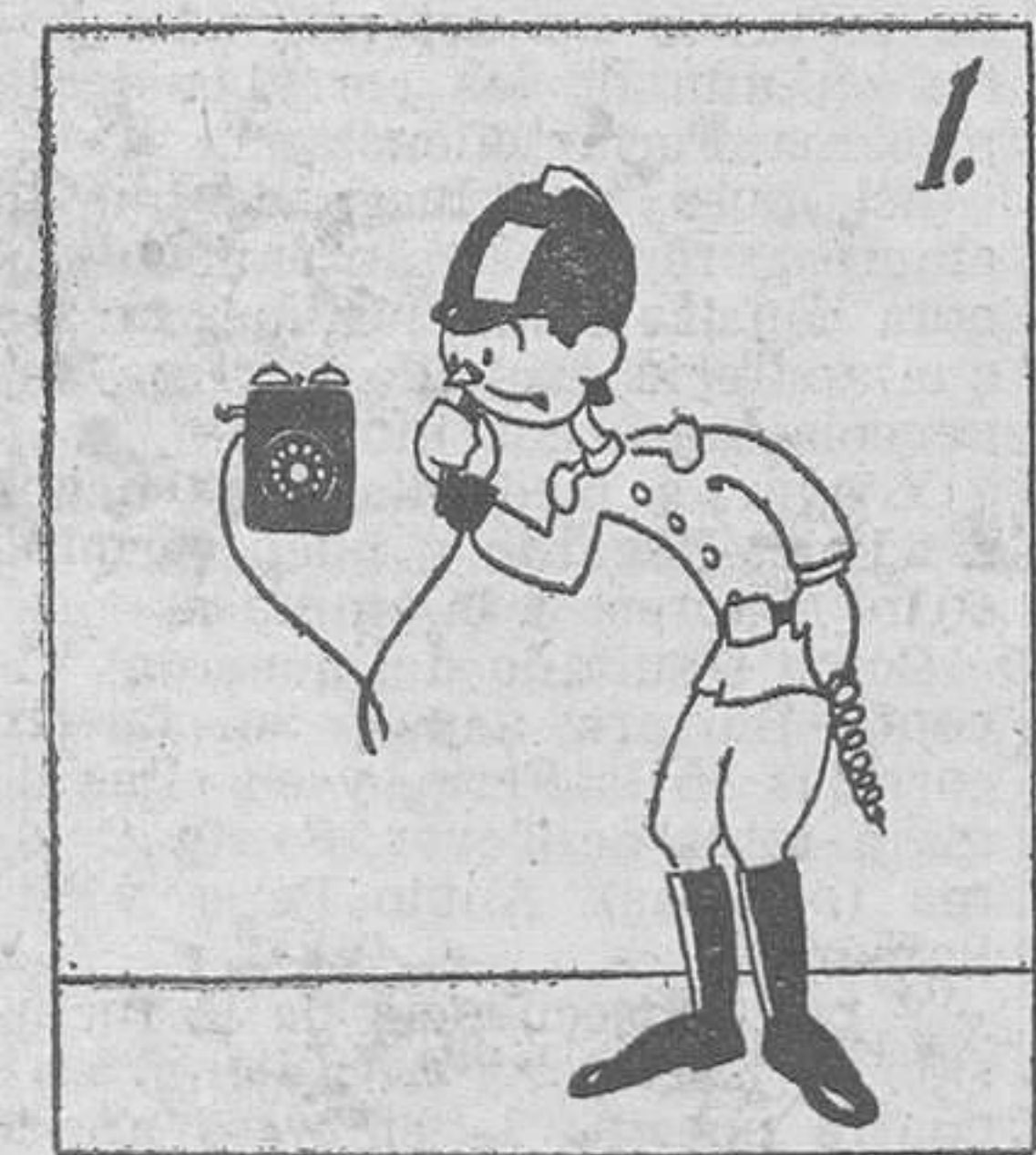
1. Con los bomberos no es justo gastar bromas de mal gusto.