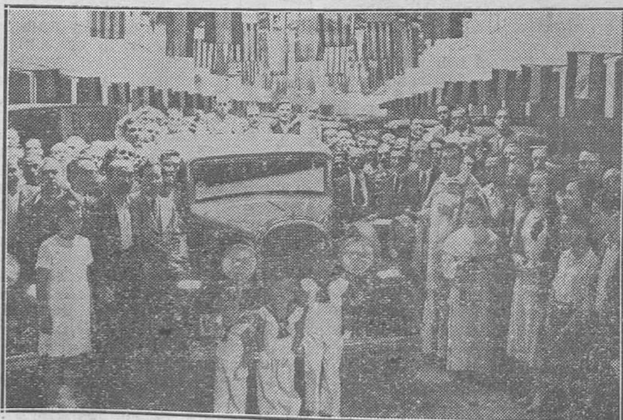
Bendición de automóviles.