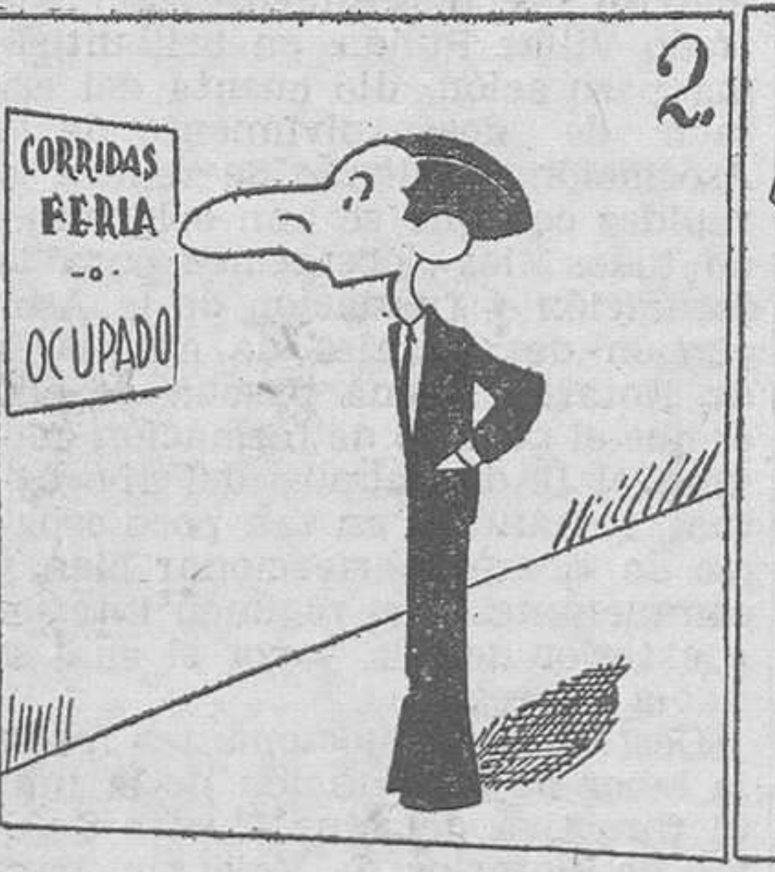
2. Por fin se entendió la gente, y torcerá Vicente.