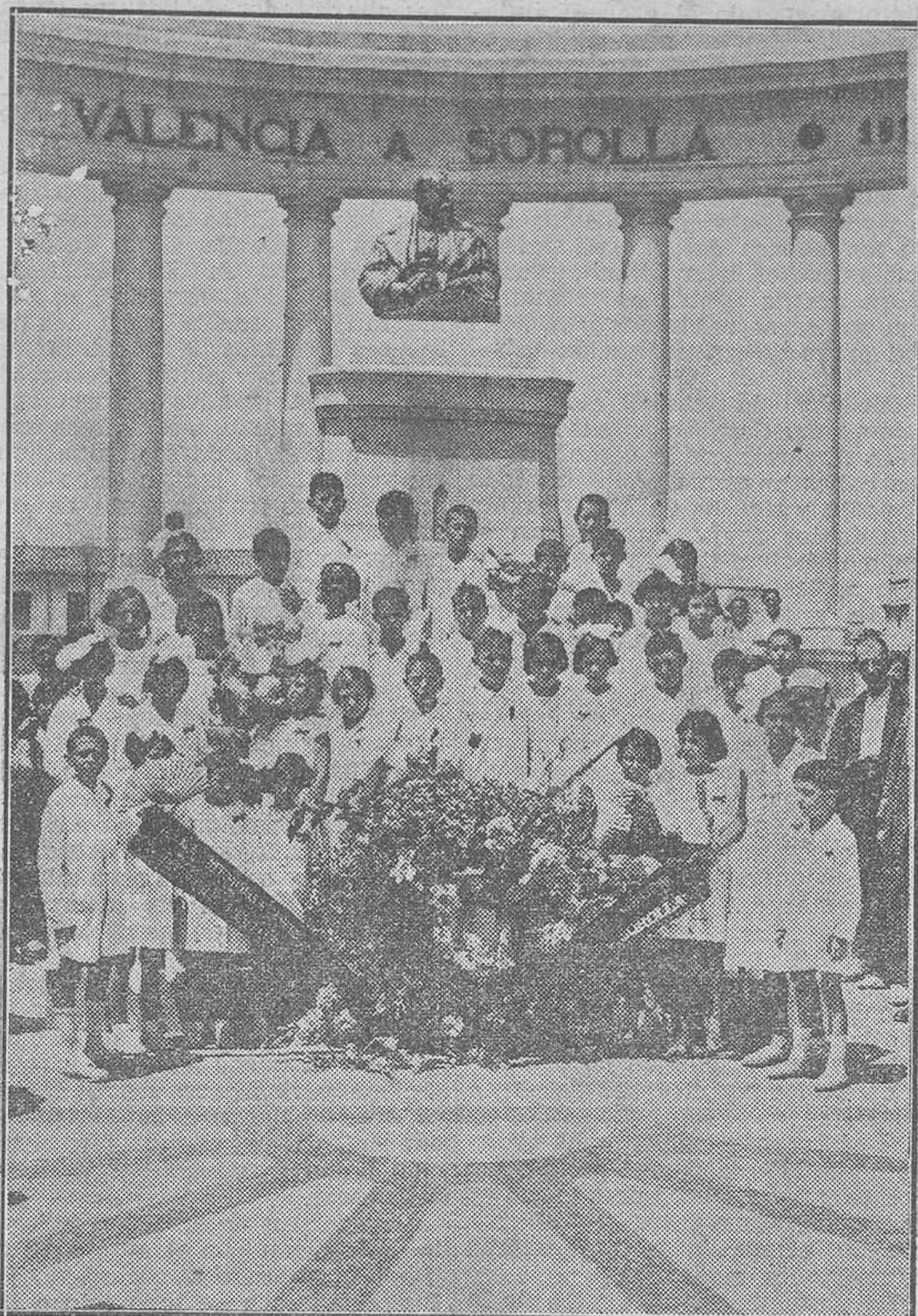
Homenaje a Sorolla por los niños del grupo escolar madrileño que lleva el nombre del ilustre pintor.