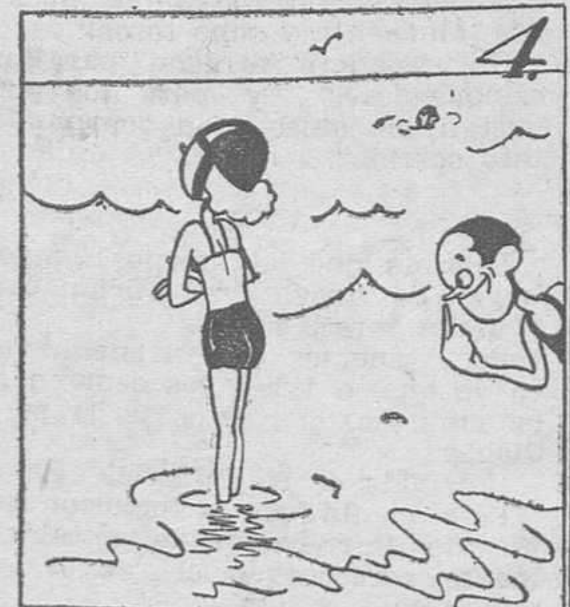
4. En la playa, las bañistas, proporcionan bellas vistas