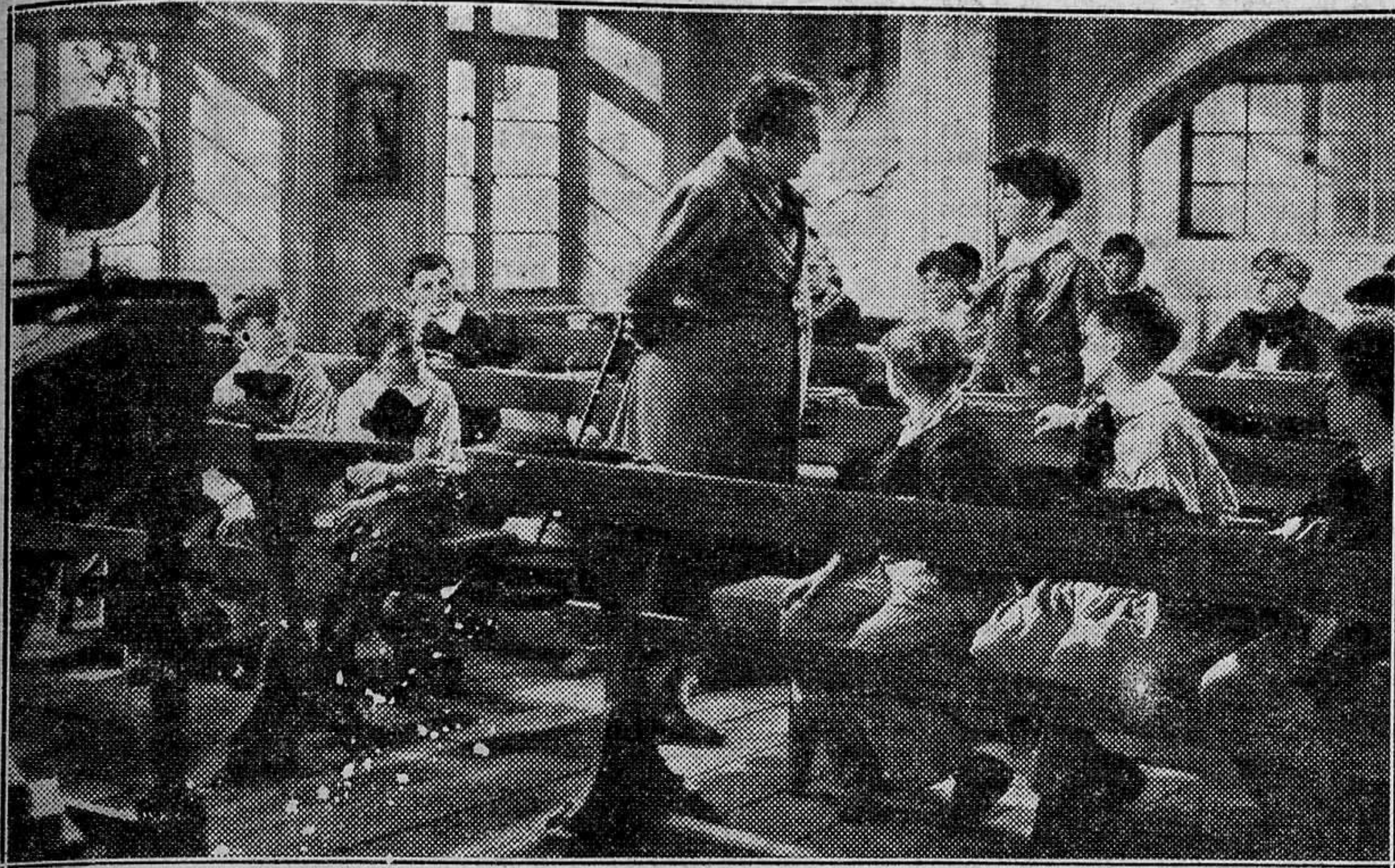
Entre las grandes producciones que están dispuestas para atraer al espectador en la temporada actual, se halla situada en un primer plano "Al llegar la primavera", que ha lanzado al mercado la batalladora Cifesa. Es éste, uno de los más sentimentales instantes del film exquisito y vibrante que toma como figura central de su fábula la del inmortal compositor Franz Schubert