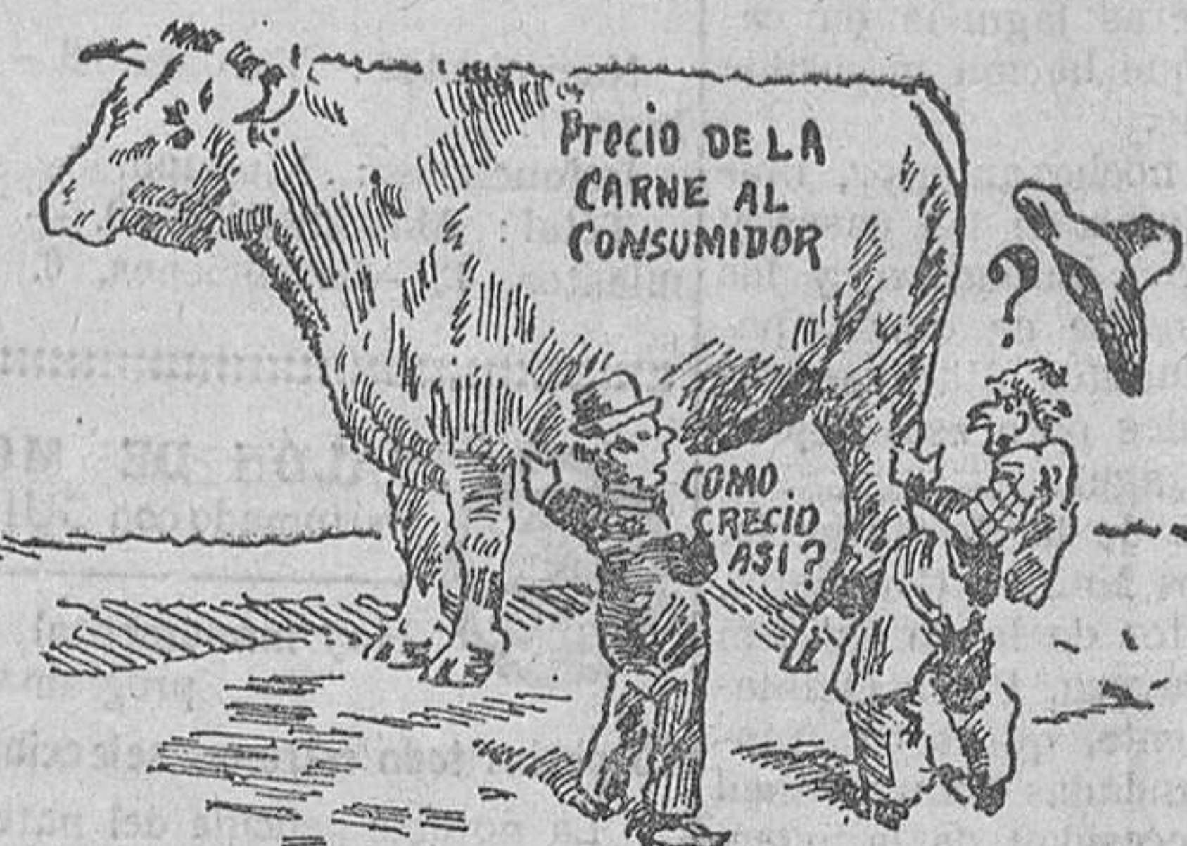
No se creea que es el mismo animal (Anales de los Socios)

Dice el artículo del periódico argentino de donde tomamos las figuras: «La diferencia de tamaño de los dos bueyes, tiene por finalidad hacer resaltar que entre el precio que se le paga al ganadero por animal, y el precio que se le hace pagar al consumidor, hay un aumento de valor alrededor de 535 por ciento.