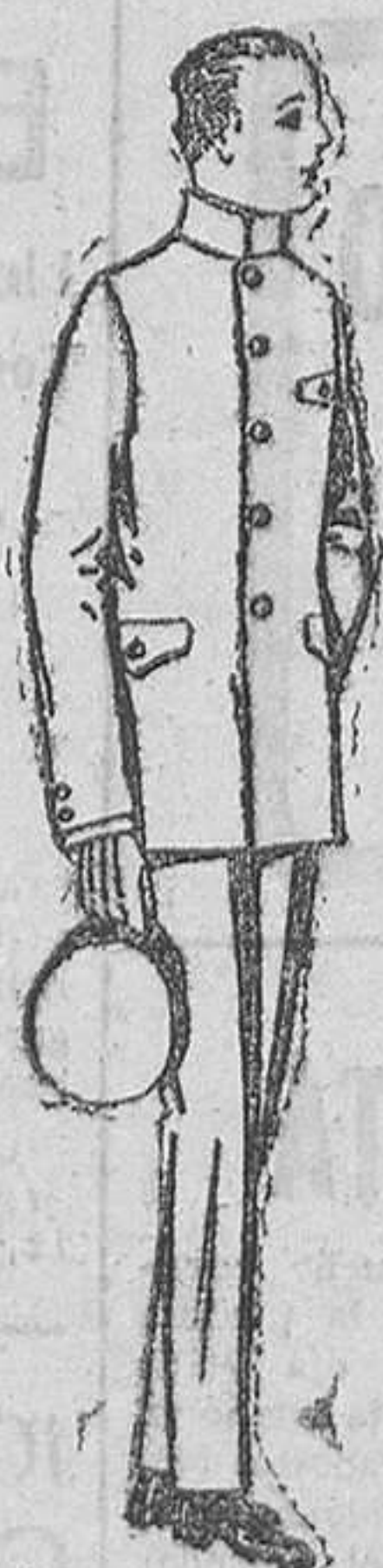
Trajes de vicuña azul o estambre gris, para grooms de 10 a 15 años.—De ptas. 45 a 80. Los mismos, con pantalón breeches.—De ptas. 47 a 80.