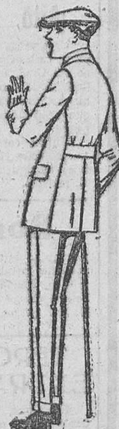
Trajes modelo Sport, de lanilla, melton, etc., para jovencitos de 10 a 16 años.—De ptas. 37 a 90. El mismo modelo en dril listado, crudo o kaki.—De ptas 25 a 42.