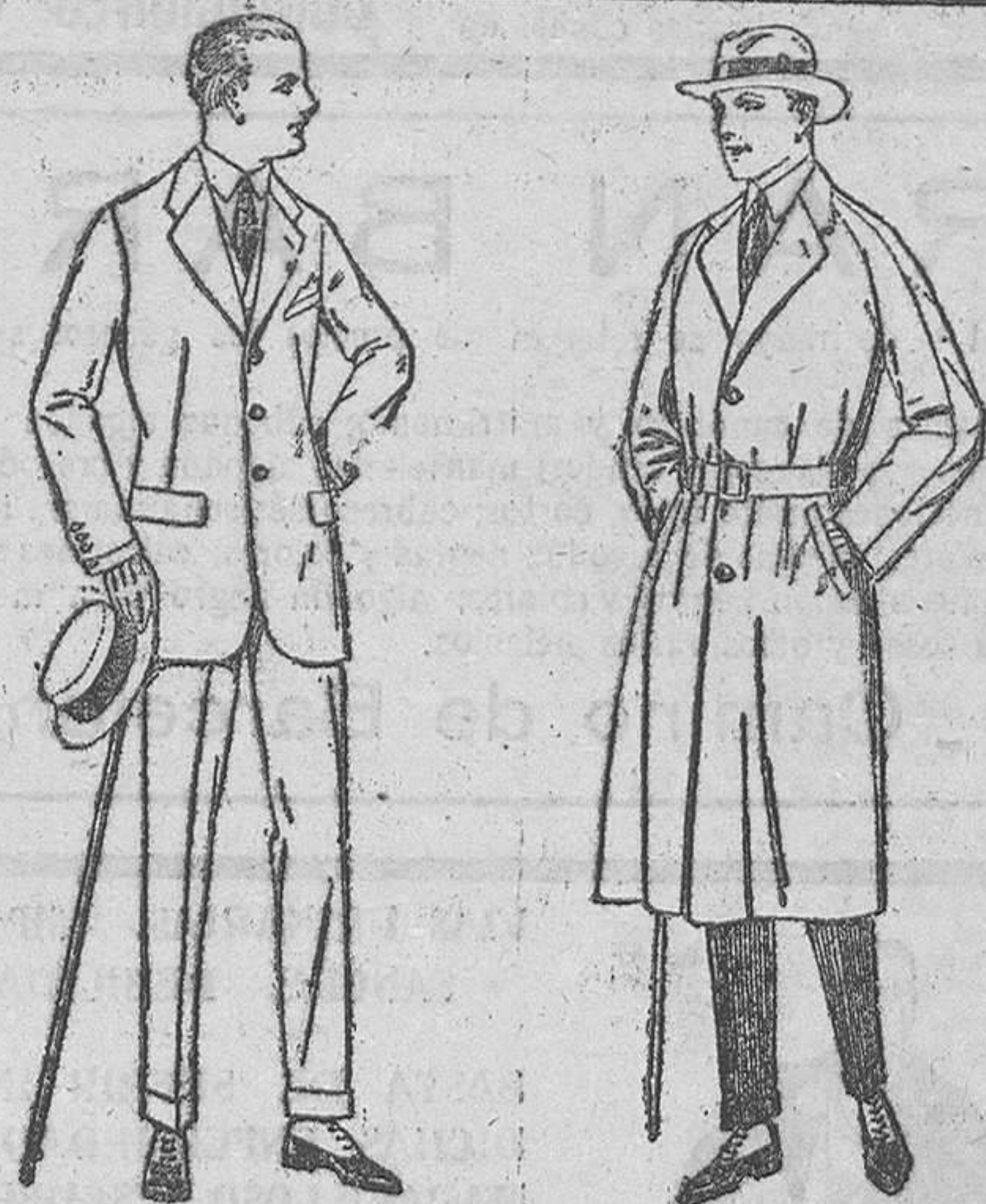
Trajes de lanilla, melton, estambre, vicuña o jerga.—De ptas. 35 a 145. Trajes de dril crudo, kaki o listado.—De ptas. 28 a 60.