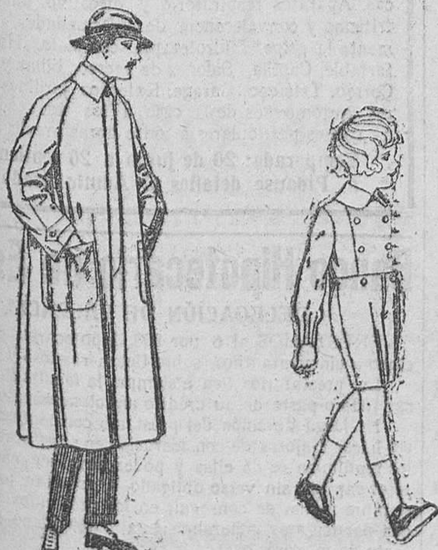
Impermeables forma gabán, raglán.—De ptas. 40 a 170. El mismo modelo, en caoutchouc, negro.—De ptas. 70 a 90.