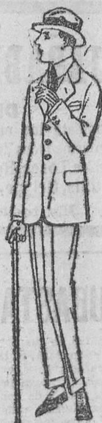
Trajes de lanilla, vicuña o estambre, para jovencitos de 10 a 16 años.—De ptas. 30 a 90. Trajes de dril listado, crudo o kaki.—De ptas. 23 a 40.