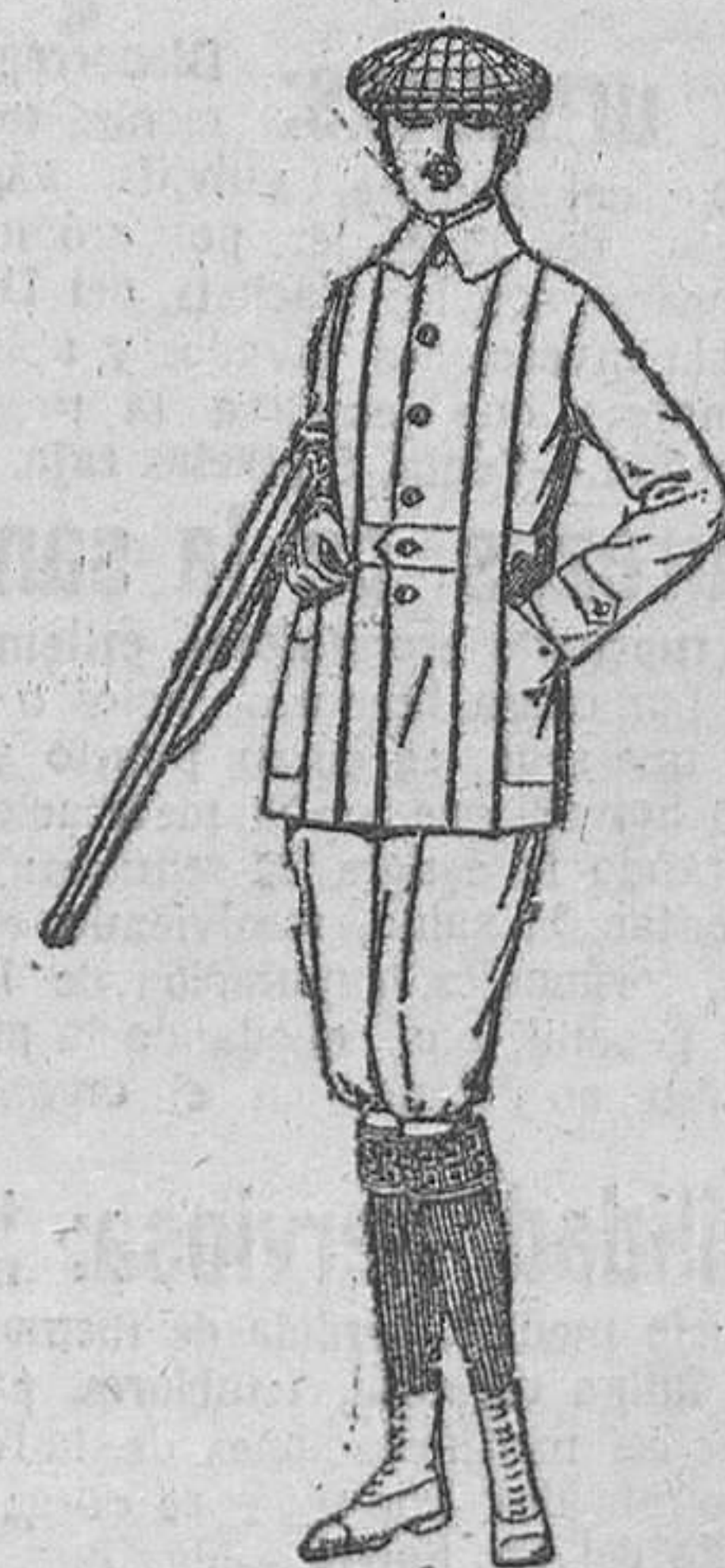
Cazadoras de dril crudo o kaki.—De ptas. 18 a 30. Pantalones cortos, para excursionistas, de dril, beige o gris.—De ptas. 10 a 18.

Ropas confeccionadas para caballero, señora, niño y niña