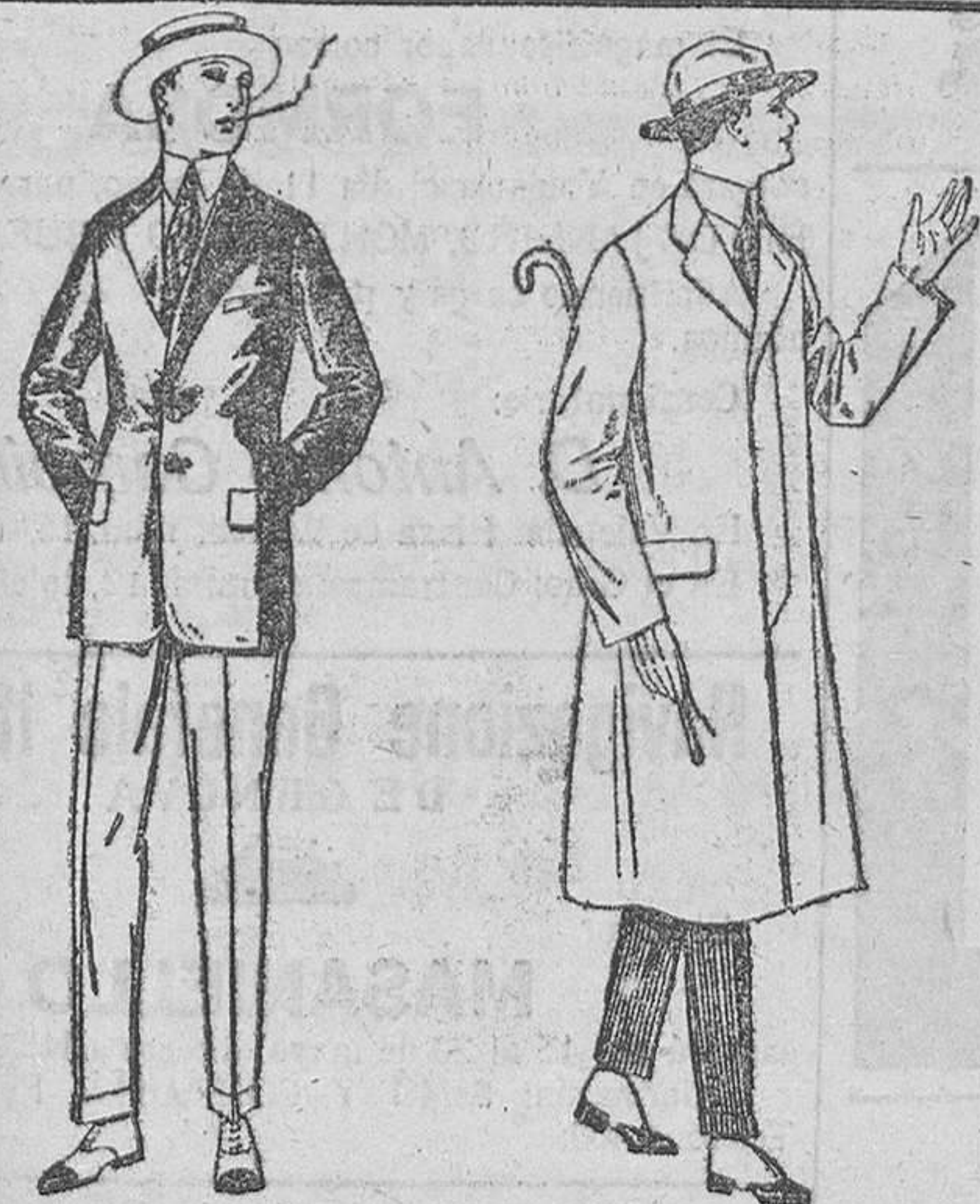
Trajes de alpaca negra o azul.—De ptas. 70 a 95. Americanas de alpaca negra o azul.—De ptas. 40 a 60. Pantalones de dril liso o listado.—De ptas. 9 a 18.

SUCURSALES: Madrid, Barcelona, Alicante, Almería, Bilbao, Cádiz, Cartagena, Gijón, Granada, Málaga, Palma de Mallorca, Santander, Sevilla, Valladolid y Zaragoza