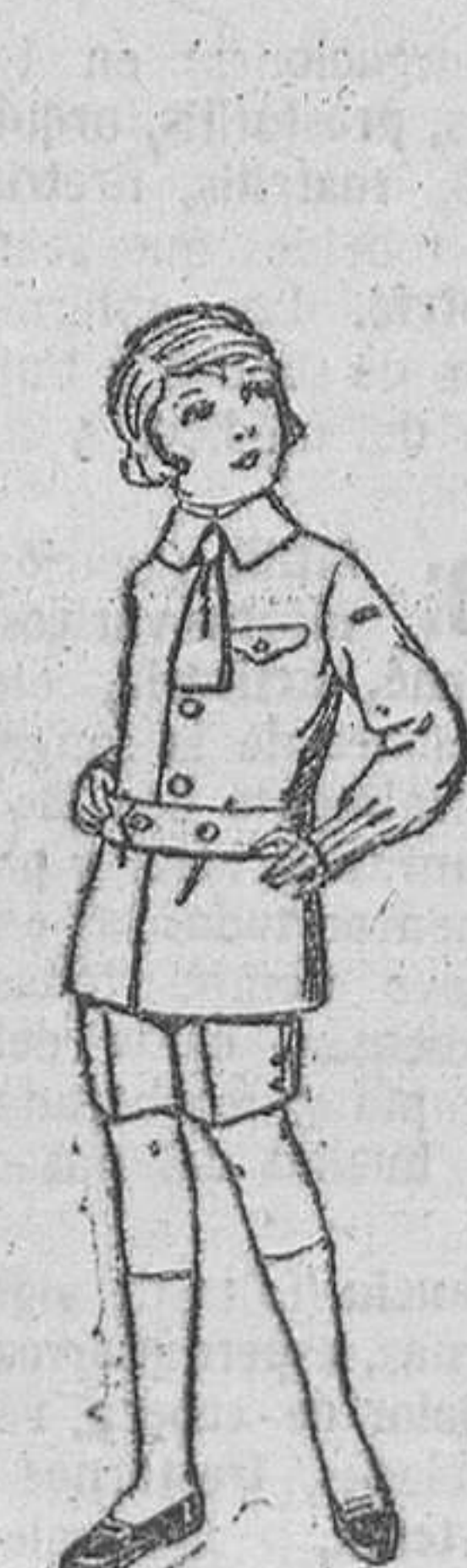
Trajes de lanilla, melton, etcétera, para niños de 4 a 9 años.—De ptas. 15 a 25. Los mismos, de dril liso o listado.—De ptas. 11 a 15.