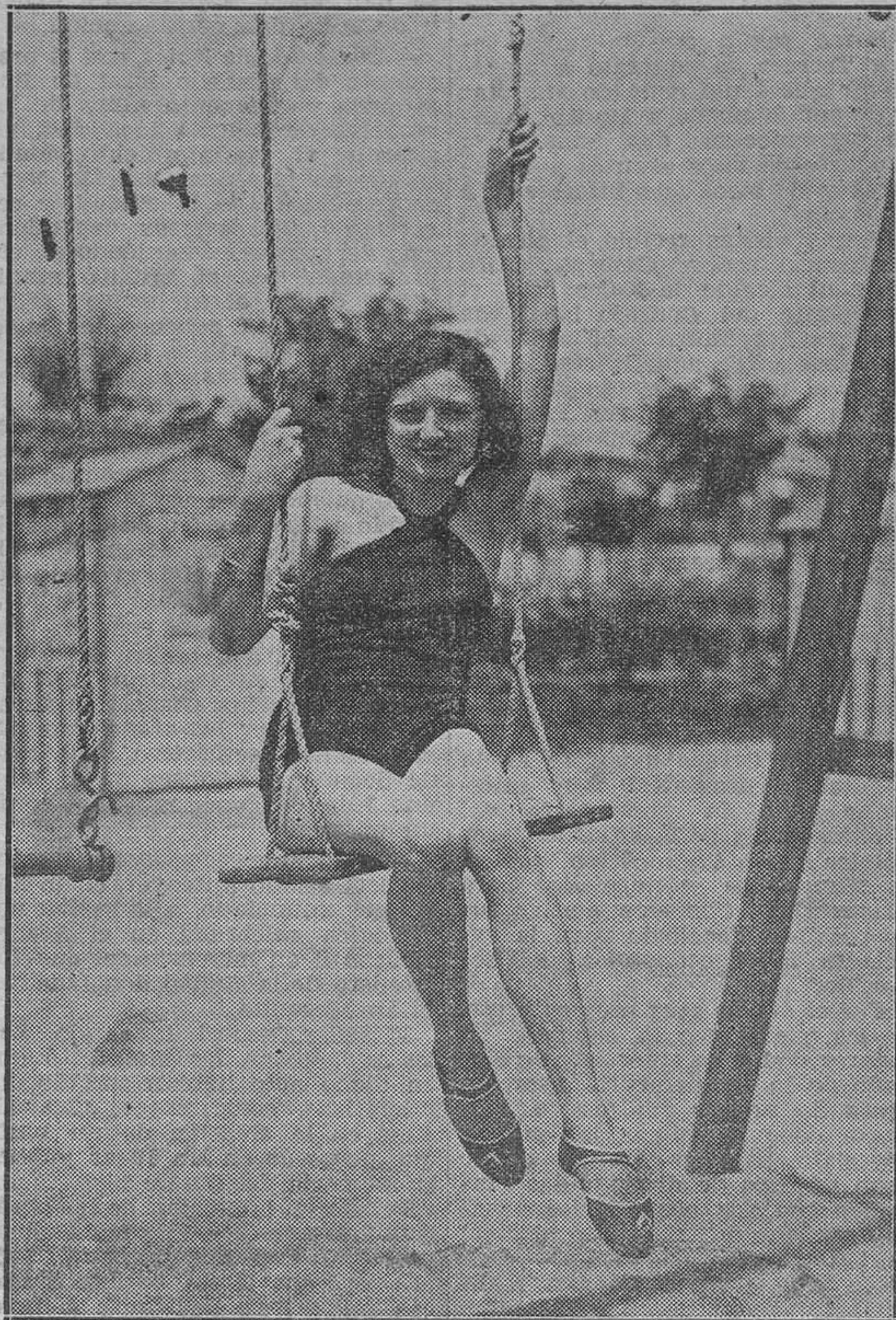
Una bella abonada.