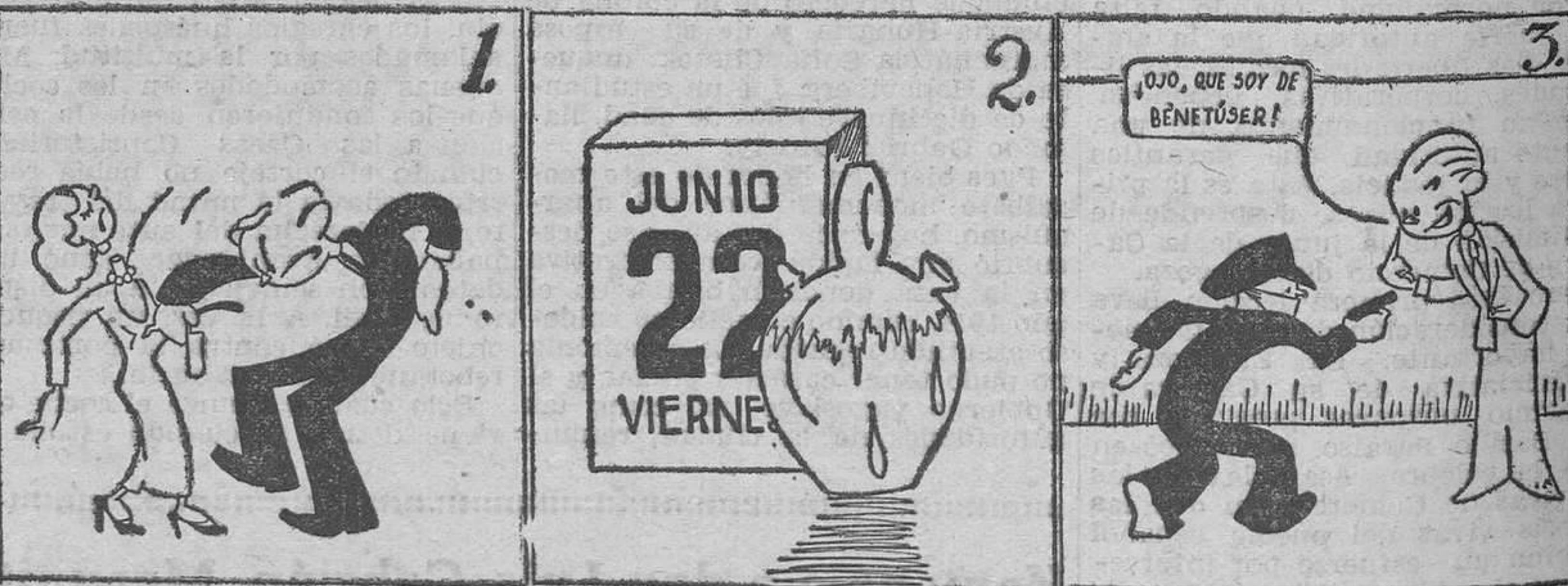
El lapso primaveral ha acabado pasional.