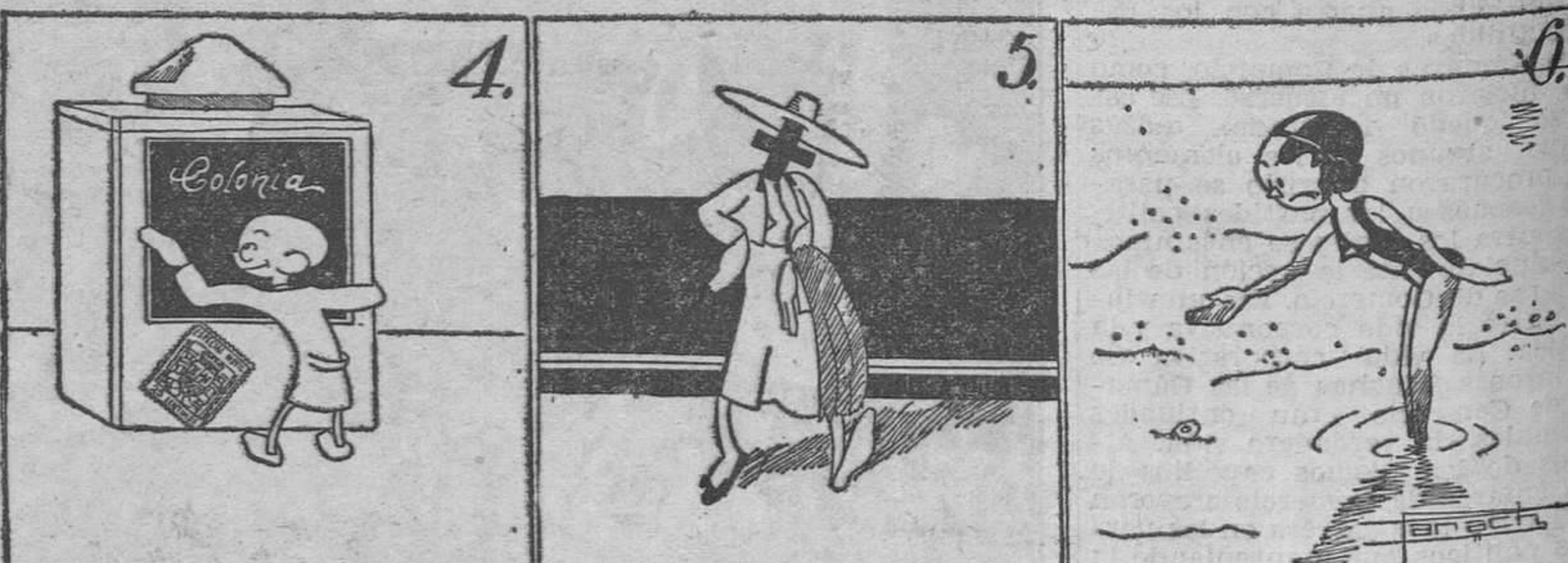
Acogen a muchos miles las colonias infantiles.