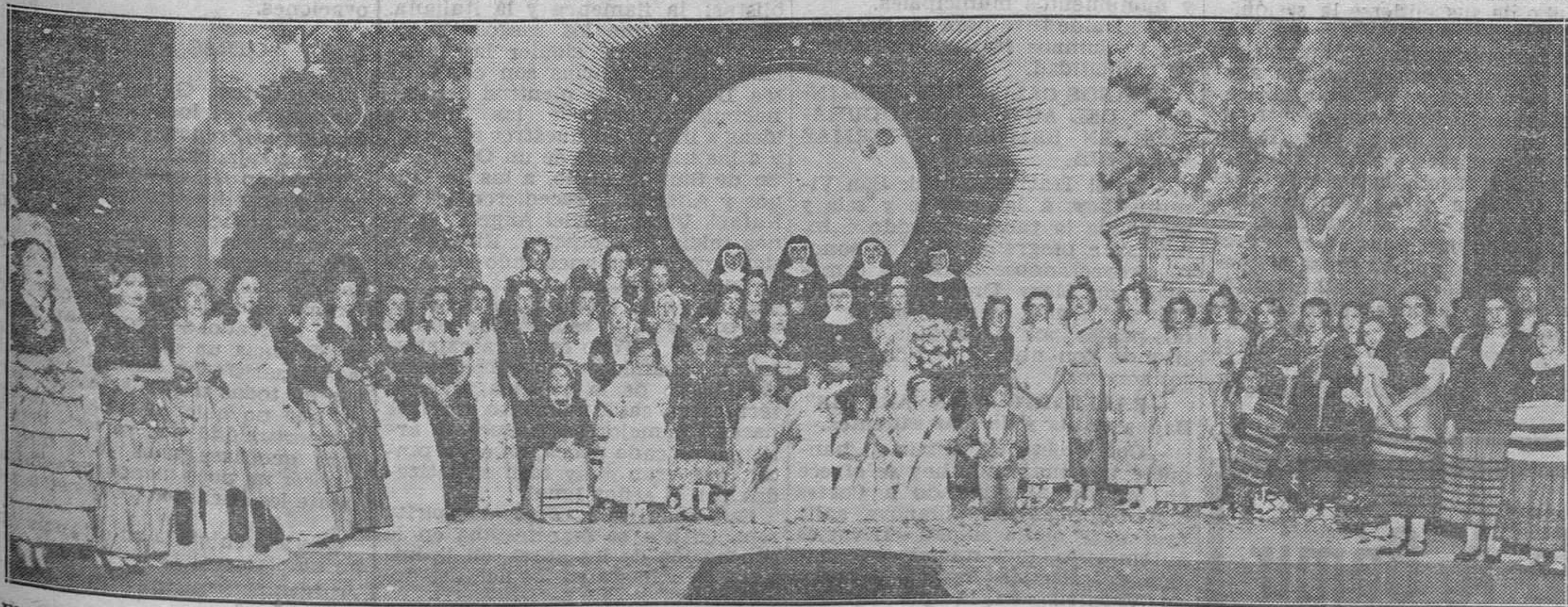
El cuadro de bellísimas "artistas" que tomaron parte en la función benéfica del pasado viernes en nuestro teatro Principal, como homenaje a la Santa Madre Sacramento.

Ovacionadísimo fué al terminar, y los aplausos se repitieron al abandonar la mesa presidencial