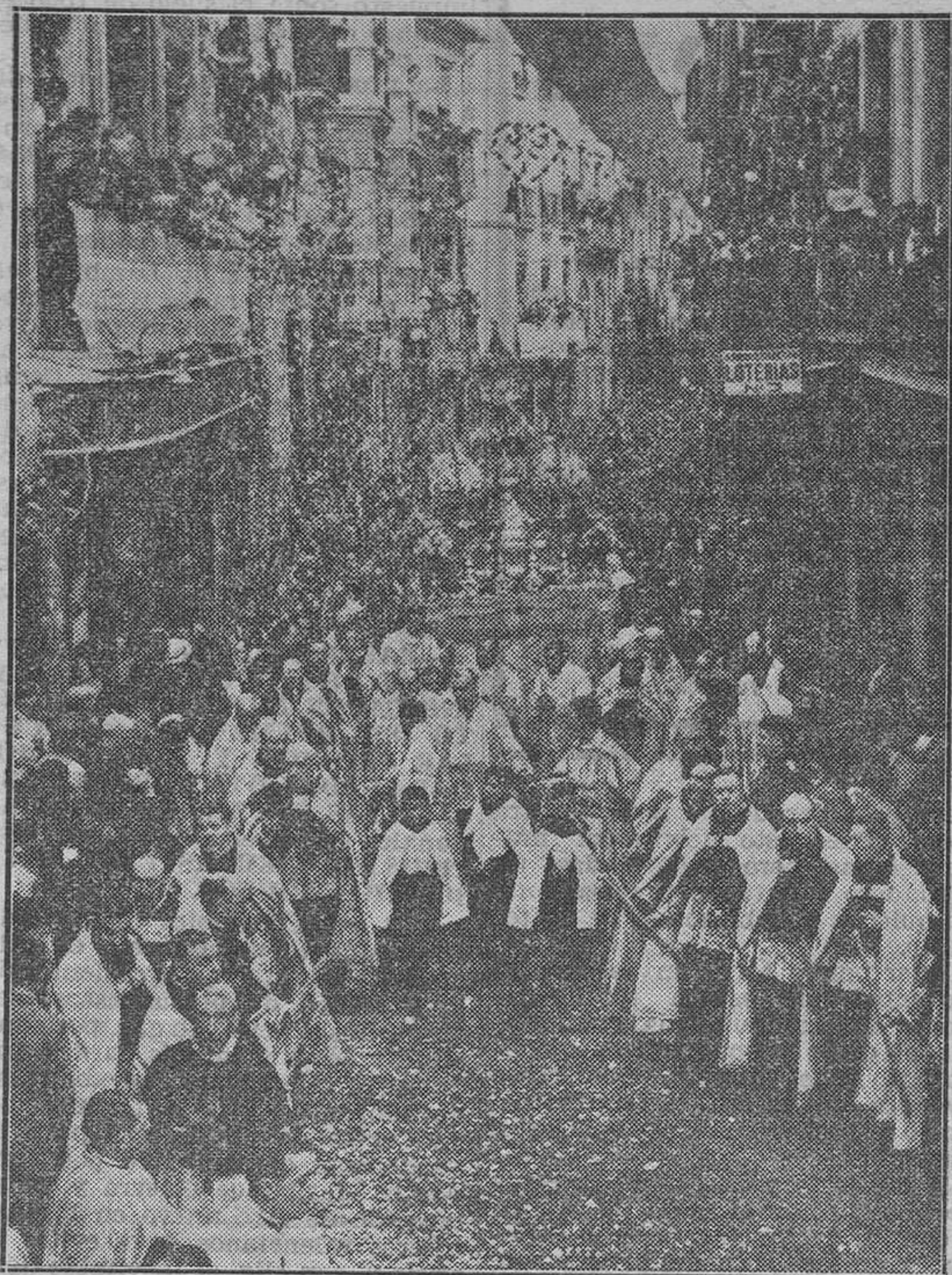
En Granada se han celebrado con gran brillantez las fiestas del Corpus. He aquí una vista del paso del Santísimo Sacramento por las calles de la ciudad.

Una de las armas de que más uso han hecho nuestros revolucionarios, ha sido la de la falsedad y la de la insidia. Hasta los más encumbrados de ellos, como los señores Azaña, Marcelino Domingo, Prieto, Largo Caballero, Casares Quiroga y otros más, no han tenido el menor empacho, aún desde los altos puestos a los que lograron encaramarse, en continuar aquella campaña de falsedades e insidias