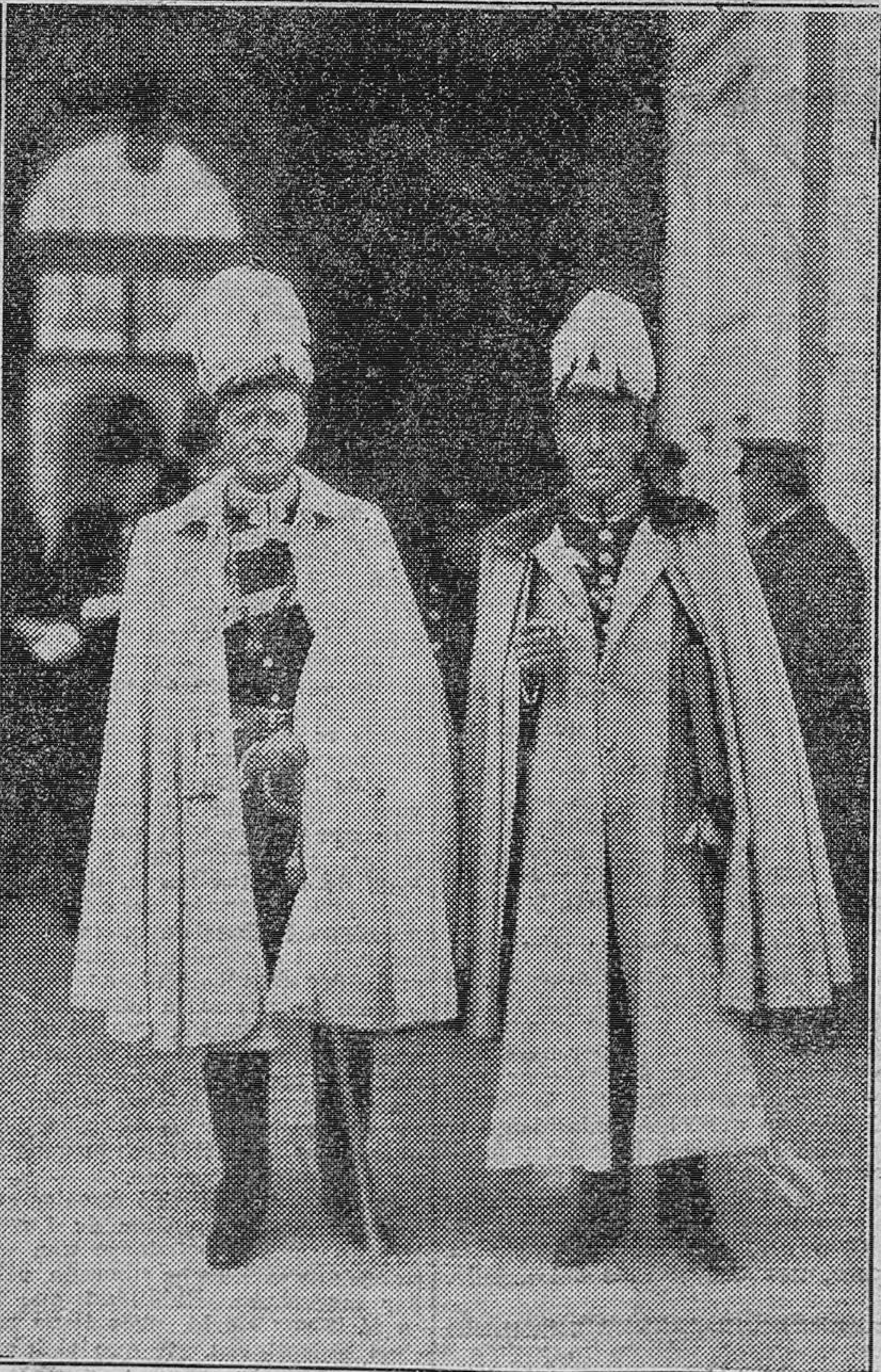
Las señoras duque de Alba y marques de Santa Cruz, saliendo también de Palacio, después de haber sido investidos con el Toisón de Oro.