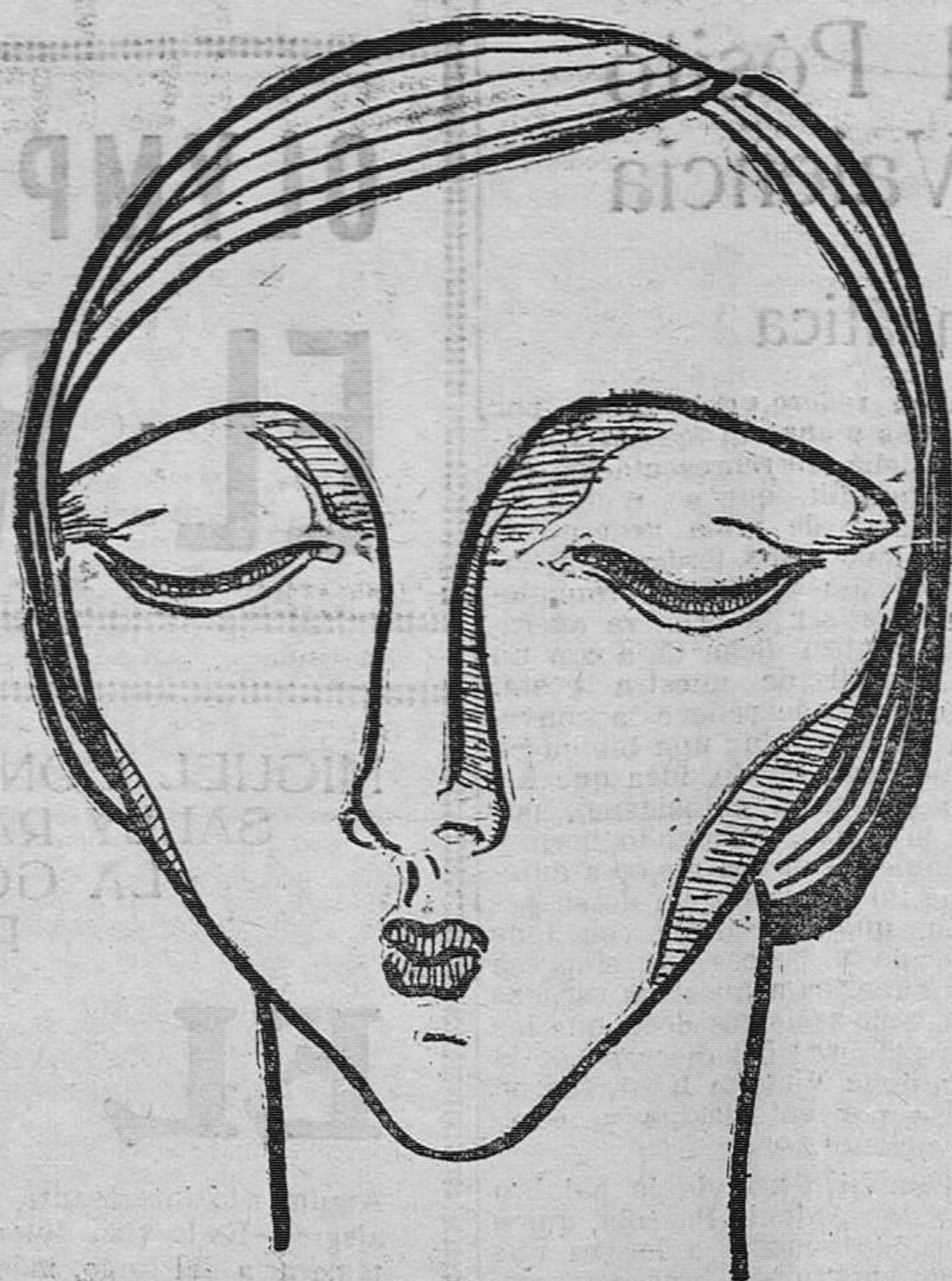
BERTA SINGERMAN, la famosa ricitadora