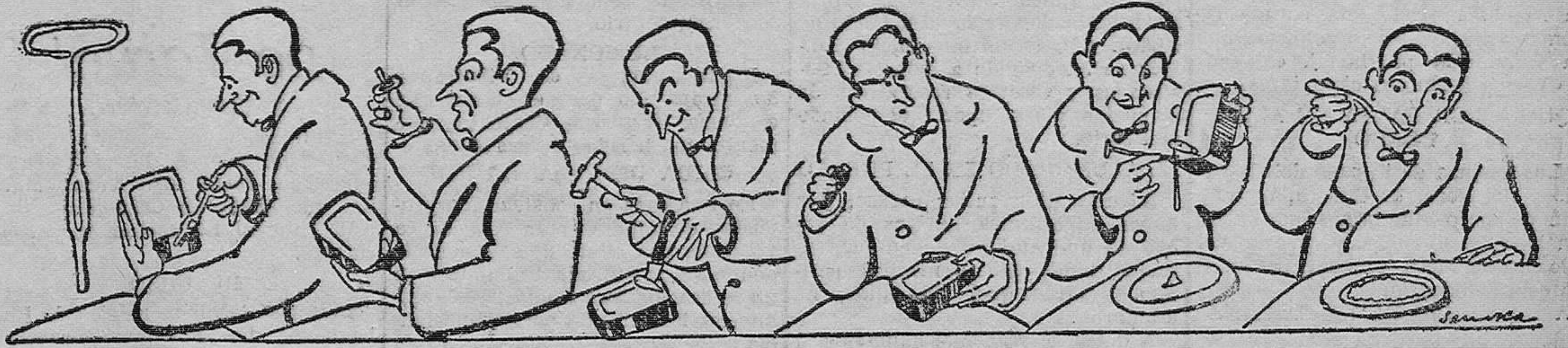
1. Instrumento que facilita el tendero.—2. Primera posición.—3. Rotura infalible de la llave.—4. Se intenta con el cuchillo.—5. Rotura infalible del cuchillo.—6. Y último recurso: sacar el contenido con un clavo.—7. Y comer sardinas en pasta.

duce gran nivelación mental y seriedad de juicio. Pero no conviene abusar de las patatas, porque comiéndolas con exceso causan apatía, pereza e indiferencia. Los que las comen con método son más dados a la meditación que a la vehemencia.