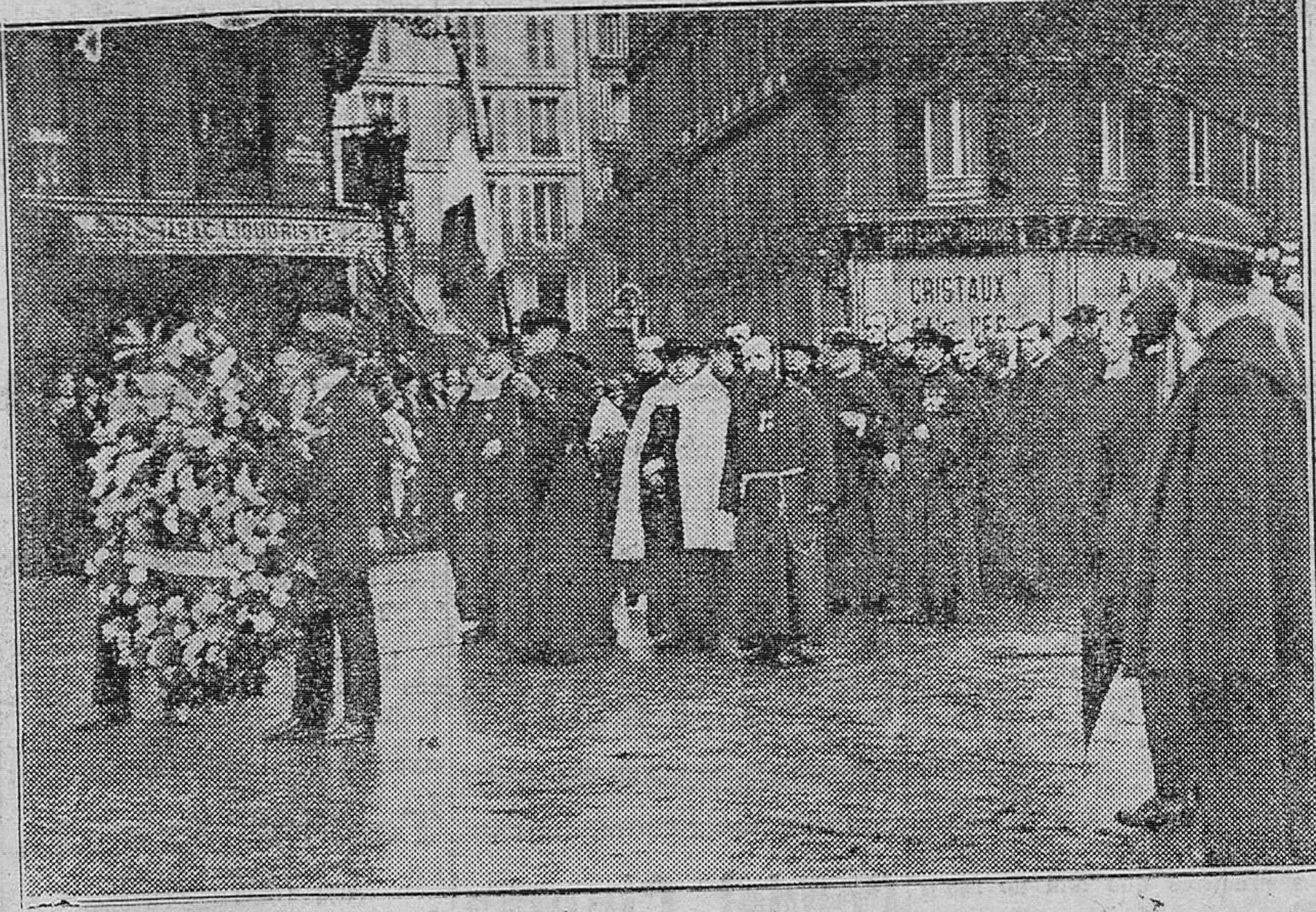
Desfile de la sección de Federación Católica de Francia, por la plaza de San Agustín.