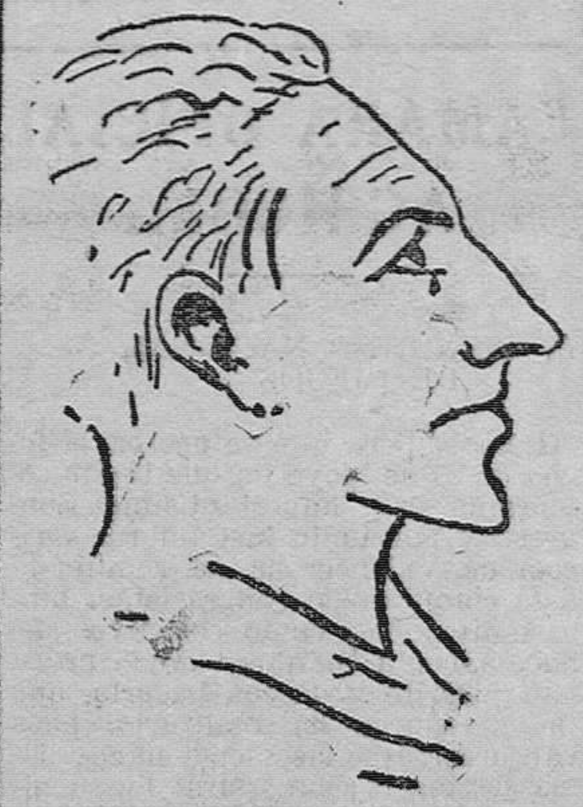
El capitán del Colo-Colo, David Arellano, muerto trágicamente en Valladolid

dre Patria; aprender mucho y marcharnos regocijados como buenos y leales hermanos. El contenido de estas líneas son la mayor elocuencia. Con la de la sinceridad. Equipo formado por una juventud entusiasta, de empleados, profesores, periodistas, estudiantes y obreros, que viene a tender lazos de fraternidad. El alicante de la superación es el signo de estos partidos en el interrogante que se abre a la acción para los próximos partidos del domingo y lunes próximos. El despacho de localidades y entradas se efectuará hoy, de cinco y media a ocho y media de la tarde, en las taquillas del Bar Sol, mañana, de once a una, en las mismas taquillas, y por la tarde en las del campo.