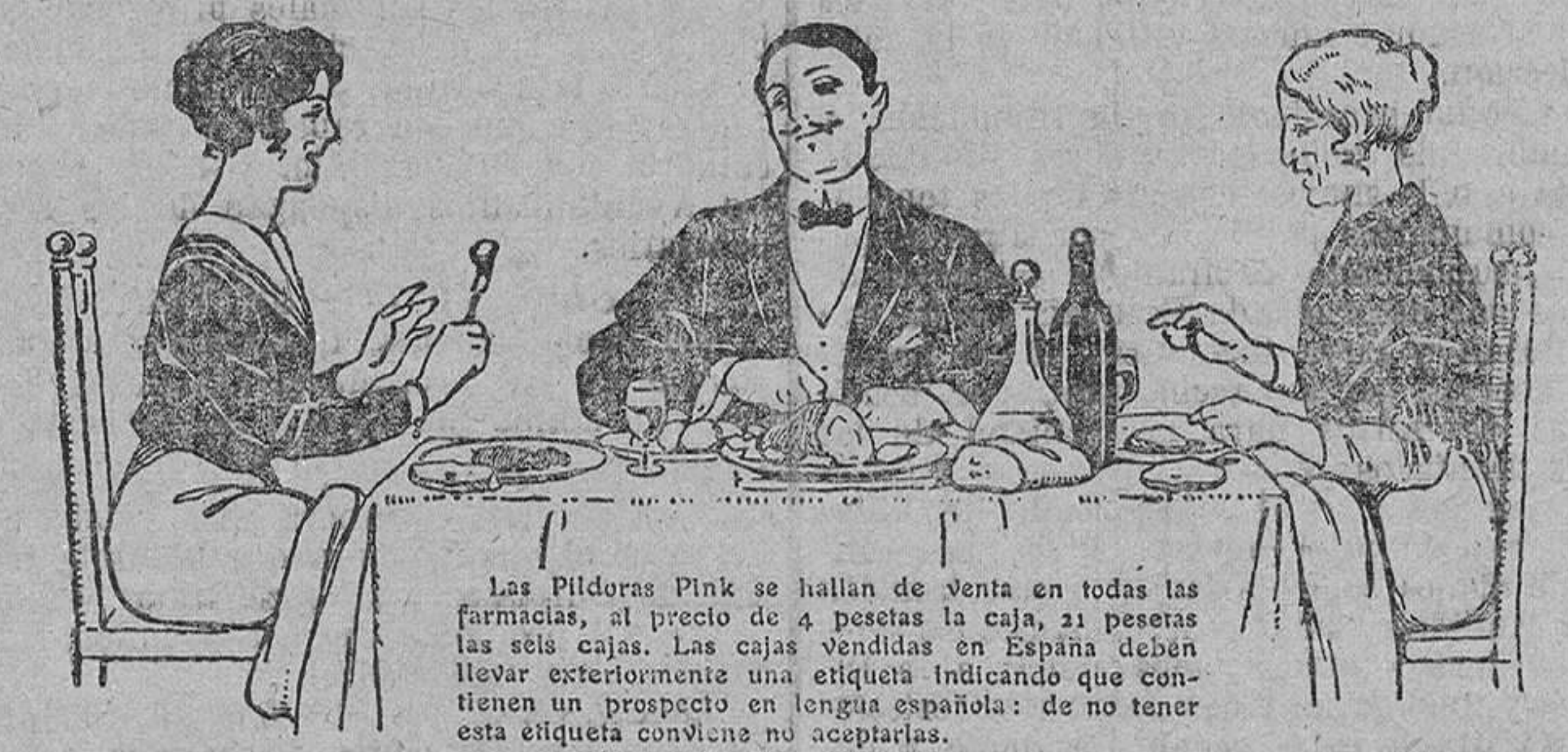
Las Píldoras Pink se hallan de venta en todas las farmacias, al precio de 4 pesetas la caja, 21 pesetas las seis cajas. En las ventas en España deben llevar exteriormente una etiqueta indicando que contienen un prospecto en lengua española: de no tener esta etiqueta conviene no aceptarlas.

—El Ayuntamiento recaudó ayer: Por arbitrio de carnes, 4.717'06 pesetas; por análisis y examen de substancias, 411'42; por entrada de carnos, 15; por arbitrios extraordinarios, 2.735'68.—Total, 7.880'36 pesetas.