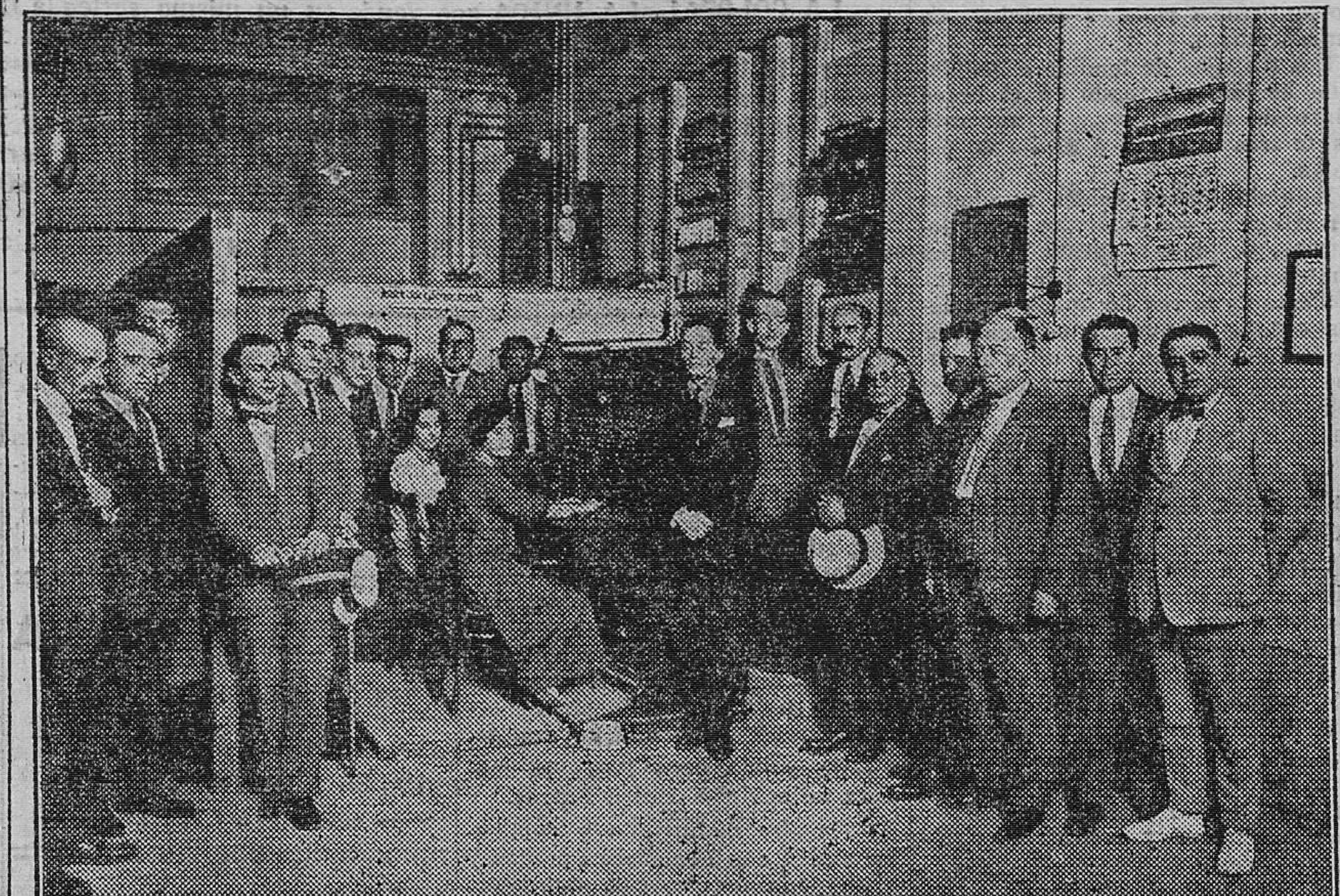
Los periodistas y corresponsales de prensa en su visita a la Central Interurbana de Valencia