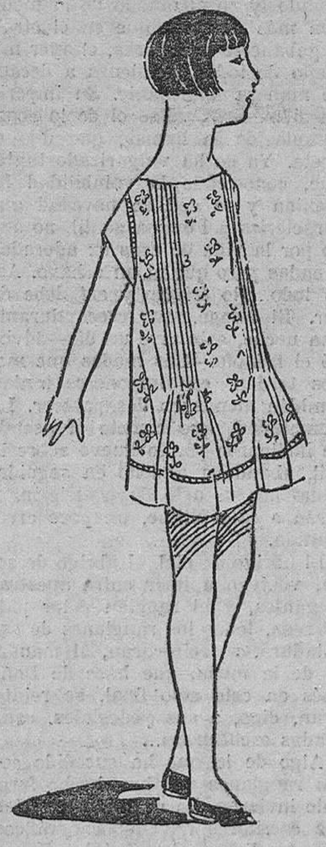
Pequeño vestido en muselina de seda azul, impresa con flores, adornado con un jour y banda lisa color rosa

Pero hasta que este hecho se produzca, hay que recurrir a las prendas de transición, y principalmente al vestido-abrigo. El vestido-abrigo, que representa una fusión feliz de dos prendas en una, es indispensable en el ropero de toda mujer elegante. Las personas de buen gusto se preocupan de las prendas de transición tanto como de las de temporada; en otra forma no es posible estar a tono con los cánones de la moda.