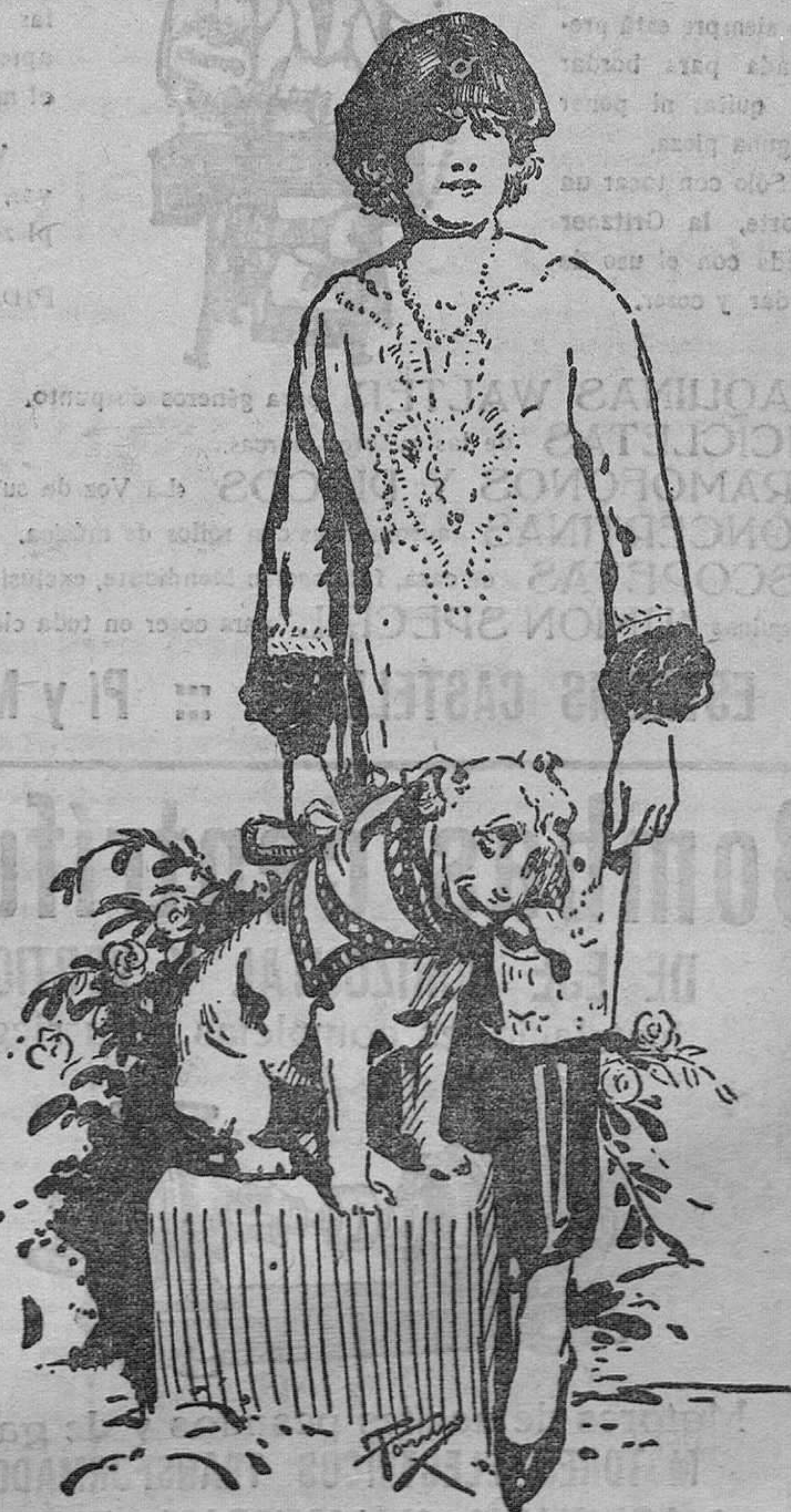
Esta celebrada artista es una muchacha valiente, resuelta y amiga de los deportes. Posee, además de su cultura física, una espléndida cabellera de oro, un rostro terso, de pureza griega; un hermoso collar de perlas y un bulldog inglés, vencedor en varios campeonatos, gloria que estima miss Dupont más aún que sus mejores interpretaciones ante el aparato «tomacista».