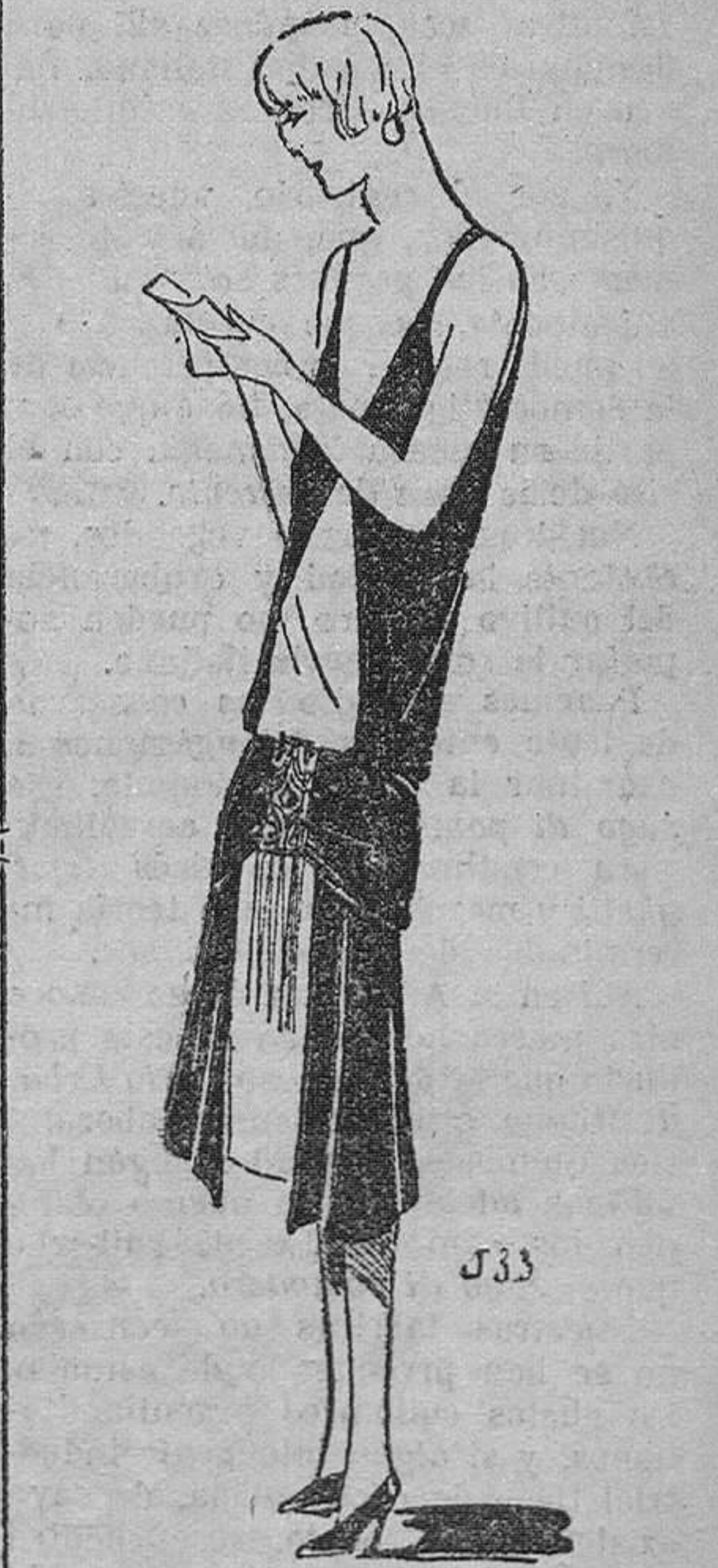
Vestido de noche en terciopelo granate, sobre un bajo de lamé plateado. Cintura drapada sujetándose con un bordado y flecos plateados