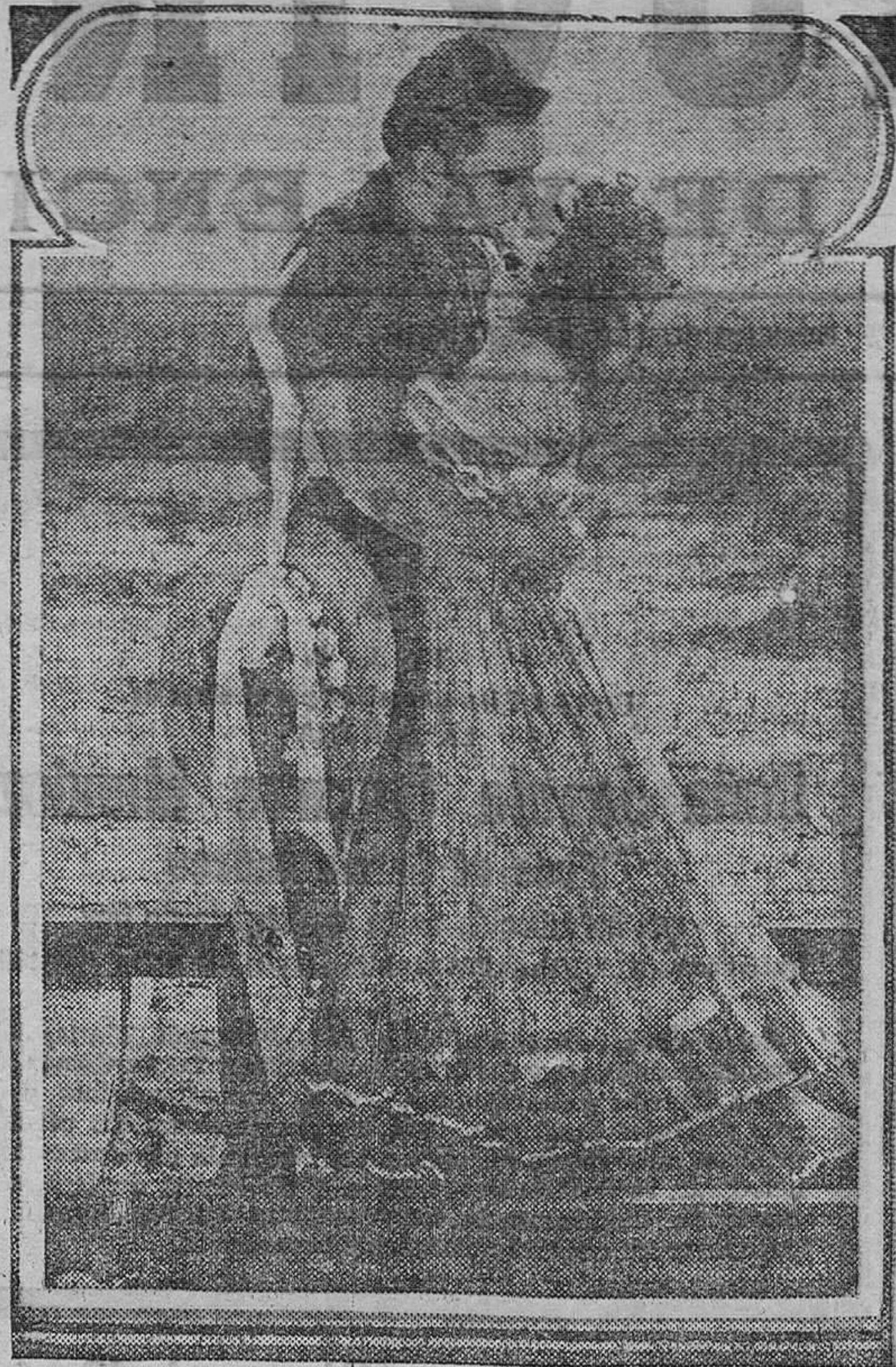
George O'Brien y Madge Bellamy

—Reparaciones en máquinas de coser, de vainica y de hacer medias: Casa Dürkopp, Nave, 14.