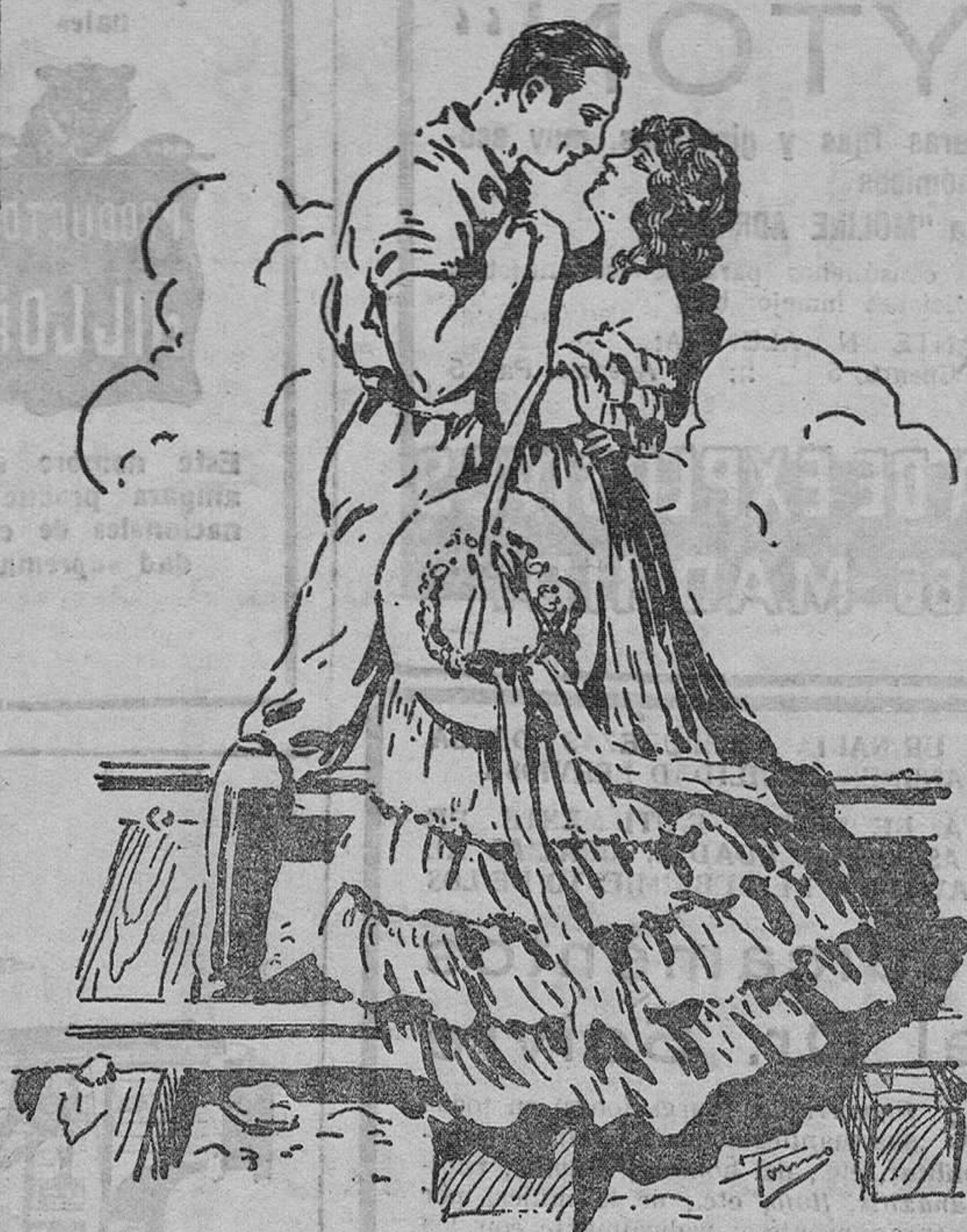
Un momento interesante del emocionante drama cinematográfico de la marca Fox Film «El Caballo de Hierro»