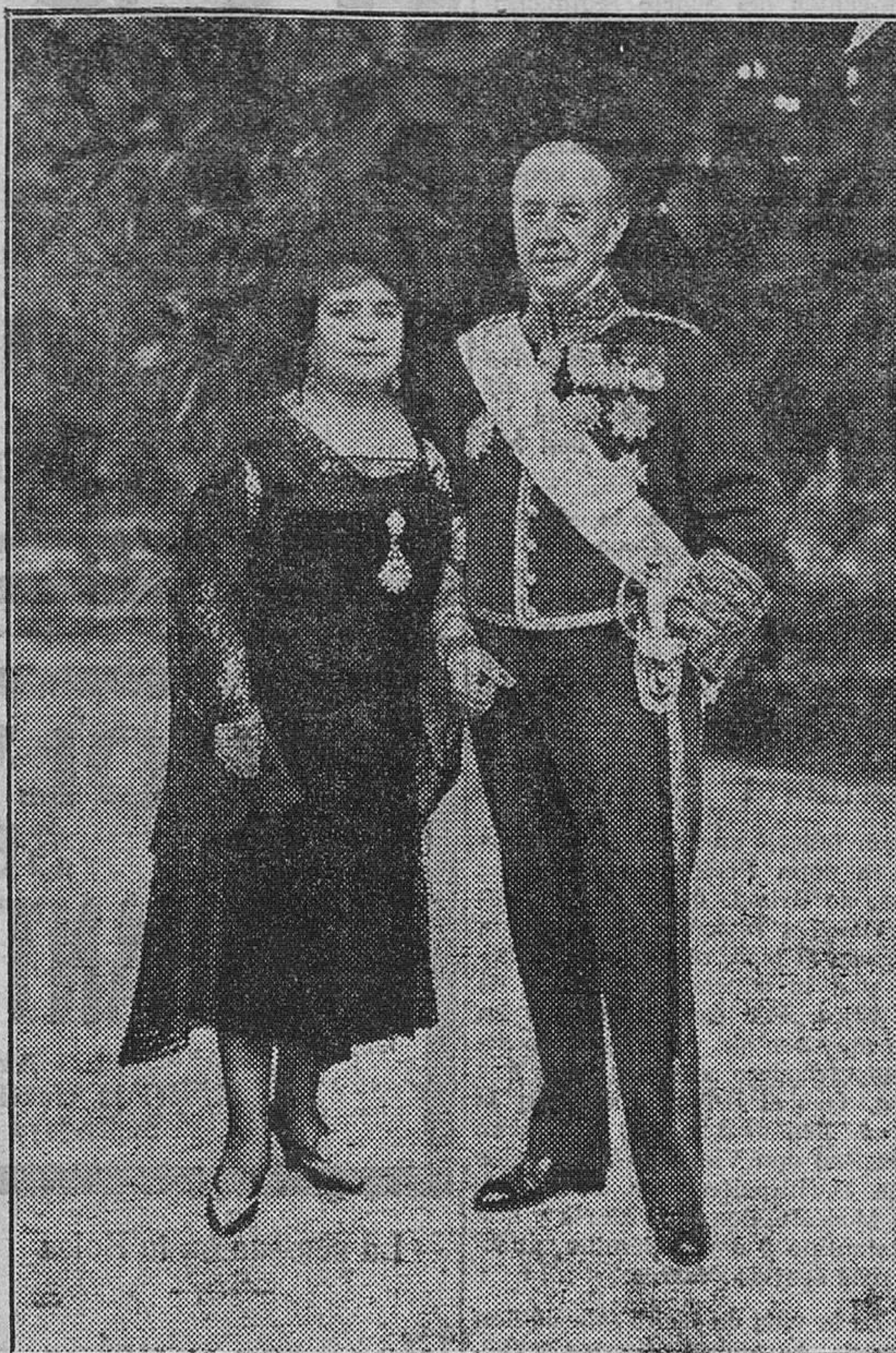
Los señores condes de Ampudia, que contrajeron matrimonio el viernes en la capilla del castillo-palacio de la señora condesa de Ripalda