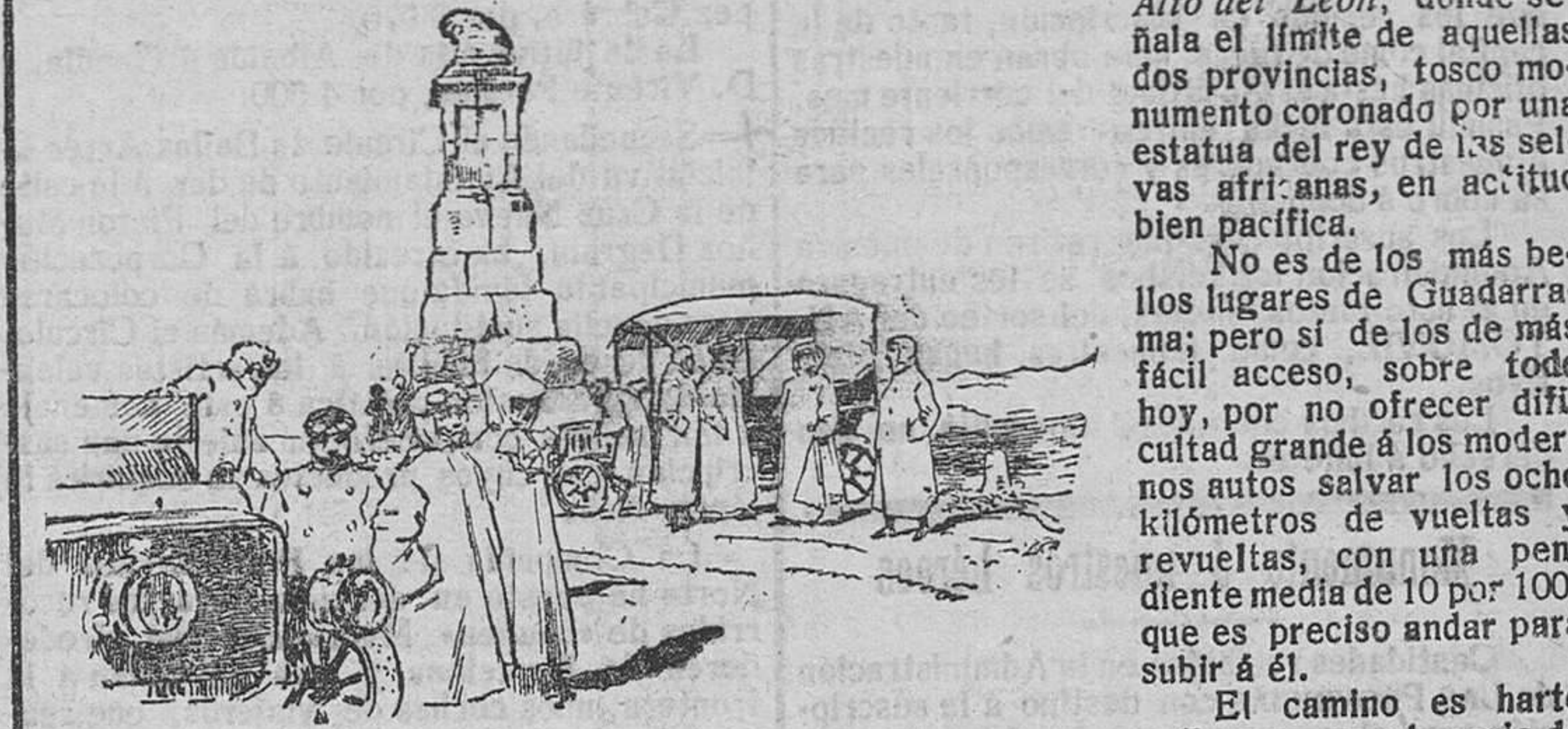
En el Alto del León

De los diversos puntos de salvaje belleza y rudo encanto que á la curiosidad del turista ofrece ese macizo montañoso de la cordillera Carpetana que se extiende entre la provincia de Madrid y la de Segovia, ninguno tan visitado y popular como el puerto de Guadarrama, en el lugar conocido por el Alto del León, donde señala el límite de aquellas dos provincias, tosco monumento coronado por una estatua del rey de las selvas africanas, en actitud bien pacífica.