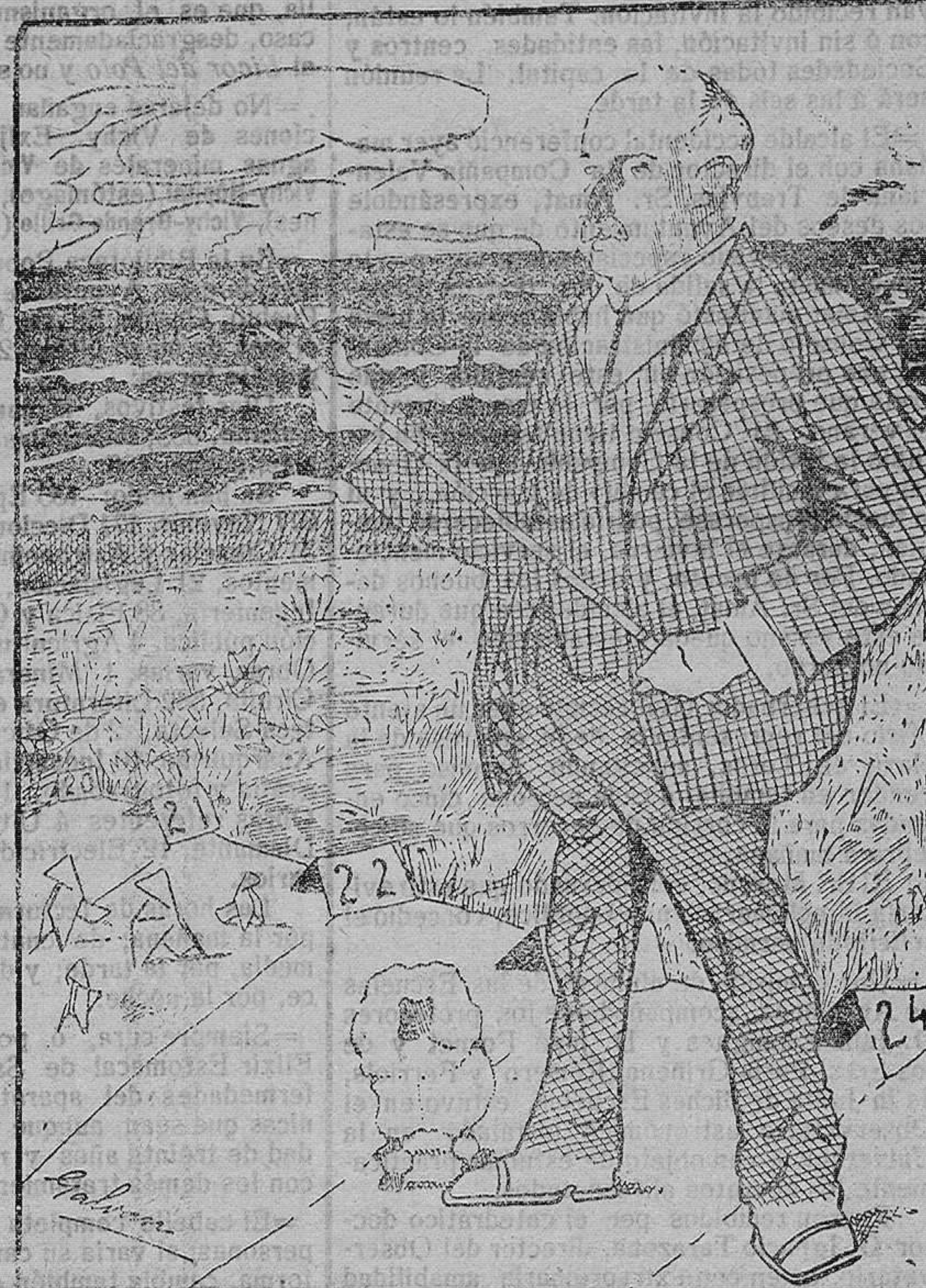
El tiro de pichón. — Forasteros que llegan. — Fiestas en perspectiva. — En el Gran Casino. — Varias noticias.