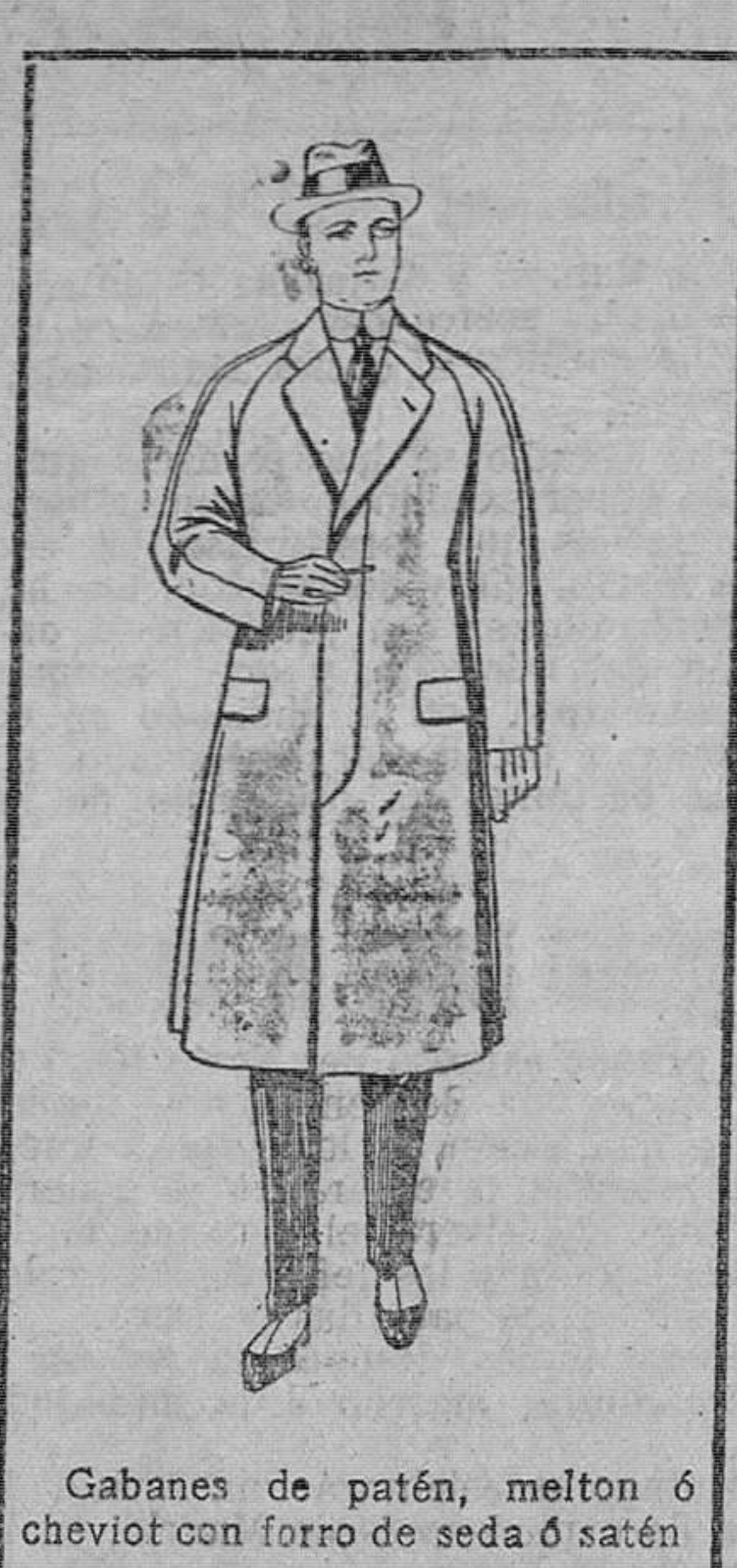
Gabanes de patén, melton ó cheviot con forro de seda ó satén De ptas. 65 á 115

Madrid, Barcelona, Alicante, Almería, Bilbao, Cádiz, Cartagena, Gijón, Granada, Málaga, Palma de Mallorca, Santander, Sevilla, Valladolid y Zaragoza.