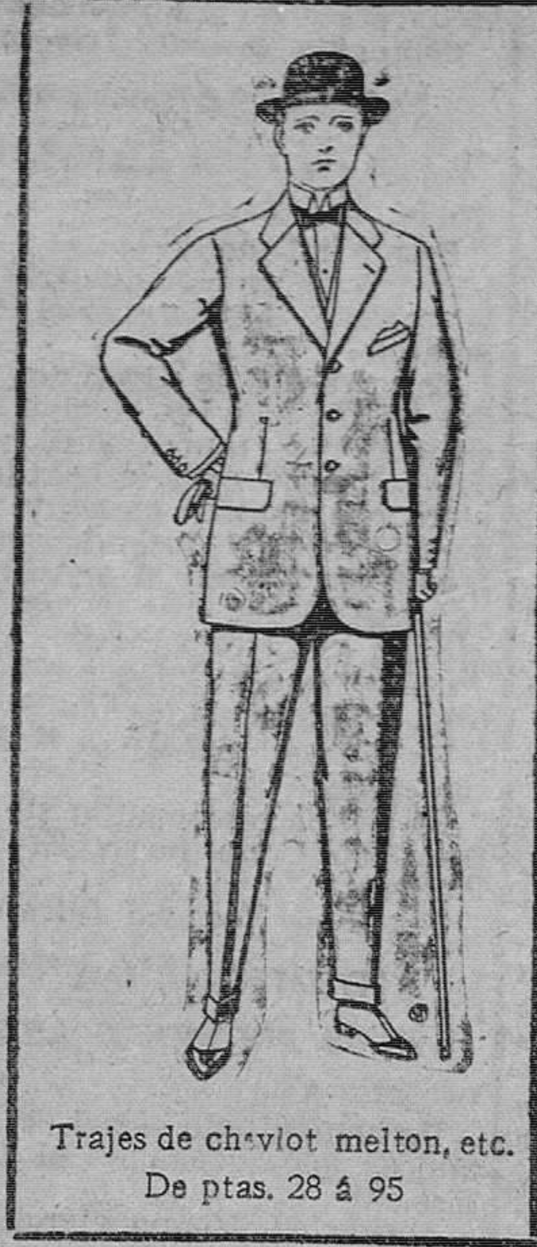
Trajes de cheviot melton, etc. De ptas. 28 á 95