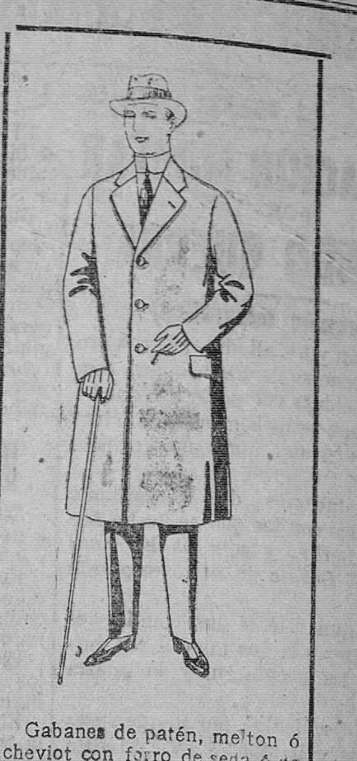
Gabanes de patén, melton ó cheviot con forro de seda ó satén. De ptas. 65 á 115