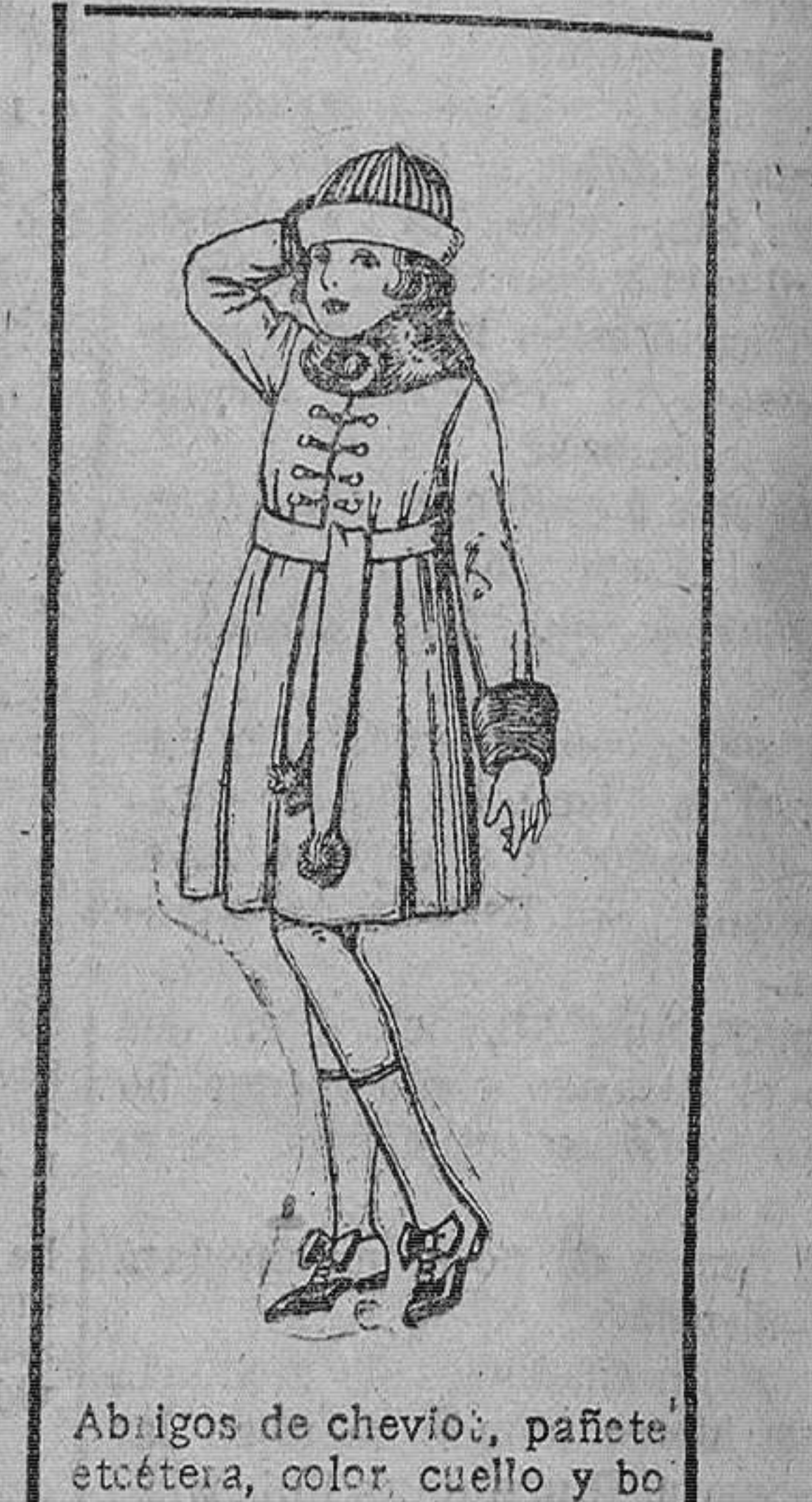
Abrigos de cheviot, pafete etcétera, color, cuello y botamanillas pie, para niñas de 7 á 15 años. De ptas. 46 á 49