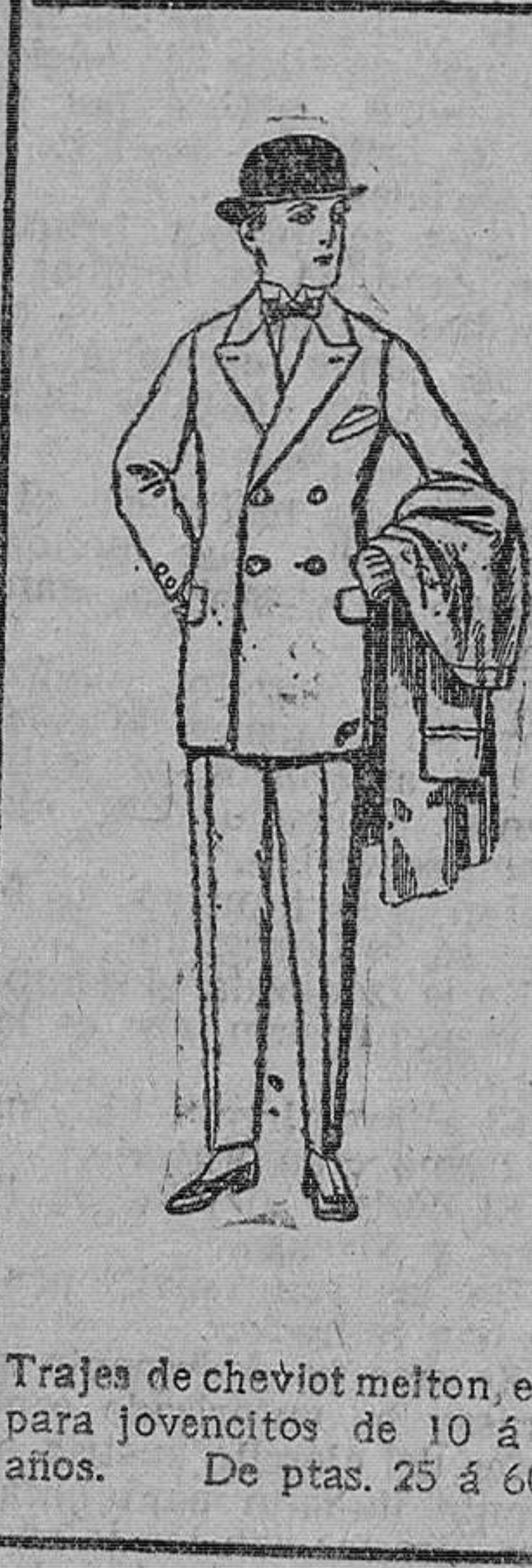
Trajes de cheviot melton, etc. para jovencitos de 10 á 16 años. De ptas. 25 á 60