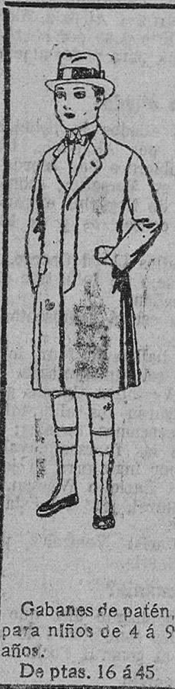
Gabanes de patén, para niños de 4 á 9 años. De ptas. 16 á 45