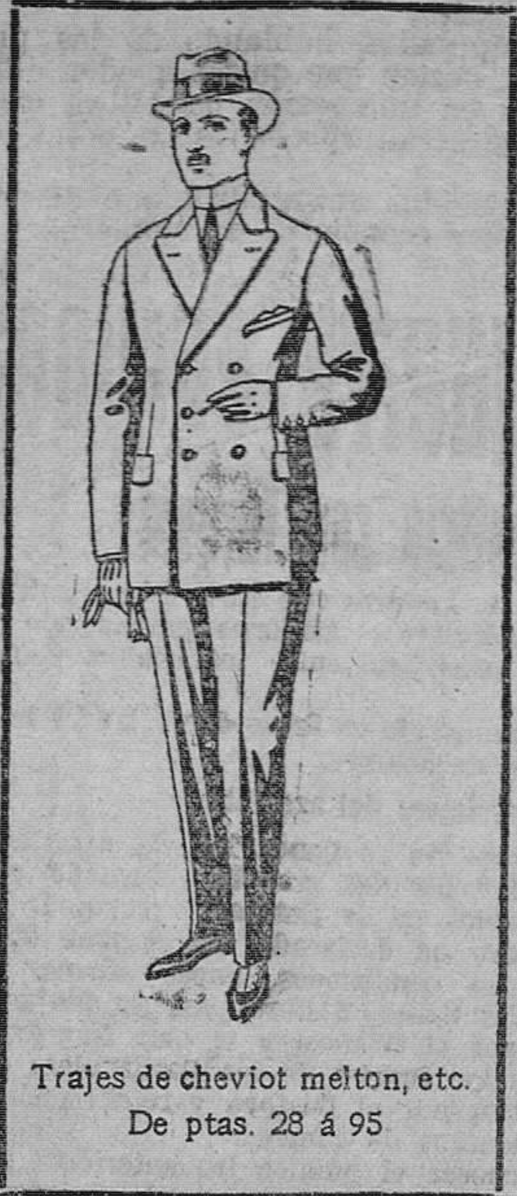
Trajes de cheviot melton, etc. De ptas. 28 á 95