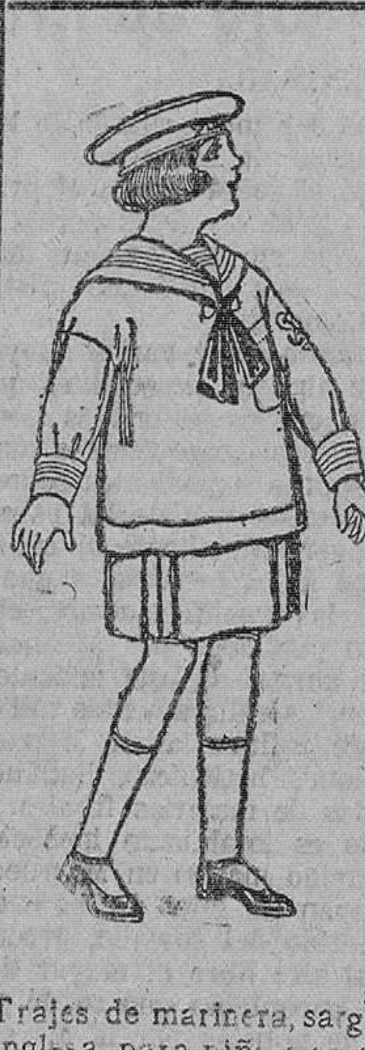
Trajes de marinera, sarga inglesa, para niñas de 6 á 9 años. De pesetas 25 á 43