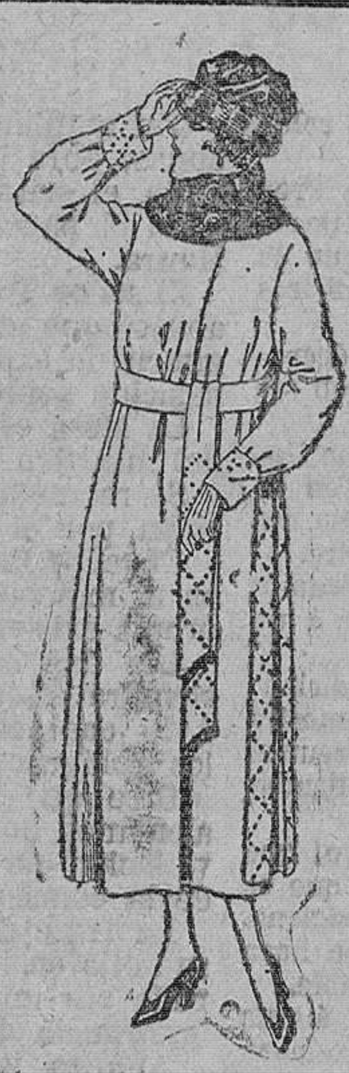
Abrigos de púfete, gamuza gruesa, en negro azul y color anillo piel. de pta. 100 á 120.

Camisería, Géneros de punto, Corbatería, Guantería, Sombrerería, Zapatería, Paraguas, Bastones y Artículos de viaje