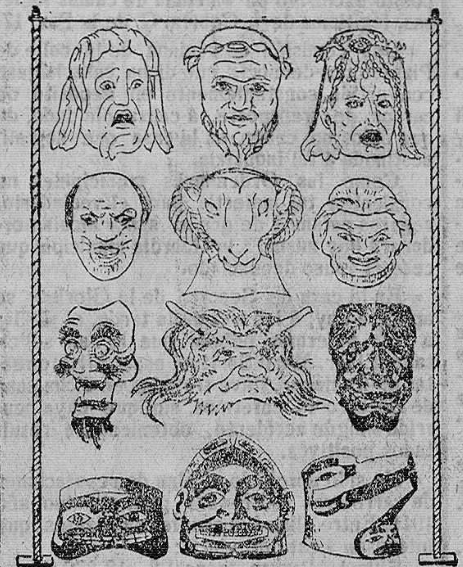
Caretas griegas, romanas, japonesas y americanas pro-colombinas.

LA CARETA Sus orígenes.—Sus aplicaciones y su historia. La japonesa y la americana