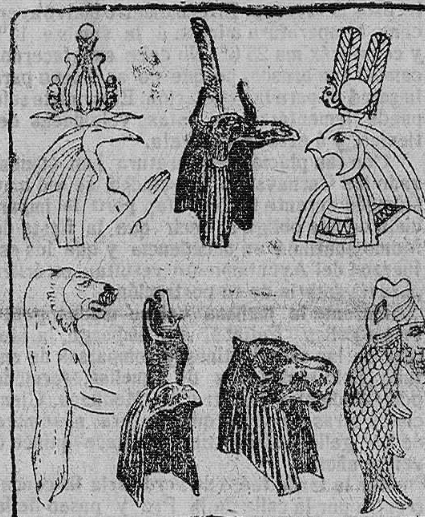
Caretas egipcias y arias

Según los historiadores y la Arqueología, la careta tiene su origen en el antiguo Egipto, cuyos naturales la empleaban, principalmente, para cubrir el rostro de los cadáveres.