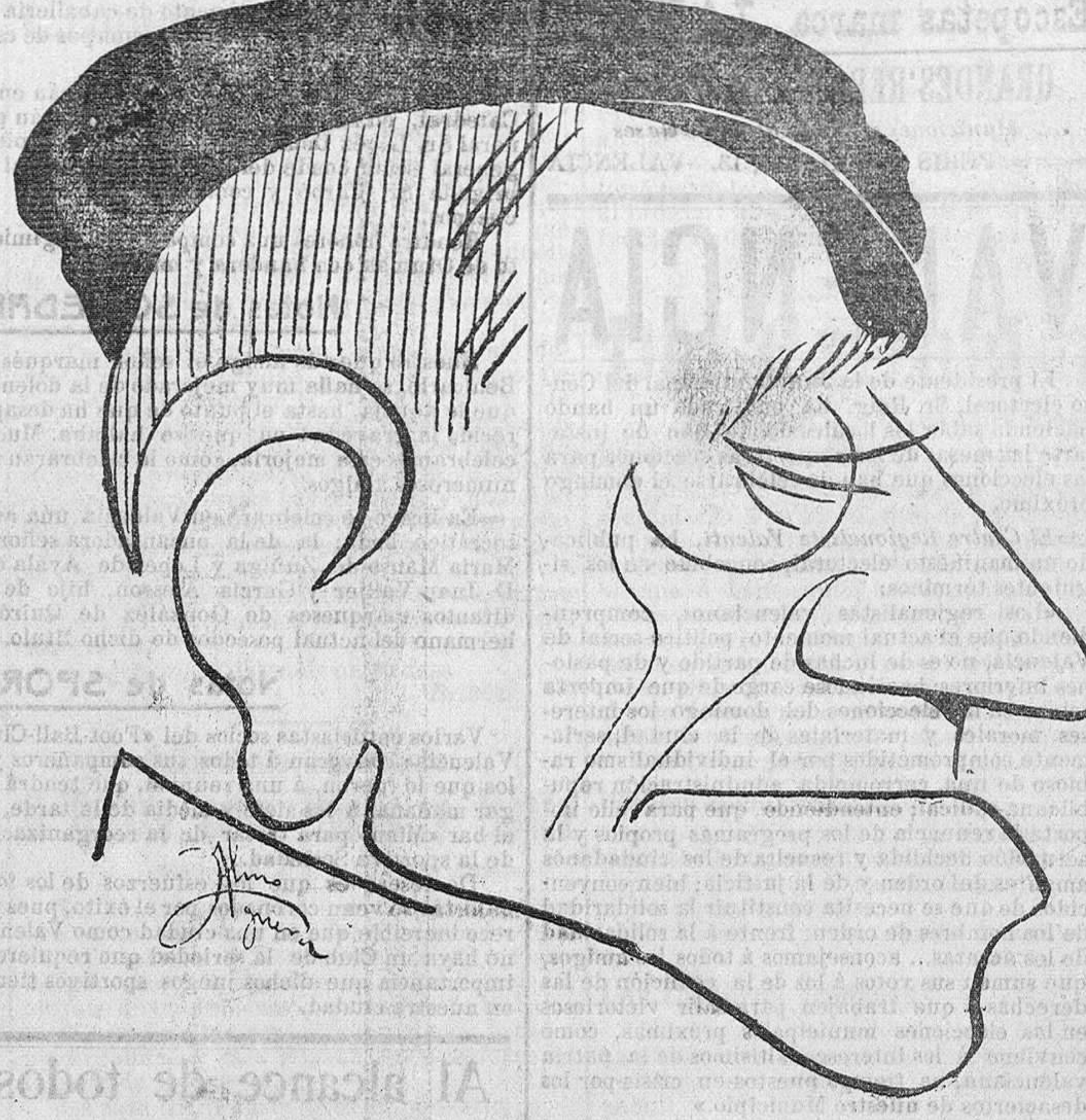
que se despidе, actualmente, del público valenciano desde el escenario de Apolo

mayoría la bicicleta, lo mismo viejas que jóvenes, y que, por dejarlas pasar con este vehículo, muchas veces se detiene un carruaje. Algunas otras observaciones he hecho, pero es tarde y precisa el descanso. Otro día continuaré.