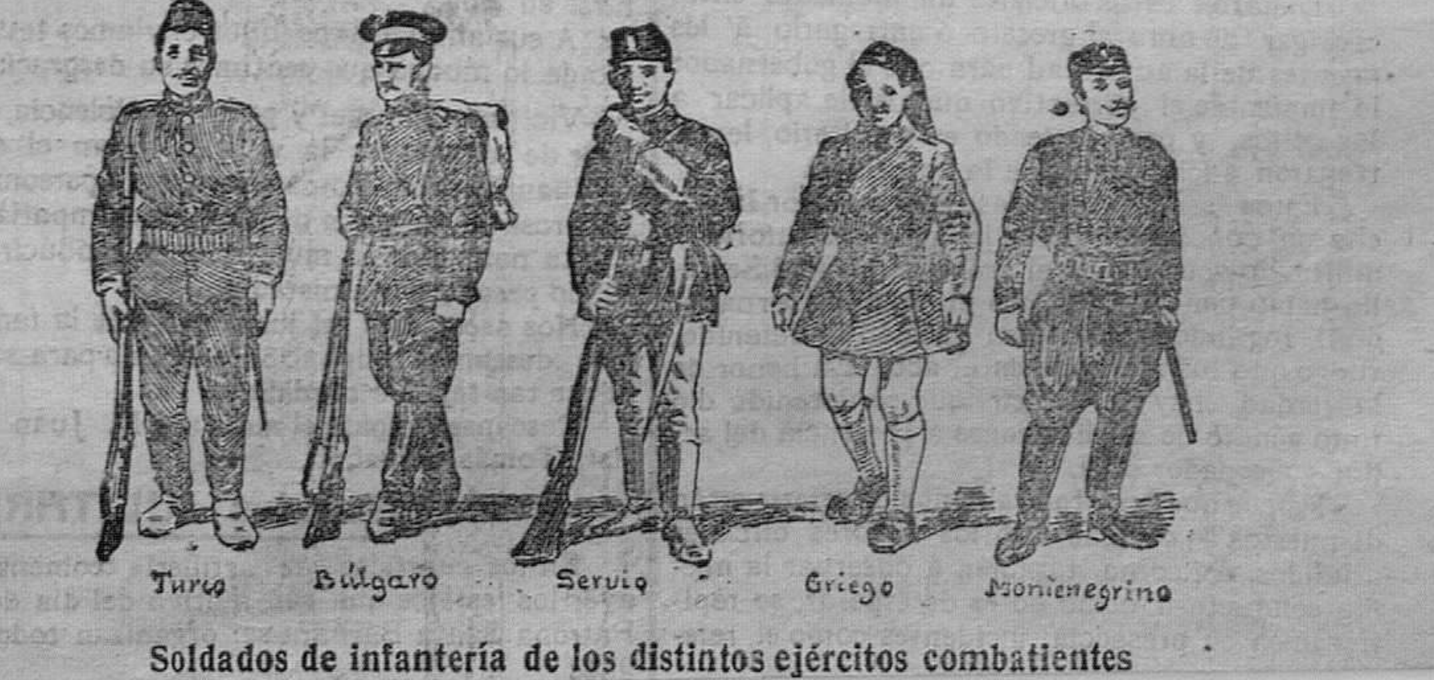
Soldados de infantería de los distintos ejércitos combatientes