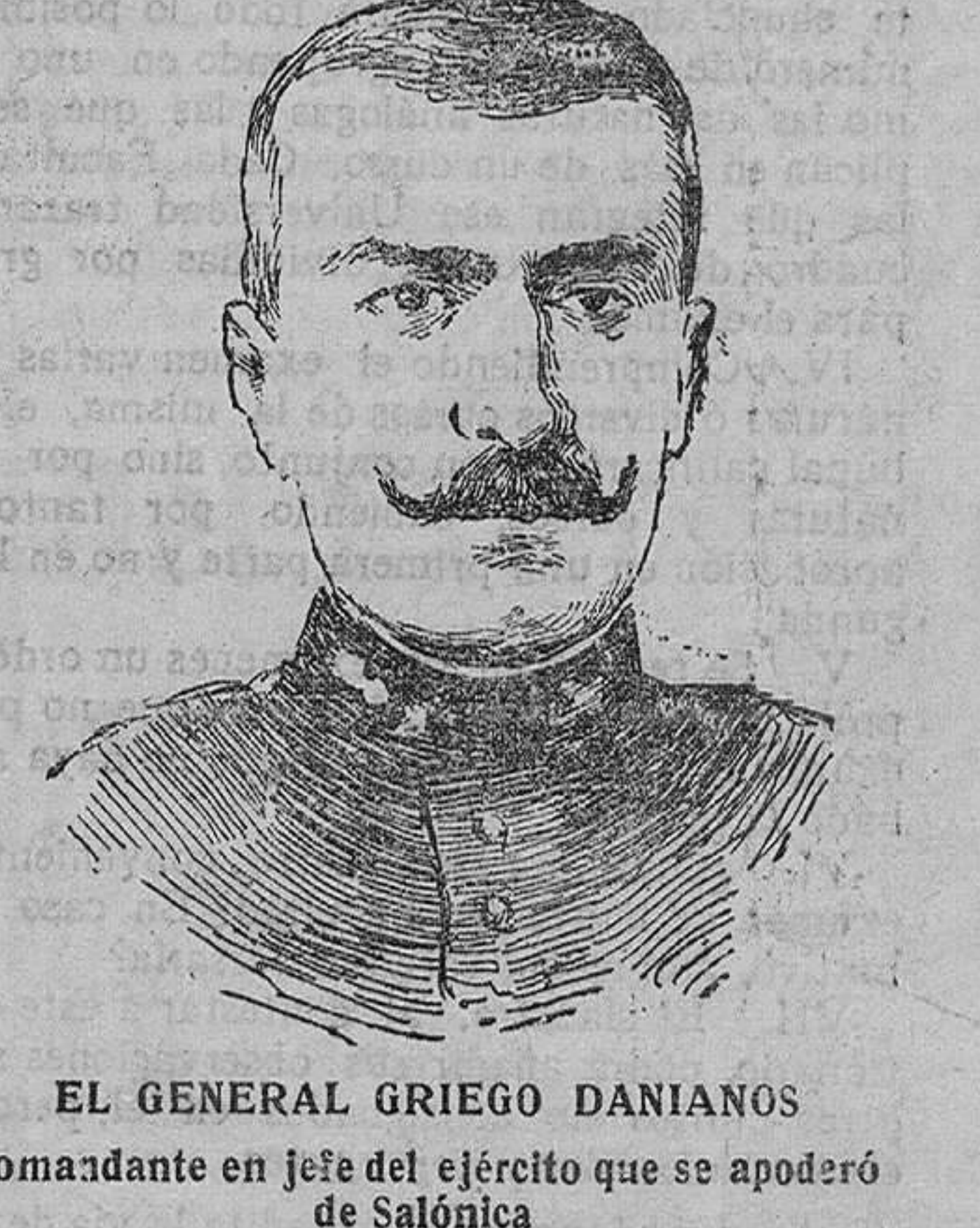
EL GENERAL GRIEGO DANIANOS comandante en jefe del ejército que se apoderó de Salónica