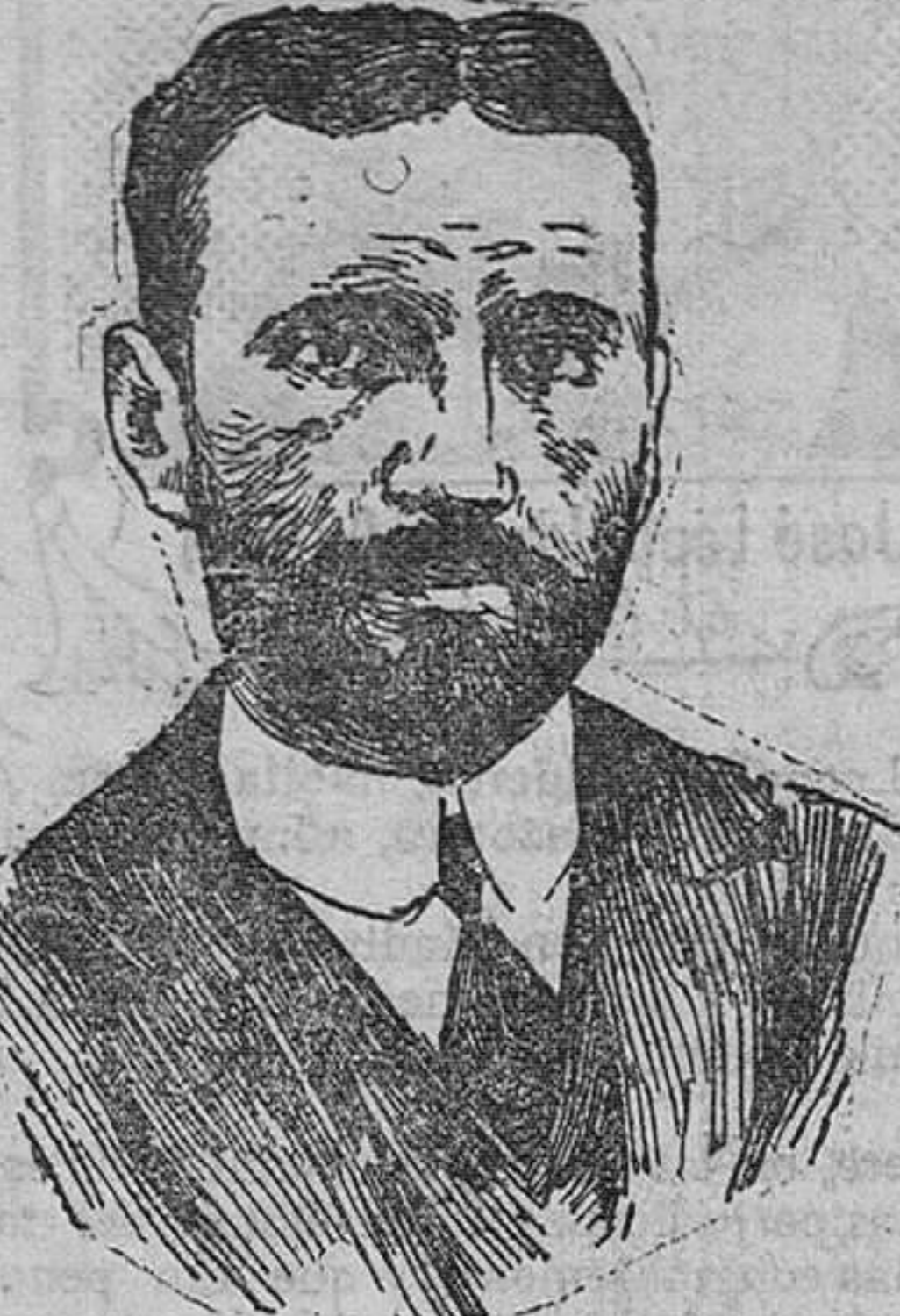
Mario G. Menocal, nuevo presidente de la república de Cuba.

El Diario de Cádiz , bien informado de los asuntos cubanos, publica una biografía del nuevo presidente, don Mario Menocal, elegido hace pocos días. El eminente político antillano nacido en 1866, de una distinguida familia de Matanzas. Es joven, pues no cuenta más que cuarenta y seis años, pero antiguo en la política de su país, en la que figuró hace muchos años. Al terminar la guerra fué nombrado jefe de policía de la Habana, y pasó luego á la Inspección de Obras públicas. En ambos cargos prestó á su patria importantes servicios. Poco después, en 1899, abandonó la política para entregarse á empresas comerciales y agrícolas. Entonces se encargó de la gerencia del Gran Centro Chapparra, el mayor ingenio del mundo, y consiguió en su negocio, que todavía dirige, una envidiable prosperidad. Sus amigos políticos, que confían en las dotes de mando de Menocal, presentaron su candidatura en las elecciones de 1906, contra José Miguel Gómez. Menocal fué derrotado. Ahora han vuelto á presentarle, y su nombre ha triunfado, á pesar de que Menocal y sus adeptos no han hecho campaña de propaganda electoral. El nuevo presidente goza de alto prestigio entre las clases directoras de Cuba, que confían en una gestión política provechosa y lucida.