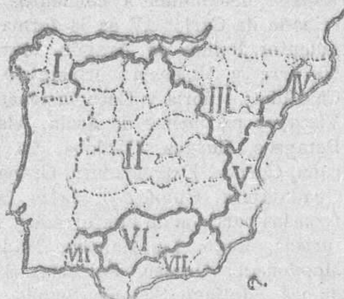
Regiones según Rafael Ballester

El profesor Ballester, autor de bellos manuales, dibuja, respetando la demarcación provincial, las siguientes regiones: I, Septentrional; II, Central; III, Ibero-pirenaica; IV, Medite-