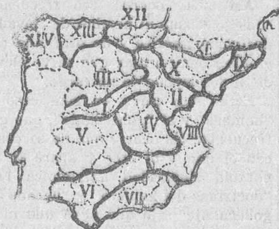
Regiones según Luis Doporto

las siguientes regiones: I, Central; II, Idúbeda (empleando la palabra resucitada por Beltrán y Rózpide); III, Región de la meseta del Duero; IV, Manchega; V, Bético extremeña; VI, Bética; VII, Penibética; VIII, Levantina; IX, Catalana; X, Ibérica o del Ebro; XI, Pirenáica; XII, Vasco-cán-