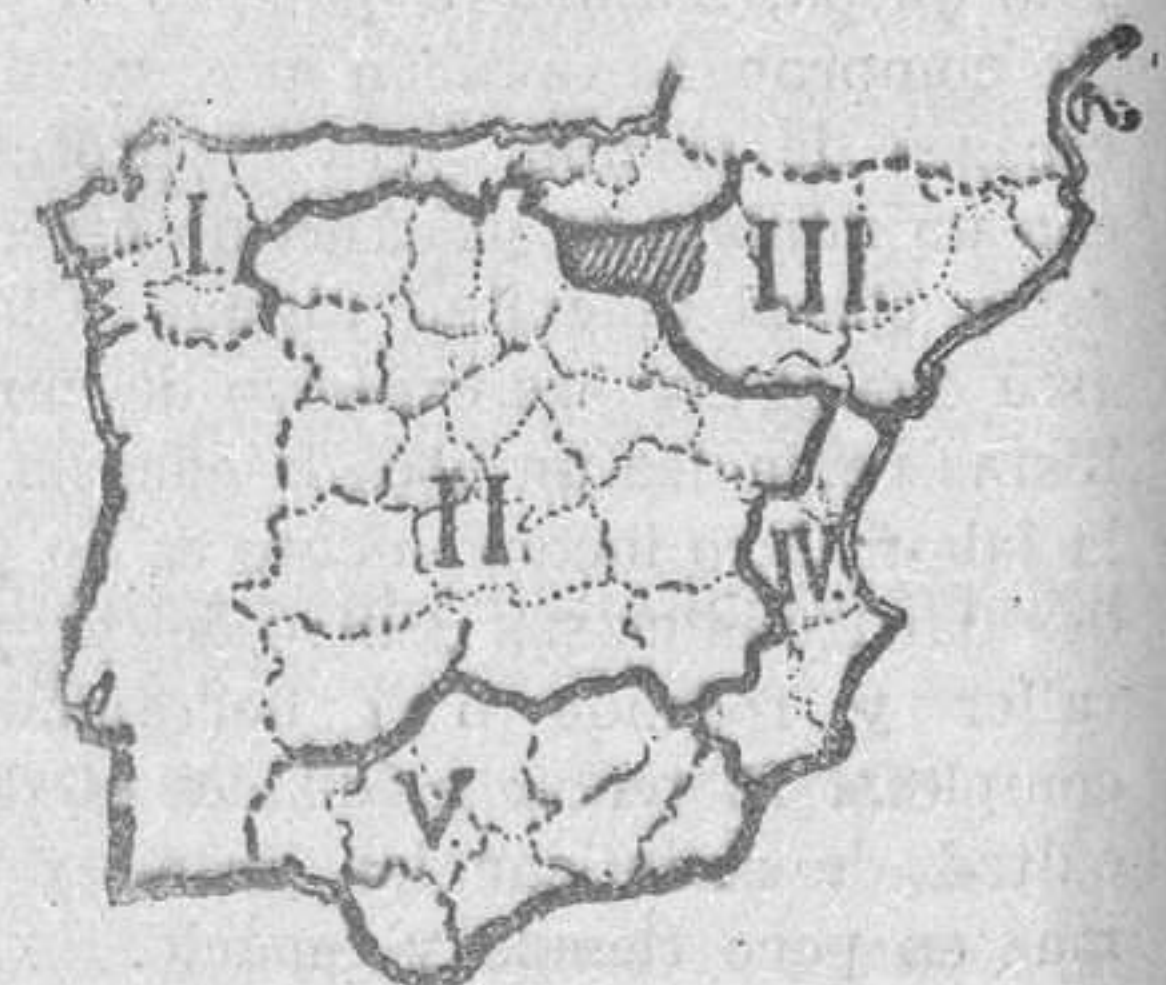
Regiones según Izquierdo Croselles

regiones: I, Valle Central del Tajo; II, Meseta del Duero en Castilla la Vieja y León; III, País cántabro-astúrico-galáico; IV, País vasco español en la zona litoral del golfo de Vizcaya; V, Valles superiores del Duero y del Ebro; VI, Región del Ebro medio; VII, Cuenca superior del Guadiana y Altos Valles del Júcar, Tajo y Turia; VIII, La Mancha y el país del Guadia-