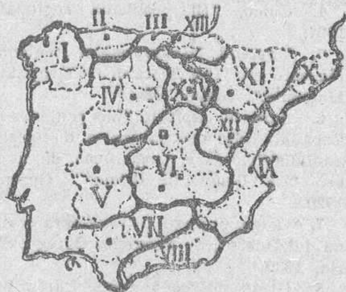
Regiones según Pedro Chico

Y catorce regiones traza el profesor Santaló en el vol. III de la Geografía publicada por el Instituto Gallach de Barcelona: I, Central (montañas y valles entre las cuencas del Duero y del Tajo); II, Manchega (parte oriental de Castilla la Nueva y provincia de Albacete); III, Oretana (al N. de la anterior, hasta Portugal); IV, Cas-