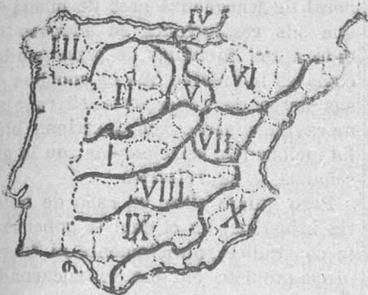
Regiones según Beltrán y Rózpide

to y Guadalete, y X, Región litoral del Mediterráneo, con sus tres aspectos penibético, levantino y catalán. (Para mayor detalle de estos ensayos de cla-