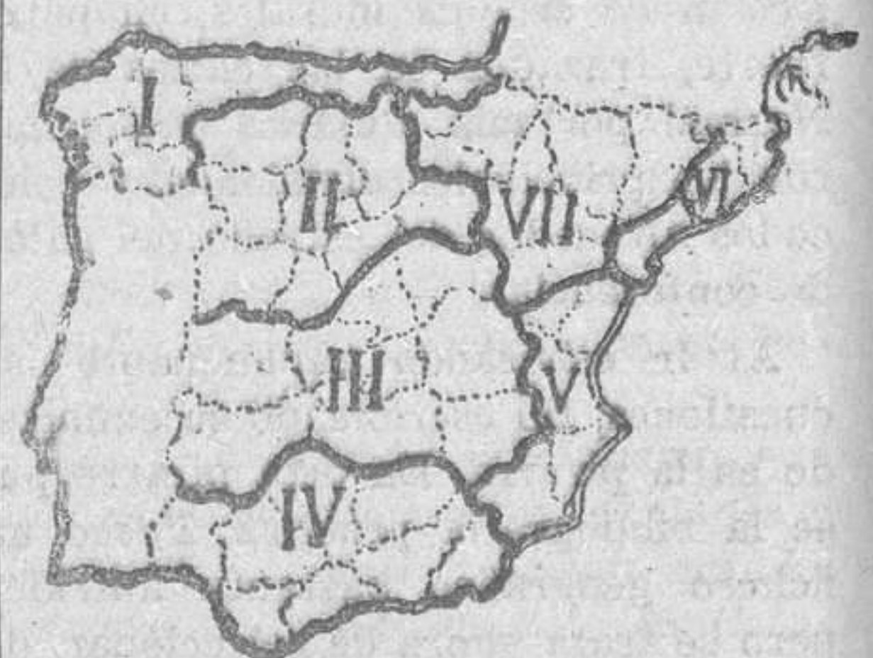
Regiones según Antonio Blázquez

Nuestro Maestro Beltrán y Rózpide rompe abiertamente con las líneas administrativas y dibuja y explica (véanse sus libros y programas) diez